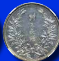
Kina Silvermedalj (50 cents) 1936

Vi har kunder över hela världen och därmed mycket goda möjligheter att sälja just dina objekt. Bättre mynt och hela samlingar mottages löpande, så att just dina objekt kan marknadsföras mer. Kontakta oss för en förutsättningslös diskussion! Välkommen in med dina objekt!