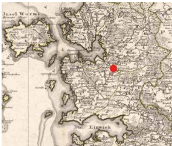
1. Läget för byn Kirimäe i västra Estland. Karta: Mellin 1798 med tillägg av författarna.

Föremålen i fyndet (nu 216 mynt, 19–20 tackor och nio ornament eller fragment av sådana) visar samman-