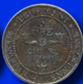
5 öre provmynt Ex. Ekström