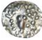
2a–b. Mynt från kung Knut Eriksson (1167–1196) ur Kirimäe-fyndet.

Åtta av mynten (i olika varianter) har svärd till vänster och spira till höger (Fig. 2a) och tre har en lilja till vänster och ett kors till höger (Fig. 2b).