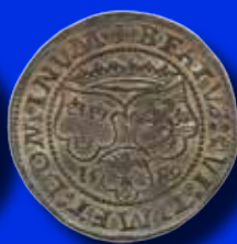
1 mark 1559