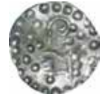
4. Ärkebiskopen i Uppsala? Penning cirka 1190–1210. 0,31 g. EAM, inv. AM 41 261.