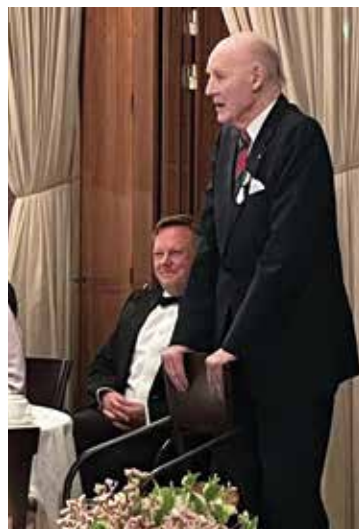
Tacktalet på Operaterrassen i maj 2023.