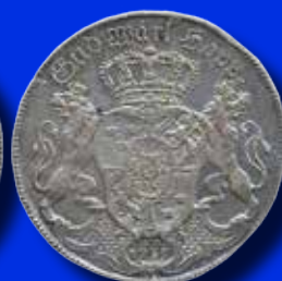
1 riksdaler 1731