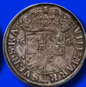
8 mark 1664