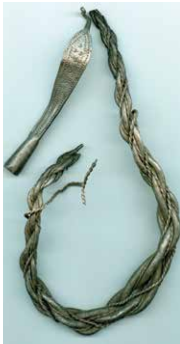
9. Halsring som hittades i två delar (2021 och 2022). Halsringsändan som hittades 2021 syns i Fig. 8, nr 2 uppifrån i vänstra raden.