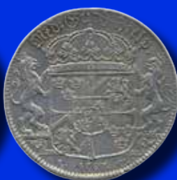
1 riksdaler 1707