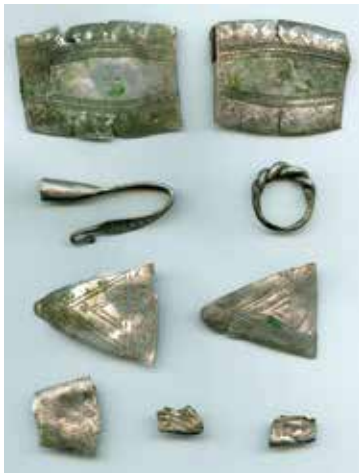
8. Några av de smycken och delar av sådana som ingår i Kirimäe-fyndet.