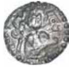
3. Mynt från kung Knut Eriksson (1167–1196) ur Kirimäe-fyndet. Varianten är välpräglad och har en spira till vänster och ett föremål i handen till höger samt omskriften IVA (eller AIV). 0,23 g.