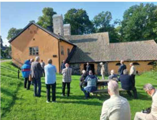
Österbybruk och smedjan.