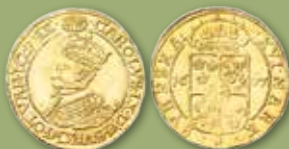
16 mark 1607.