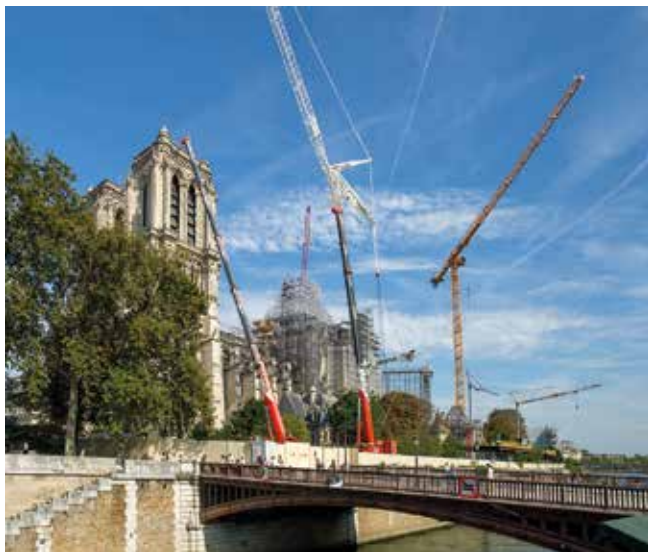
Notre-Dame de Paris klädd i byggnadsställningar under det omfattande restaureringsarbetet.