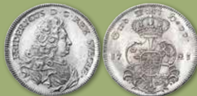
Riksdaler "Krell" 1723.