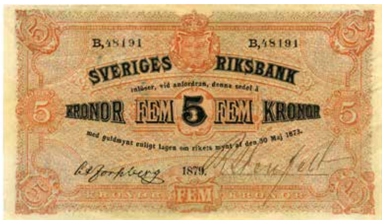
Riksbankens sedlar i kronvalörer gavs ut från 1874. Originalmått på den här avbildade är cirka 121×70 mm.

”Kommitterade äro visserligen för sin del fullt öfvertygade derom, att det internationella myntsysteem icke på