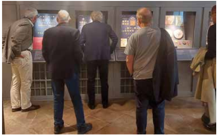
Årsmötesdeltagare studerar montrarna på kabinettet.