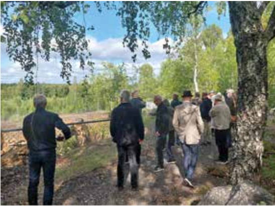
Besök vid Dannemora gruva.