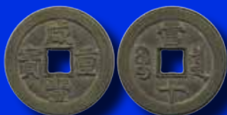
Kina 10 cash ND (1854), "Mother coin" 351 000:-