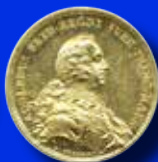
Kronprinsen inrättar en kadettskola 1748 302 000:-