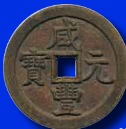
Kina 500 cash ND (1854) 242 000:-