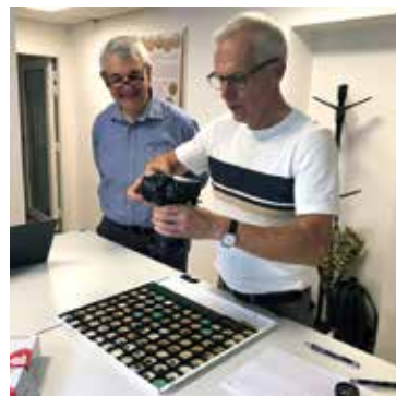
Bosse tar en översiktsbild på en av brickorna innan arbetet påbörjas.