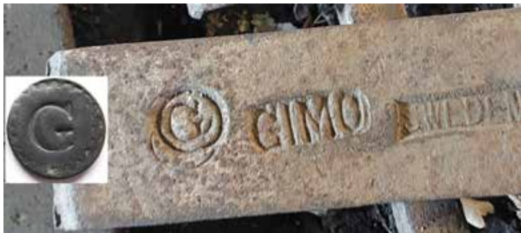
G för Gimo både på metallten och polletten.