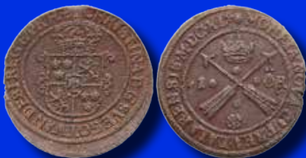
1 öre 1644 med arabisk 4 31 000:-

Objekt (inkl. köparprovision) som såldes på vår stora myntauktion 11 november: