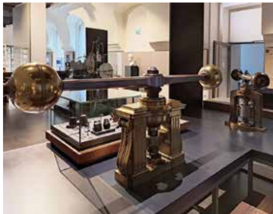
I ett av rummen i La Monnaies enastående utställning fick man se myntningsteknik med bland annat magnifika skruvpressar.