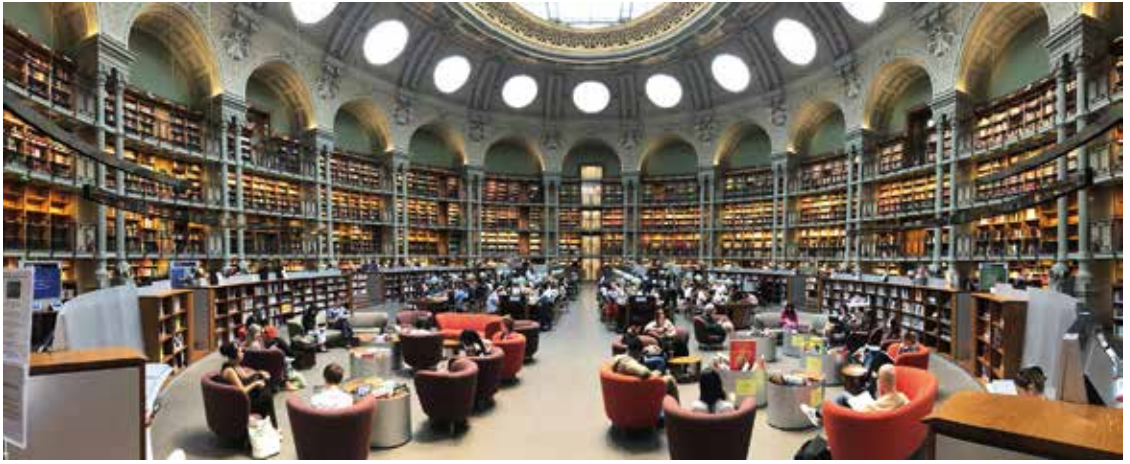
Den Ovala Salen, bibliotekets magnifika läsesal med cirka 20 000 volymer och 160 läsplatser.