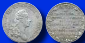
1/3 riksdaler 1782 Prins Karl Gustafs födelse 49 000:-