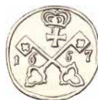
Riga, S:t Georg 1667.