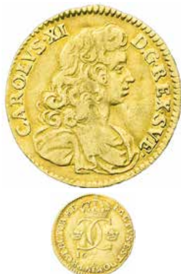
4. Porträtt utan harnesk; dukat 1683, SM 41. Ex Myntauktioner i Sverige auktion 27, nr 133.

Om man studerar de sex mynten hos Falcoin ser man en tydlig skillnad mellan två olika varianter. Fyra mynt kännetecknas av att på åtsidan är harnesket försett med nitlar och den överfallande manteldraperingen är kort, frånsidans årtal är asymmetriskt placerat. Två av mynten utmärker sig genom att sakna nitlar på harnesket, som dessutom är mycket diskret, ha en längre manteldrapering och ett symmetriskt placerat årtal – det rör sig alltså om Bonnier 13. Ett av de två bevarade exemplaren (det andra fanns till salu 2017 hos en grekisk mynthandlare) såldes av Myntauktioner i Sverige AB på auktion 36 som nr 233. Detta är samma exemplar som såldes av Schulman 1933.