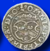
2 öre 1557 Åbo App. 980. RRRR.