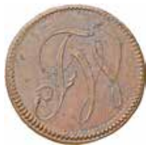
Fagervikspollett med monogram FW.