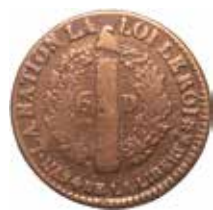
4. 6 deniers, 1792.