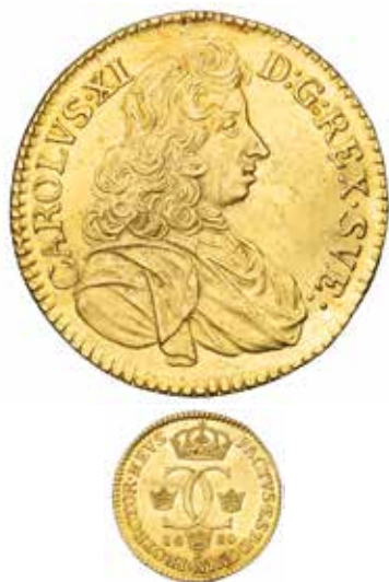
2. Dukat 1680, SM 37, Bonnier 13. Ex Myntauktioner i Sverige auktion 36, nr 233.