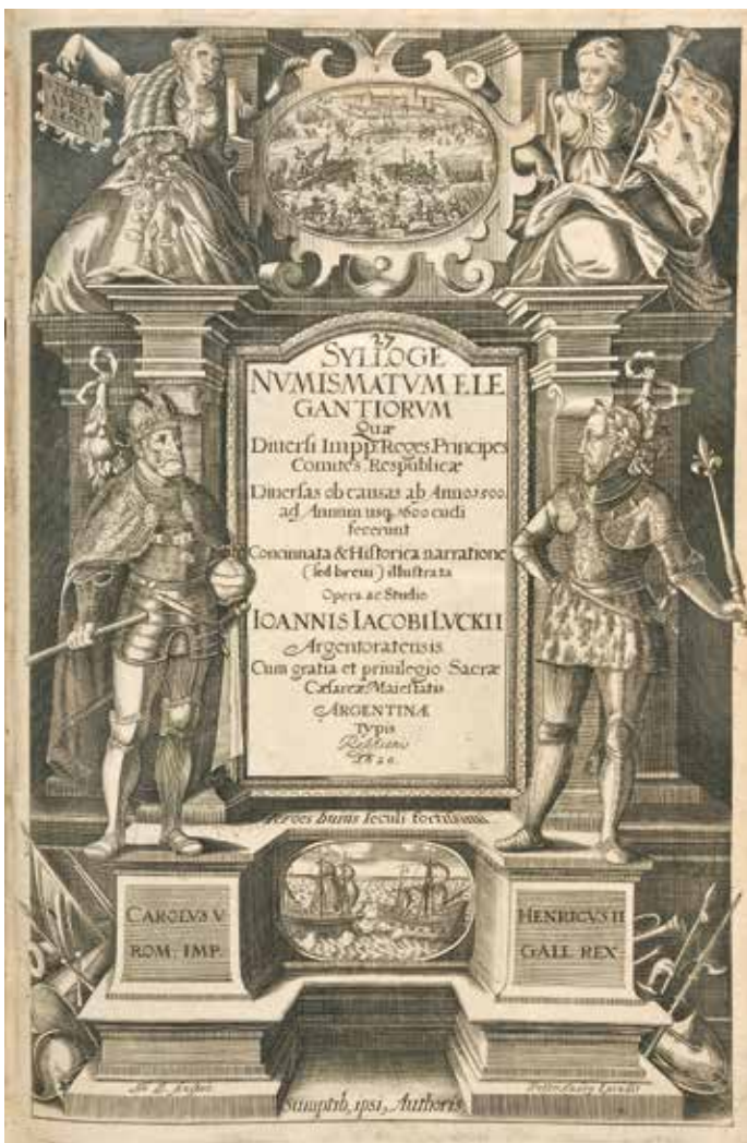
1. Luckius 1620, titelsida.

Detta fascinerande verk är det tidigaste som använder bilder av medaljer och mynt för att illustrera viktiga historiska skeenden.