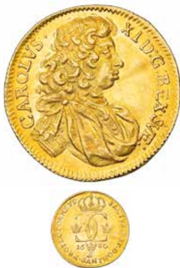
3. Exempel på mera krigisk porträttframställning; dukat 1680, SM 36. Ex Myntauktioner i Sverige auktion 36, nr 232.