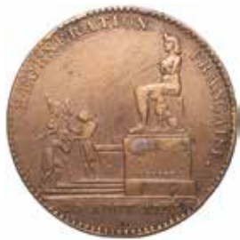
2. 5 décimes, 1793.