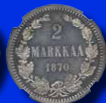
Finland 2 markkaa 1870

Vi har kunder över hela världen och därmed mycket goda möjligheter att sälja just dina objekt. Bättre mynt och hela samlingar mottages löpande, så att just dina objekt kan marknadsföras mer. Kontakta oss för en förutsättningslös diskussion! Välkommen in med dina objekt!