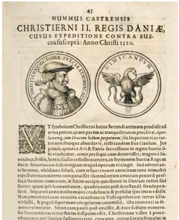
2. Luckius 1620, sid. 45.

Ämnesmärkningsvärt är att åtsida och fränsida inte hänger ihop för vissa objekt. Några kopparstick visar objekt som troligtvis inte existerat. Verket är utsmyckat med otaliga detaljerade gravyrer framställda av