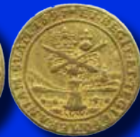
Pommern 2 dukater 1697. R.