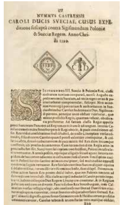
7. Luckius 1620, sid 377.

Johan III:s medalj 1570 i Luckius bok sid. 236, bild 5 . Samma medalj ses i Brenner 1731 på plansch JOH. III.