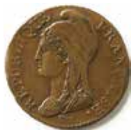
3. 5 centimes, 1796.