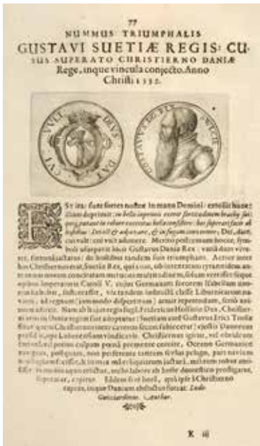
3. Luckius 1620, sid. 77.

De scener och porträtt som avbildas i detta imponerande verk av numismatisk materia utgör startpunkten för att beskriva biografier över kungar och andra bemärkta personer men också politiska händelser och viktiga slag som är värda att ihågkommas. Det är inte ett numismatiskt verk i egentlig mening då ingenting sägs om föremålens upphovsmän, gravörer, metall, vikt eller storlek. Kopparsticken följs av en text som beskriver händelsen som avses.