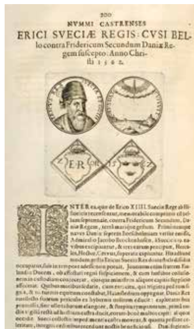
4. Luckius 1620, sid. 200.

2. På sid. 77 presenteras en medalj som av Luckius beskrivs med följande text: NUMMUS TRIUMPHALIS GUSTAVI SUETIÆ REGIS: CUSUS SUPERATO