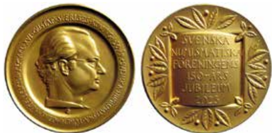
Medaljen som överlämnades till konungen.