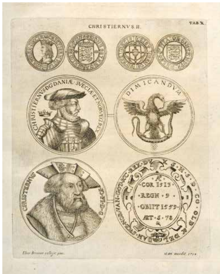
9. Brenner 1731, plansch CHRISTIERNVS. II. Tab. X. Elias Brenner sculpsit. 1714.

Delar av samlingen lär efter skiftande öden ha hamnat i Cabinet des Médailles i Paris. Det finns lite osäkra uppgifter om att Luckius på grund av de höga kostnaderna för det stora antalet kopparstick och trycket tvingades sälja delar av sin samling redan i slutet av 1620-talet för att betala fordringsägarna.