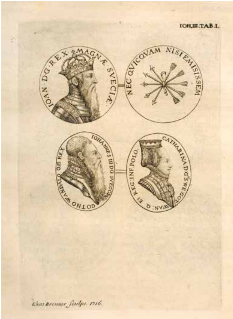
10. Brenner 1731 plansch JOH. III. Tab. I. Elias Brenner sculps. 1716.

Undertecknad har i detalj studerat och kollationerat mer än trettio exemplar av Brenners första utgåva.