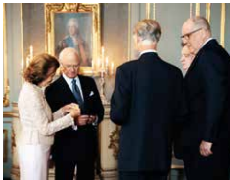
Kungaparet beundrar den erhållna jubileumsmedaljen.