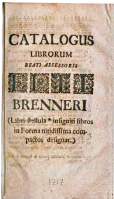
8. Titelsida till katalogen över Elias Brenners boksamling.