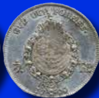
1/2 riksdaler 1799 Exceptionellt exemplar