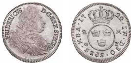
En så kallad frederik , 2 mark 1722 präglad för Fredrik I.