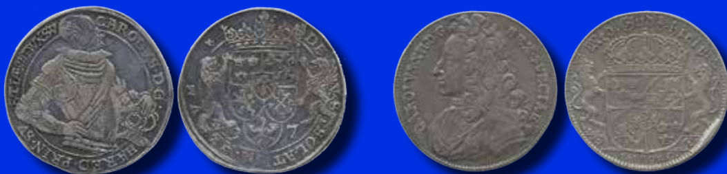
Karl, Hertig av Södermanland 1 daler 1597

Superbt välpräglad exemplar med skimrande regnbågslika fält