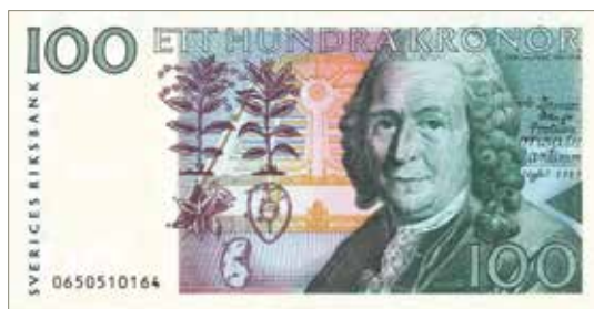
100-kronorssedeln från 1986 med Carl von Linnés porträtt. Mått 140×72 mm.