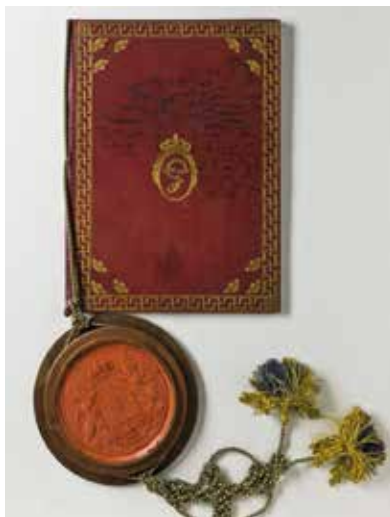
1. Johan och Lars Bergencreutz' sköldebrev utfärdat 24/1 1788 av Gustav III.

Den 24 januari 1788 adlades Lars och hans äldre bror Johan av Gustav III med namnet Bergencreutz. Brödernas sköldebrev har bevarats; det förvärvades år 1894 av Nordiska museet från Henryk Bukowski ( Fig. 1 ). 2 Lars' militära karriär tog ny fart efter Gustav III:s död. Den 6 augusti 1792 utnämndes han till major och överadjutant och följande år blev han stallmästare hos den omyndige