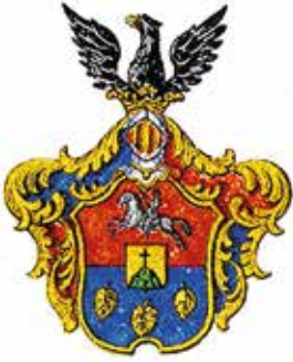
2. Adliga ätten Bergencreutz' vapen (nr 2146).