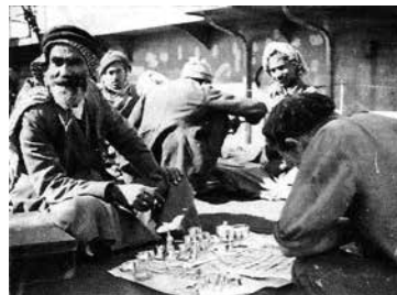
Basra, Irak 1948. En juvelerare har öppnat butik för sina silvvervaror. Han är min berättelse, som fick silver till sina smycken från Seleukidiska mynt präglade för 2 200 år sedan.

Detta hände för mer än åttio år sedan och blev starten på mitt numismatiska intresse. Efter realexamen gick jag till sjöss. År 1949 kom jag hem till Sverige för att börja