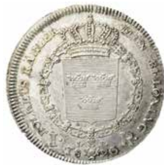
4. Riksdaler 1820 med Karl XIII:s bild. Ex MISAB auktion 17, 2016 nr 593.