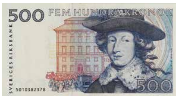
500-kronorssedeln från 1985 med Karl XI:s porträtt. Mått 150×82 mm.