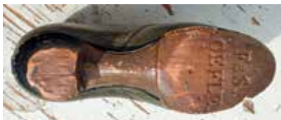
2. På sparskons sula signerade fabriken med F & S. GEFLE. Även på klacken ses GEFLE, möjligen med F & S.