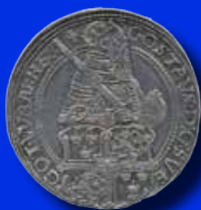
1 daler 1559

Några redan inlämnade objekt till höstens auktion: