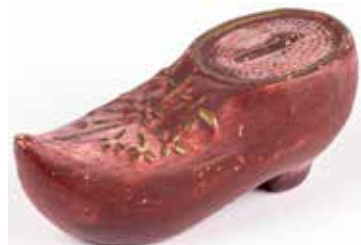
12. Sparsko som spetsig träsko. Märkt: B GEFLE = Bobergs Fajansfabrik AB. Mått cirka: 138×55×58 mm. Länsmuseet Gävleborg, ID XLM.42595.

www.signaturer.se/Sverige/gefle.htm http://precisensan.com/antikforum/showthread.php?34665-Gammal-Gefle-sko-som-sparb%F6ssa