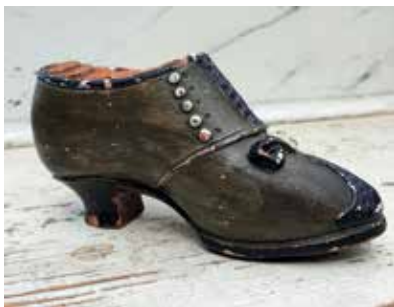
1. Sparsko av lergods tillverkad hos Forssell & Sörlings Kakelfabrik i Gävle. Mått cirka: 130×45×65 mm. Privat ägo.

Många sparsbösetyper med skilda figurteman och skiftande material såldes och användes ju flitigt vid den här tiden. Vanligast var spargrisar men även andra djur och bössor i mänsklig gestalt, sagofigurer och byggnader förekom. I slutet av 1800-talet blev de