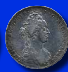
1 riksdaler 1719