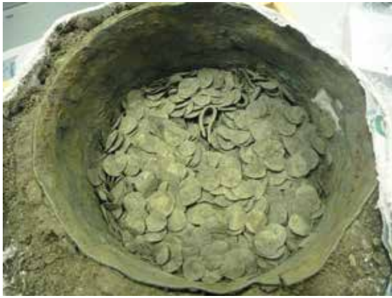
2. Fyndet från Stale i Rone i gipspreparat.