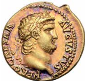
Nero (54–68). Rom. Aureus år 64 eller 65. Åtsida. Guld. Diameter 19 mm.

— 2004. Under plogen. Mallgårds i Levide sn. En studie inom ramen för forskningsprojektet "Fornlämningar i odlingslandskapet" . Visby.