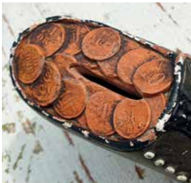
3. Myntavbildningarna visar låga valörer från främst Sverige men också från Norge, Danmark och Ryssland.

allt mer populära och utformningen allt viktigare. Småsparande skulle uppmuntras.