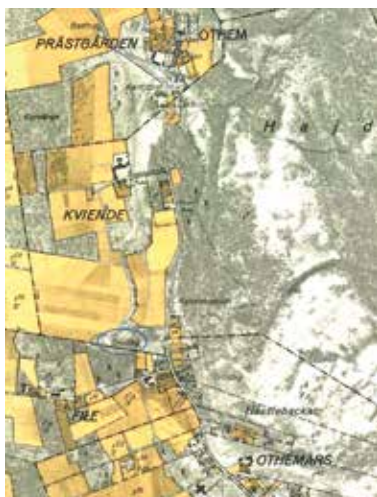
Grustaget där fyndet gjordes finns utmärkt på den ekonomiska kartan från 1941, på bilden markerad med blå oval. Bilden som kommer från Rikets allmänna kartverks arkiv är bildbehandlad och kompletterad av författaren.

Jag hittar en beskrivning av fyndet under fyndnummer 417. Stenberger skriver att fyndplatsen var ett grustag beläget 250 meter väst om landsvägen Othem–Slite, 620 meter syd om Kviende och 250 meter nordnordost om File. Via Lantmäteriets hemsida och Rikets allmänna kartverks arkiv hittar jag den ekonomiska kartan från 1941. Med måttangivelserna från Stenberger går det att lokalisera platsen på kartan och konstatera att grustaget är markerat.