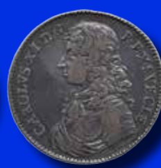
1 riksdaler 1676