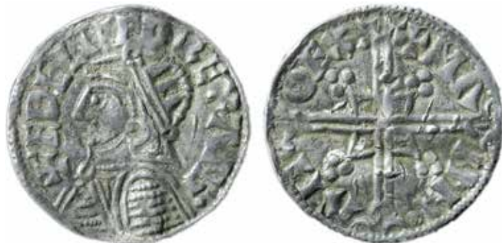
Kung Æthelreds mynt från Exeter.