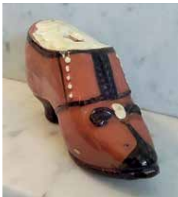
4. Sparsko där myntavbildningarna är övertäckta med vit glasyr. Den finns både utan och med fabriksstämpeln F & s. GEFLE. Mått cirka: 130×40×65 mm. Privat ägo.

1878 ses och tycks vara ett norskt bronsmynt om 1 öre utgivet för vår unionskung Oscar II. Fig. 9 . Ett mynt ser ut att vara ett danskt 10-öre i silver utgivet från 1874 för Christian IX (1863–1906). Fig. 10 . Vårt östra grannland, då Storfurstendömet Finland, representeras av en kopek präglad för storfursten, den ryske tsaren Alexander II (1855–1881). Fig. 11 .