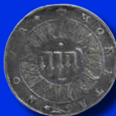
1 daler 1599