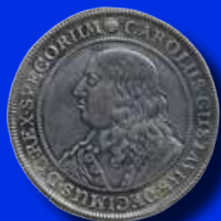
1 riksdaler 1654