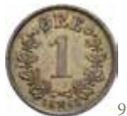
9. Norge. Oscar II (1872–1905). 1 öre 1885, valörsida, brons.