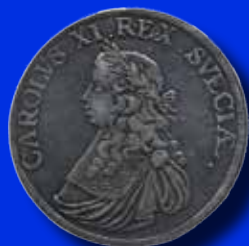
8 mark 1666