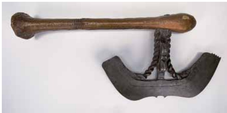
2. Kasuyu. SHM-KMK 30 000:158.

Fas 1. Fram till slutet av 1960-talet innehöll samlingen bara ett fåtal premonetära föremål, som till exempel en kissi penny , ett xmynt och några äldre kinesiska betalningsmedel. De premonetära betalningsmedlen hittades då på andra museer, såsom Etnografiska museet i Stockholm. På KMK däremot visades nästan inget intresse