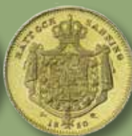
Oskar I (1844-1859). 2 dukater 1850. 330.000 kronor.

Myntauktioner i Sverige AB Banérgatan 17, 115 22 Stockholm • Storgatan 10, 342 60 Moheda E-mail: info@myntauktioner.se • Telefon: 08-410 465 65 www.myntauktioner.se