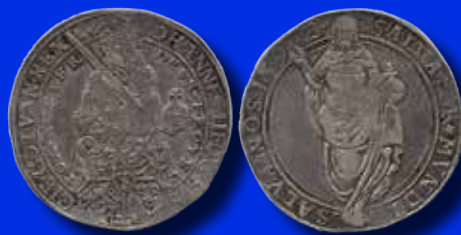
1 daler 1592 30.000:-