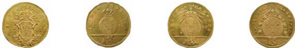
Fransidor till dukater av guld från Ädelfors från 1741, 1743, 1747 och 1750. Diameter 22 mm.