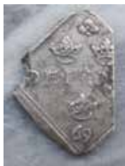
Johan III, Stockholm, 1 mark 1569. Fynd från Hätuna i Uppland.