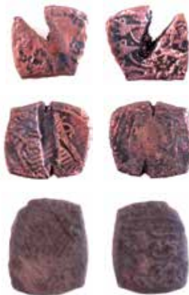
Tre klippinge fra Københavns Museums udgravning i Ny Østergade 2019.

Også fra Christians modstandere var der kritik af klippingene. Poul Helgesen, den katolske gejstlige skribent, skrev i sin "Rimkrønike" om Christian: "Jeg loed oc slaa en skendelig Mynt/Som aldrig vaar før