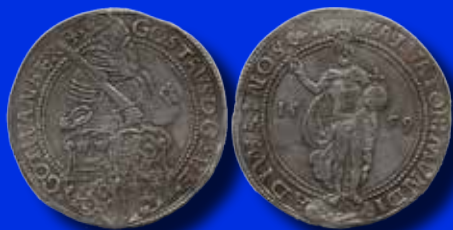
1 daler 1559 50.000:-