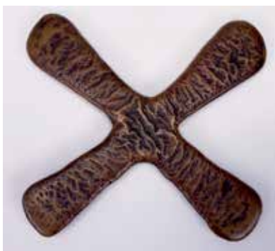
1. Katangakors. SHM-KMK 30 000:160.

Under begreppet 'premonetära betalningsmedel' kan man också läg-