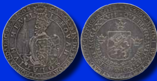
8 mark 1608 50.000:-