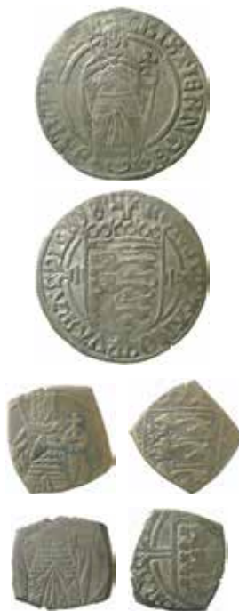
En rund skilling og to klippinge fra Christian II.

XRF-analyser på Stockholms Universitet af de 12 klippinge i Kungliga Myntkabinettets samling viser stor