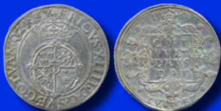
2 mark 1563 25.000:-