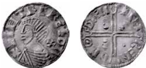
Det privatägda myntet, vikt 1,13 g. Skala 1,5:1.

De två första faserna omfattar mynt som är lika sina engelska förebilder och med läsbara inskrifter. Fas III är en uniform grupp med en karaktäristisk handliknande symbol i en eller två av frånsidans korsvinklar. Från fas IV försämras myntens utförande alltmer till att slutligen i fas VII bli halv-