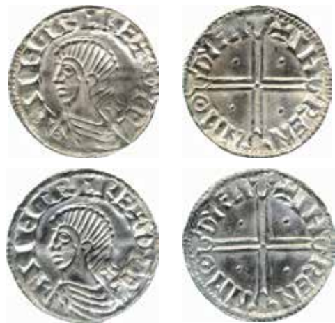
De två mycket välbevarade, stampidentiska mynten från Glenfaba-fyndet 1,19 g respektive 1,29 g. Skala 1,5:1.