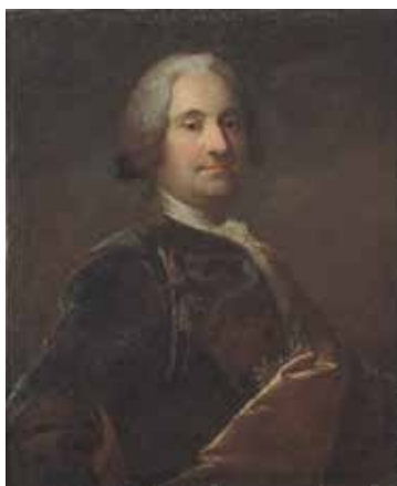
Carl Hårleman (1700–1753). Målning av Olof Arenius (1700–1766).

1741 års en- och halvdukater såldes av myntverket till samlare och andra intresserade för dubbla nominella värdet. 2 Det följande året gjordes ingen leverans av guld till Myntet, men när man år 1743 skulle prägla ädelforsdukater igen, så ansåg riksrådet att man borde göra en åtskillnad mellan ”de första af detta Wårks Guld slagna Ducater, och dem som nu och än vidare deraf komma att slås”, som det uttrycktes i ett protokollsutdrag från råds-kammaren den 28 juli 1743. 3 I riksrådet satt åtminstone två ivriga myntsamlare vid denna tid, nämligen Carl Gustaf Tessin (vars samling såldes till drottning Lovisa Ulrika 1746)