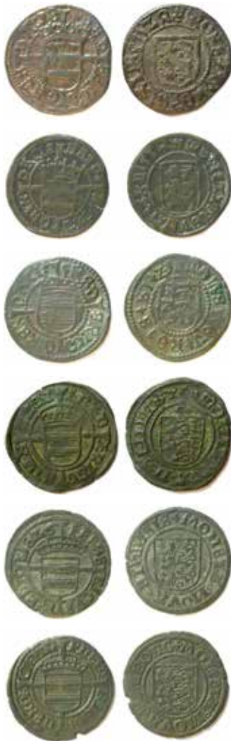
Seks søslinge fra Frederik I's ommøntning af klippingene fra 1524 og de følgende år. Møntsteder Malmö, Landskrone, Ronneby, København, Ribe, Aalborg. Nationalmuseet, København.