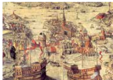
Stockholms blodbad skildrat av okänd konstnär 1524.

Med hensyn til klippingerne præget efter 1518 har vi lidt flere holdpunkter i de skriftlige kilder. I