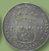
Karl XII (1697-1718). 8 mark 1698. 82.000 kronor.