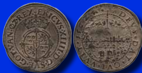
3 mark 1562 30.000:-