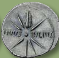
Augustus (27 B.C - A.D. 14). AR Denarius. 86.000 kronor.