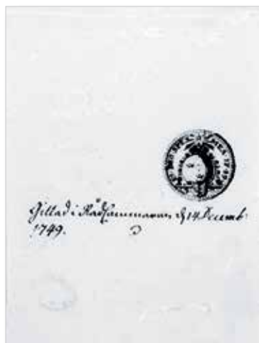
Daniel Fehrmans förslagsteckning till dukaterna av guld från Ädelfors.