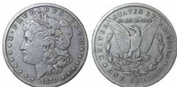
En missad dollar ...

År 1859 – när Carson City bara var en liten nyvaken stad som levde på några små guld- och silverfyndigheter – började man vaska fram silver och guld från en ny fyndighet. Uppe på den östra sluttningen av Mount