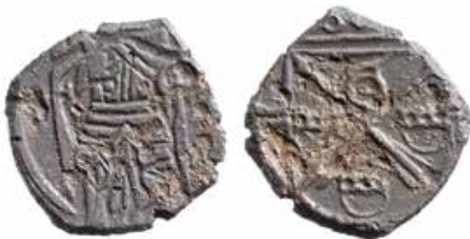
3. Åtsida: En stiliserad, framåtvänd kungabild iförd rustning och mantel, hållande svärd och riksäpple, påminner närmast om kung Christians klippingar. Frånsida: Samma vapen som föregående.

tens på en redovisning ”för all den del han uppburit och utgivit haver av vårt mynt i Henemora”.