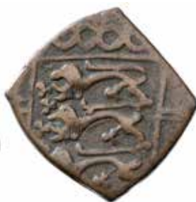
1. Åtsida: En krönt Christian II i rustning och mantel, hållande i ena handen ett riksäpple, i den andra ett svärd. Frånsida: Det danska riksvapnets tre leoparder i en sköld, lagd på ett kors.

Gustav Eriksson (av riksrådsätten Vasa) hade den 1 december 1520 anlant till Dalarna för att resa upprorsfanan mot kung Christians ”gruvliga och tyranniska regemente”. Efter åtskilliga äventyr (dock åkte han inte på skidor, vilket ofta påstås) lyckades