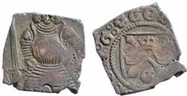
2. Åtsida: Riksföreståndaren håller i den högra handen ett svärd, huvudet är bart med rak lugg, ansiktet är slättrakat, förutom stora mustascher. Frånsida: De korslagda dalpilarna 12 . Omskriften lyder; GUSTAVI ERISON G, varvid sist nämnda bokstav får tolkas som "Gubernator".

biskop Peder Swarts 3 krönika om kung Gustav I, nedskrivna cirka fyrtio år efter händelserna, men med kungens eget goda minne och relationer: