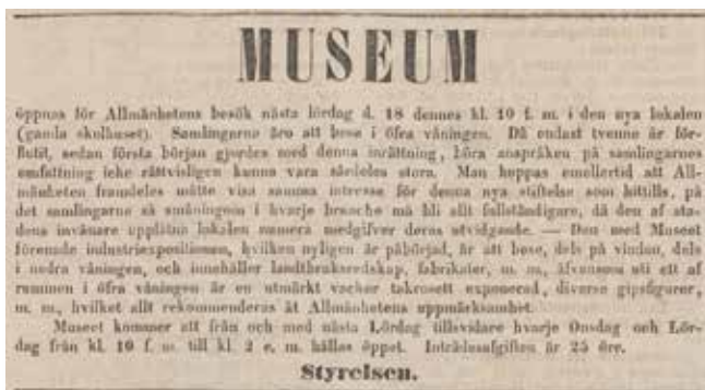
1. Reklam i Bohusläns Tidning 1863-07-16 (nr 54), sid. 1, inför Uddevalla museums invigning.