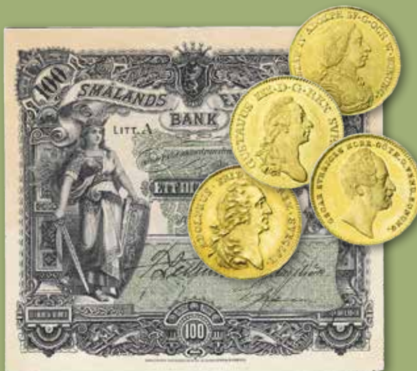
Objekt från auktion 34

Vid denna annons pressläggning råder ännu restriktioner kring allmänna sammankomster, som vår auktion räknas till, vilket i praktiken innebär att antalet besökare till auktionen måste begränsas. För aktuell status angående auktionen, se information på vår hemsida samt ta del av våra nyhetsbrev. Om Du har tänkt att besöka auktionen, ber vi Dig att kontakta oss i förväg för att se om det finns platser kvar. För att minska trycket på den fysiska auktionen kommer vi att erbjuda live-budgivning i realtid via Internet; information även om detta finns på vår hemsida.