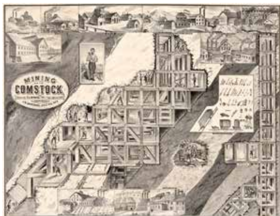
Gruvbrytning i Comstock Lode 1876.