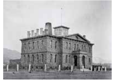
Myntverket i Carson City.

I båda städerna fanns det gott om "saloons" där de som lyckats väl spenderade sin dagskassa på bourbon, öl, kortspel och vackra flickor.