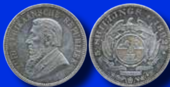
Sydafrika 5 shilling 1892 60.000:-