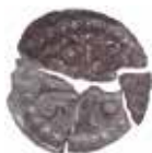
4. AROS-penning funnen i Marby gamla kyrka, Jämtland.