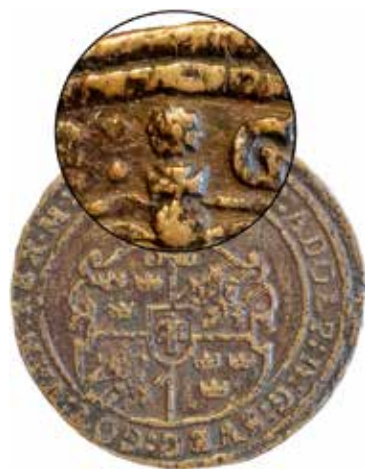
2. Kl. 12 i åtsidans omskrift har en rosliknande symbol punsats in.