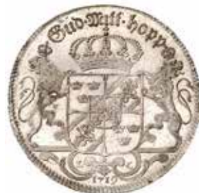
Ulrika Eleonora. 1 riksdaler 1719.