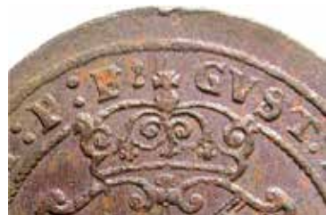
3. Typiskt utseende för en åtsida kl. 12. En punkt finns ibland ovanför korsgloben.