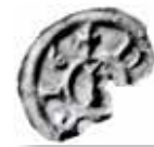
9. NVCOPIE-penning funnen i Kullkyrkan, Mosås, Mosjö socken, Närke.

underlaget vid präglingstillfället tillhört men kvarglömms av ambulerande myntslagare, kanske i kungens följe. Och om mynthusen och förmodligen tillika växlingskontoret tillkommit senare.