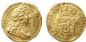
Hessen, Kassel. Fredrik I:s dukat 1731. Ø 20 mm.