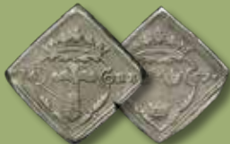
16 öre 1557. RRR.