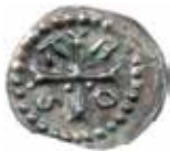
2. AROS-penning som motsvarar blyavtrycken, bild 1. LL IB:4. Kungl. Myntkabinettet.