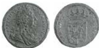
Provprägling i bly av Fredrik I:s dukat 1731. Ø 20 mm.

Vad gäller anknytning till den svenska myntningen är sådana kända, även avslag i icke-reguljära metaller. Av någon anledning har dock ingen modern inventering gjorts av hur bevarade stampsortimentet ser ut och i vilket skick det befinner sig, ej heller tydligt var de förvaras i dag.