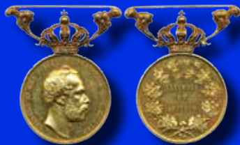
Litteris et Artibus 14.400:-