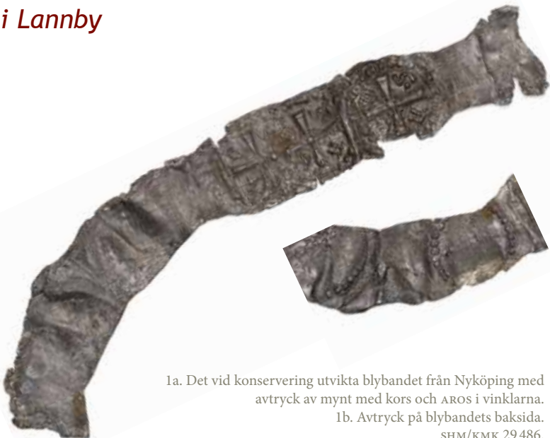
1a. Det vid konservering utvikta blybandet från Nyköping med avtryck av mynt med kors och AROS i vinklarna.

Det är på det mindre bandet som myntavtrycken finns. De visar ett stort kors inom den sedvanliga pärlringen, introducerad av Knut Eriksson på hans svealandspenningar kring 1180 och som fortsattes in i 1200-talet på våra brakteater. På bandets baksida ses tydliga avtryck efter pärlringen men svagare efter korset och bokstäverna. Bild 1a–b. I korsets vinklar formar bokstäverna det forn-