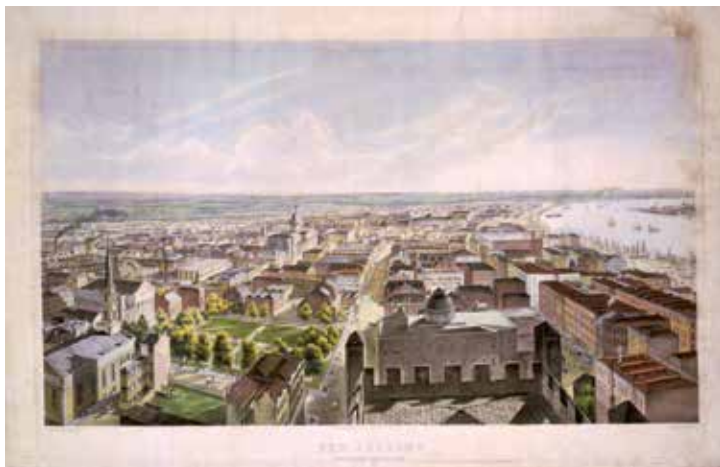
New Orleans 1852. Litografi av B. F. Smith (1830–1927).