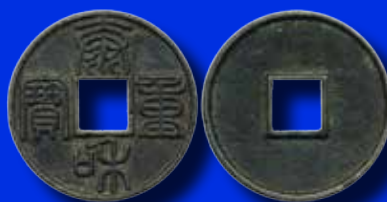
Kina 10 cash 21.600:-