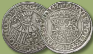
Daler 1535. RR.