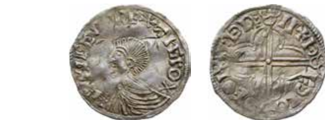
Obv.: +IEDIELDE REX ANGLOX, bust left ('Æthelred II', Long Cross type). Rev.: N+D ECLIO OEIOI FDD+, voided long cross in quatrefoil ('Cnut', Quatrefoil type). 1.78 g (double struck) 180° 7/5 peck marks. Ø 20.8 mm. Malmer 1997, 9.110.1966 (this specimen not listed). Ashmolean Museum, Oxford (HCR35981); Stevens Cox coll.; ex Ryan coll., Glendining 22.1.1952, lot 821; found in Somerset.