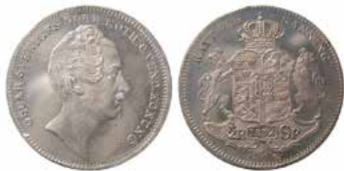
Oscar I. ½ riksdaler specie 1852. Ø 32 mm. Samling Kungl. Myntkabinettet.