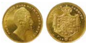
Oscar I. 2 dukater 1852. Ø 20 mm. Samling Kungl. Myntkabinettet.