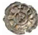
8. NVCOPIE-penning funnen i Skänninge allhelgonakloster, Östergötland.

Så länge inga spår efter ett fast medeltida mynthus påträffats i Nyköping kan vi fundera över om AROS-