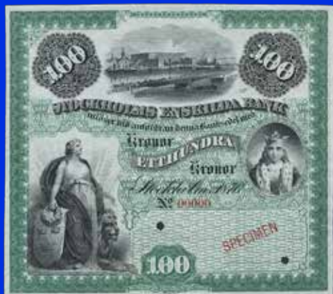
100 kronor 1876 15.600:-