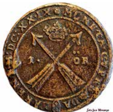
1. Gustav II Adolf. Säter 1629. Ref.: Sonesgården #94k. Ø 40,5 mm. Vikt 30,1 g.

⊕ GVST : ADOLP : D : G : SVEC : GOT : VAN : REX • M : P : F : ⊗ MONETA • CVPREA • DA ( ) LARENS : M : D C : XX • IX