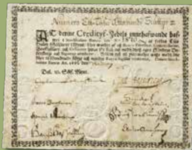
10 daler SM 1666. R.