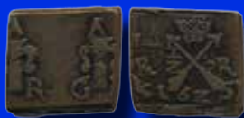
½ öre 1625 16.200:-

Ett urval objekt (inkl. köparprovision) som vi har sålt tidigare: