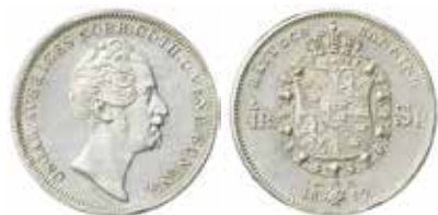
Oscar I. ¼ riksdaler specie 1852. Ø 25 mm. Samling Ertzeid 2. MISAB 2018:26.