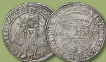
Daler 1534. RR.