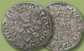
1/2 daler 1534. RRRR.