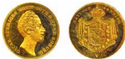
Oscar I. 4 dukater 1852. Ø 25 mm. Samling Universitetets myntkabinett, Oslo.