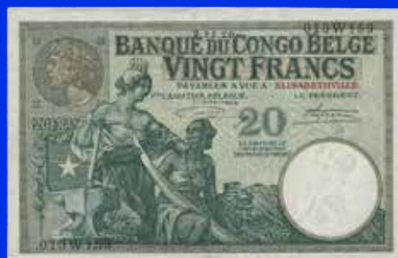
Belgiska Kongo 20 franc 1920 11.300:-

Bättre mynt och hela samlingar mottages till kommande myntauktioner.