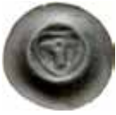
27. Stettin, staden, 1300-talet. Penning. 0,29 g, 15 mm. Dannenberg 140.