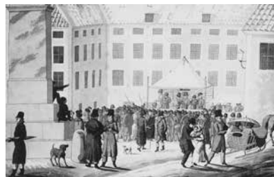
Dragning i Kungl. Nummerlotteriet framför Indebetouska huset på Slottsbacken år 1819.

Men allt fler och starkare röster höjdes mot staten som spelhusvärd. Lotteriet var sedfördärvande och olycksbringande ansåg man. Familjer ruinerades. Förmögenheter spelades bort. Den kungliga inrättningen var helt enkelt skadlig enligt en 1839 tryckt flygskrift, Lotteri-Spelarne eller Nummer-Lotteriets hemligheter uppdagade . Lotteriet upphörde året därpå.