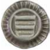
9. Holstein, hertig Christian I av Oldenburg, 1460–89. Blaffert. 0,48 g, 21 mm. Jesse 299.