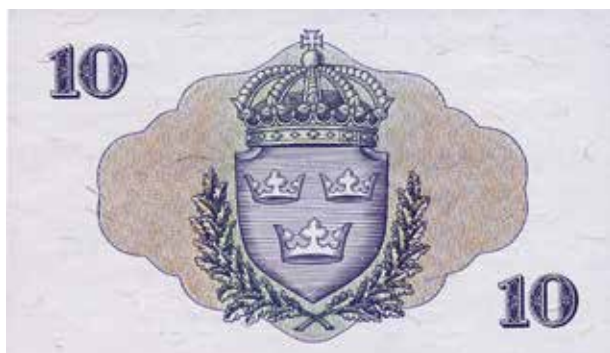
25. Beredskapsedel på 10 kronor med Axel Oxenstiernas bild som förbereddes om nya sedlar skulle behövas sättas i omlopp i krig. 120×70 mm.

visar ett porträtt av Carl von Linné, medan baksidan avbildade stora riksvapnet med sköldhållare.