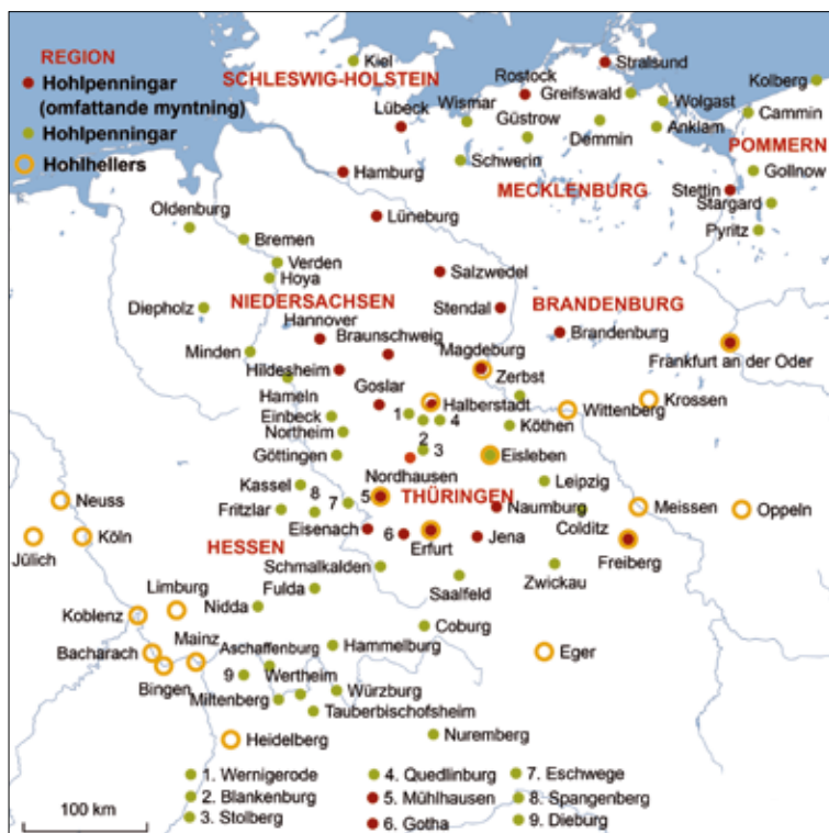
Karta 1. Hohlpenningar och hohlhellers i det senmedeltida Tyskland 1300–1550.

(se föregående avsnitt). Produktionskostnaden för skiljemynt kunde alltså sänkas genom att prägla brakteater. Under tidigare århundraden hade brakteaternas varit fragila, men då skulle de inte cirkulera länge i vilket fall som helst på grund av de frekventa myntindragningarna. När brakteater skulle användas som långlivade skiljemynt var man därför tvungen att stabilisera upp konstruktionen så att de blev mer kompakta och hållbara; diametern sänktes till cirka 12–18 mm och reliefen blev betydligt högre än tidigare. Dessa mynt fick benämningen hohlpenningar .