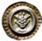
4. Brakteat som liknar hohlpenning, Lübeck, 1250–1300. 0,54 g, 17 mm. Jesse 180.