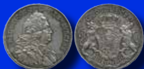
1 riksdaler 1747