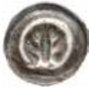
7. Diepholz, greve Rudolph IV, 1302–50. Penning. 0,38 g, 16 mm. Kestner 118, Giesen 1.1.