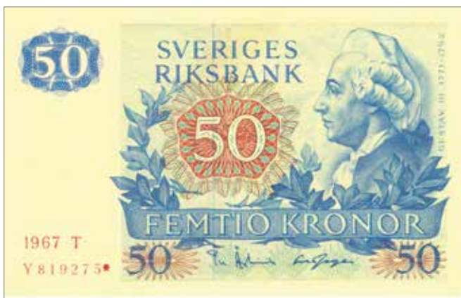
23. Stjärnmärkt 50-kronorssedel. 130×82 mm.

med exakt samma nummer. Detta var både omständligt och kostsamt.