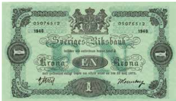
24. Ett reservlager av 1-kronesedlar trycktes 1938–1940 men kom inte till användning. Eftersom lagret av sedelpapper till denna valör tog slut så fick sedeln med årtalet 1940 en grön färg. 121×70 mm.

Bilden av Sten Sture den yngre på krigsfemman väckte mindre entusiasm i sedelkommittén. Tians baksida visar lilla riksvapnet, medan krigsfemmans baksida visar en del av slottet Tre kronor. I mars 1942 presenterades även ett förslag till en ny krigssedel, nu i valören 100 kronor. Tryckplåtar färdigställdes även till denna valör och sedelns framsida