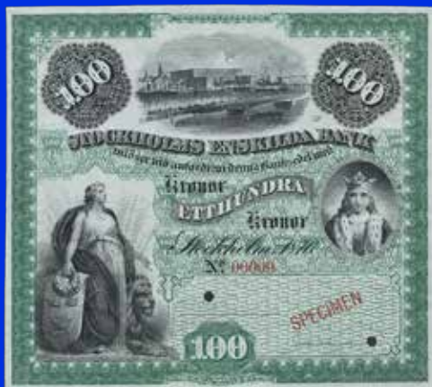
100 kronor 1876

Bättre mynt och hela samlingar mottages till kommande myntauktioner.