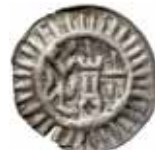
16. Lüneburg, staden, 1400-talet. Blaffert. 0,46 g, 20 mm. Jesse 287.