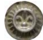
24. Demmin, staden, 1300-talet. Penning. 0,56 g, 17 mm. Dannenberg 108.