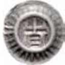
8. Holstein, hertig Christian I av Oldenburg, 1460–89. Penning. 0,34 g, 16 mm. Jesse 266.