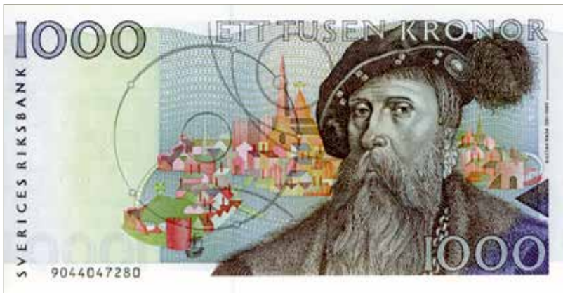
19. Framsidan till 1000-kronorssedeln med Gustav Vasa och Vädersolstavlan i bakgrunden. 160×82 mm.

→ Ytterligare en kung, Gustav Vasa, blev huvudmotiv när 1000-kronorssedeln gavs ut 1989. Porträttet av Gustav Vasa är hämtat från en oljemålning från 1620-talet tillskriven Cornelius Arentz. Förutom kungaporträttet finns en avbildning av den så kallade Vädersolstavlan som finns i Storkyrkan i Stockholm. Det är en oljemålning som visar ett atmosfäriskt fenomen i huvudstaden den 20 april 1535. Detta symboliseras av ringarna och målningen är den äldsta autentiska avbildningen av Stockholm och den har tillskrivits Urban Målare som gjorde den på uppdrag av Olaus Petri. Även myntgravören Gorius målare har varit på förslag. Bild 19.