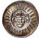
13. Lübeck, staden, 1350–1400. Penning. 0,48 g, 16 mm. Jesse 184.