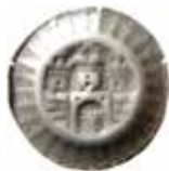
12. Hamburg, staden, 1450–1500. Blaffert. 0,50 g, 20 mm. Jesse 281.