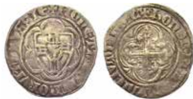
3. Halbschoter, Tyska Orden, 1364–82. 2,92 g, 26 mm. Vossberg 110.