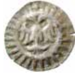
14. Lübeck, staden, 1400-talet. Blaffert. 0,40 g, 19 mm. Jesse 284.