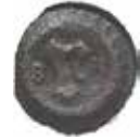
20. Rostock, staden, 1583. Scherf av koppar. 0,34 g, 15 mm. Oertzen 209.