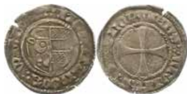
2. Schilling, Wismar, efter 1433. 2,35 g, 25 mm. Jesse 516.