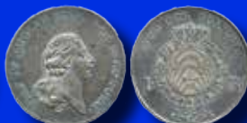
1 riksdaler 1796