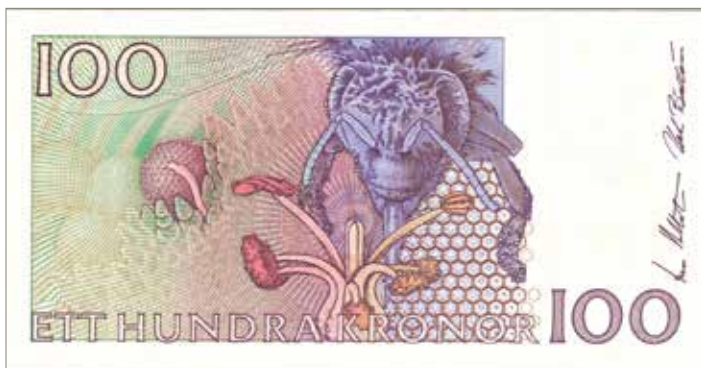
18. 100-kronorssedeln med Carl von Linné. 140×72 mm.

för att kungen ska vända ansiktet in mot sedelns centrum. Det första riksbankshuset, som ännu finns kvar vid Järntorget i Stockholm, skymtar bakom kungabilden. Till en början fanns kungens namn och levnadsår lodrätt i högerkanten, men det har flyttats till under vagnen framför riksbankshuset, Carl XI 1655–1697. Bild 17.