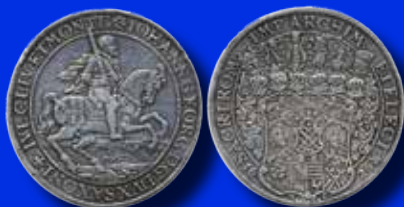
Sachsen 3 taler 1626