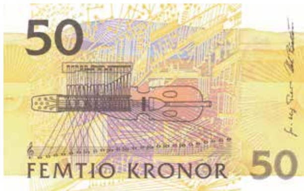
22. 50-kronorssedeln med Jenny Lind. 120×77 mm.