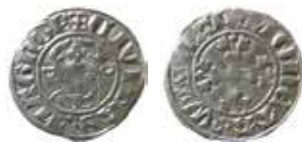
1. Witten, Wismar, före 1379. 1,44 g, 17 mm. Jesse 304.

Den större myntvolymen gjorde det svårare att präglade om mynt ofta och att övervaka vilka mynt som var giltiga vid transaktioner. Även specialisering mellan städer och länder gjorde att interregionala handeln ökade som ofta nyttjade överregionala mynttyper. Därmed övergav man systemet med tidsbegränsade mynt och brakteater som huvudmynt omkring år 1300 på de flesta håll i Europa, även om undantag fanns där systemet kvarlevde en bit in på 1400-talet (till exempel Braunschweig och Magdeburg). I stället infördes långlivade mynt.