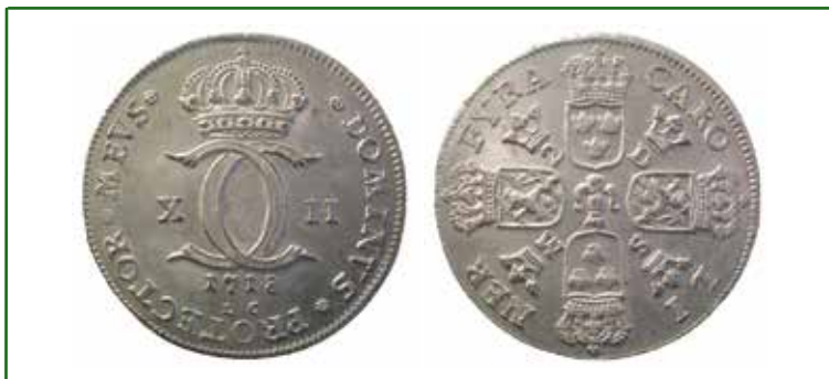
Karl XII. Stockholm. 4 caroliner 1718. Gravör: J. C. Hedlinger.