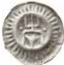
10. Hamburg, staden, 1400-talet. Penning. 0,22 g, 16 mm. Jesse 176.