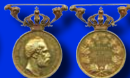
Litteris et Artibus