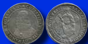
1 riksdaler 1643