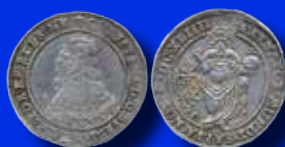
1 riksdaler 1644 med fyra ettor!