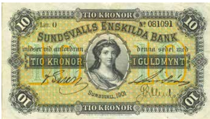
26. 10 kronor 1901 från Sundsvalls Enskilda Bank, den enda enskilda bank som gav ut sedlar med datering på 1900-talet.

I stort sett halva seklet kunde allmänheten lösa in riktigt gamla sedlar hos Riksbanken. Under 1940 fastställdes i en författning att alla sedlar före 1890 års typ, förutom sedlar på 1 krona 1874 och 1875, skulle vara ogiltiga efter den 31 december 1949. Indragningen omfattade förutom de tidigare kronsedlarna även sedlar i "riksdaler