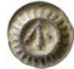
21. Stralsund, hertig Wislaw II von Rügen, 1260–1302. Penning. 0,49 g, 17 mm. Dannenberg 143.