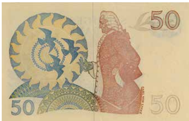
13. 50-kronorssedeln utgavs åren 1965–1981 och tillägnades 1700-talet. Formgiven av Eric Palmquist. 130×81 mm.

här i Sverige inte byts vid tronskifte. Trots detta blev det Gustav VI Adolf som blev huvudmotivet på den första sedeln i serien.