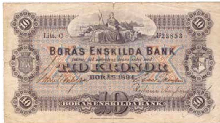
Framsidan till 10-kronorssedeln 1894 från Borås Enskilda Bank.