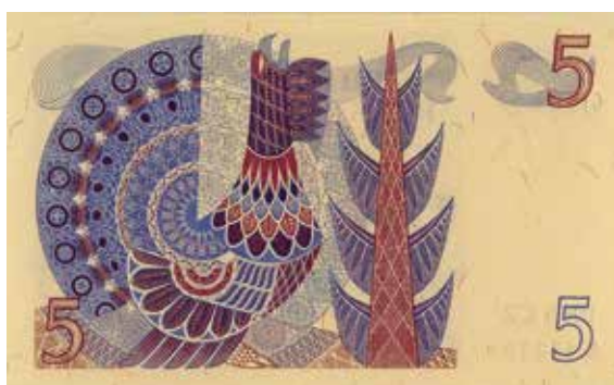
12. 5-kronorssedeln utgavs åren 1965–1981 och tillägnades 1500-talet. Formgiven av Eric Palmquist. 110×68 mm.