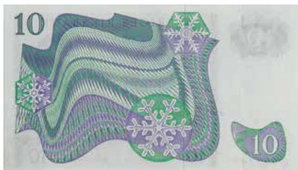
11. 10-kronorssedeln som utgavs åren 1963–1983 tillägnades 1900-talet. Formgiven av Eric Palmquist. 120×68 mm.