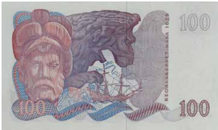
14. 100-kronorssedeln utgavs åren 1965–1983 och tillägnades 1600-talet. Formgiven av Eric Palmquist. 140×81 mm.

tolkning av naturforskaren Carl von Linné stående i en blomsteräng och en stiliserad sol med fåglar i flykt. I en författning år 1979 angavs att värdet 50 kronor inte skulle vara obligatorisk längre, men kunde utlämnas vid behov. Bild 13. 50-kronorssedeln slutade att lämnas ut i samband med utgivningen av den nya 20-kronorssedeln som kom 1992.