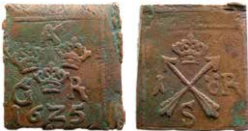
5. Säter, valsverkspräglad 1-öre 1625 med S i nedre pilvinkeln (SM 124, Ottosson typ 14). Valsarna graverades i Nyköping och myntningen skedde i Säter i december 1625. Exemplar i KMK; ytterligare två ex är kända i dag av de totalt 4920 präglade.