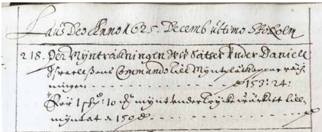
4. Verifikation nr 218 i Kopparkompaniets journalbok för år 1625; Bergsbruk vol. 328 s. 89, Kammararkivet. Myntplåtkoppar till ett värde av 153 daler 24 öre hade myntats "under tryckverket" – i valsverksprägling – före den 31 december. Detta motsvarar 4920 stycken 1-ören.