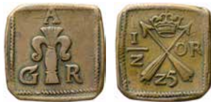
2. Säter, ½ öre 1625, SM 171. Ex MISAB auktion 20 nr 620, tidigare bland annat i Svenssons och Ekströms samlingar.