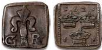
3. Säter, fyrk 1625, SM 172. Ex i Antellska samlingarna.

De mynt som Kompaniets direktion översänt till kungen var sannolikt prover på valsverkspräglade (”tryckta”) dylika, som man börjat tillverka i Nyköping under hösten 1625. De var dock fortfarande ojämna i vikten. Kungen nämnde därför också provmyntningen som företagits i Säter. Han ville att Kompaniet skulle förhandla med de myntsvenner, ”som i Säter gjorde pisten, att de slå tvåörestycken”, fastän omkostnaden skulle öka något. ”Men ettörestycken