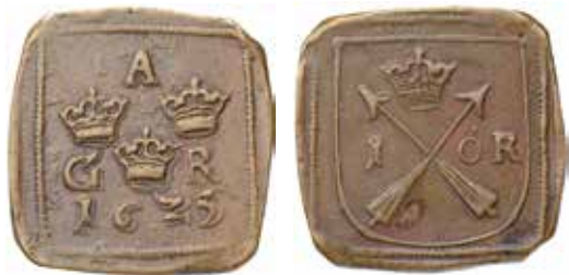
1. Säter, 1 öre 1625, SM 169. Ex MISAB auktion 29 nr 188.