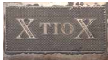
Bakgrundstryck på framsidan till 10-kronorssedel 1894 från Borås Enskilda Bank.