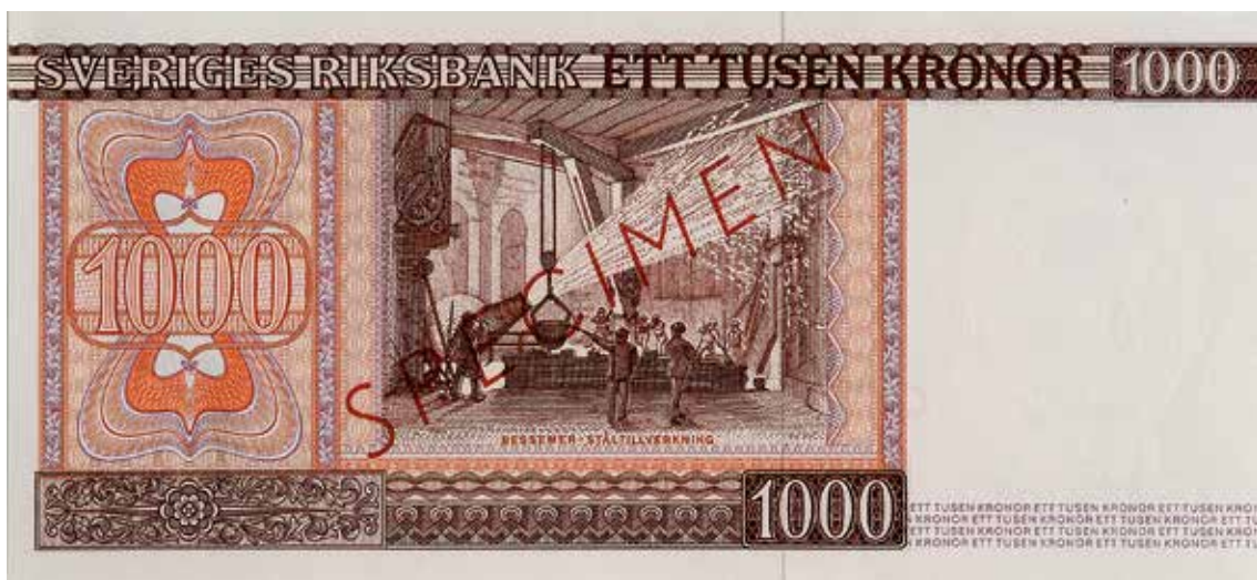
16. 1000-kronorssedelns baksida visar ett Bessemerstålverk som symbol för industrialismens tid. Formgiven av Arne Askvall. 226×103 mm.