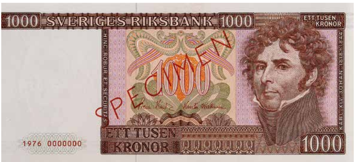
15. 1000-kronorssedeln utgavs åren 1976–1983 och tillägnades 1800-talet. Formgiven av Arne Askvall. 226×103 mm.

Det kom att dröja drygt tio år innan en ny 1000-kronorssedel gavs ut och denna tillägnades 1800-talet. I december 1976 utgavs sedeln som hade ett svagt rosatonat papper och där framsidans motiv visar konung Karl XIV Johan. Baksidan har en bild av ett Bessemerstälverk och stältillverkningen representerar industrialismen. Konstnären som gjort sedeln är Arne Askvall och vattenmärket är