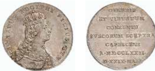
Gustav III:s kröningsmynt, 2 mark 1772, präglat i Stockholm. Gravör: Carl Gustaf Fehrman. KMK samling.