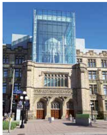
Naturhistoriska museets entré. Genom den moderna tillbyggnaden skimtar man stora medusan, som på natten lyser suggestivt.