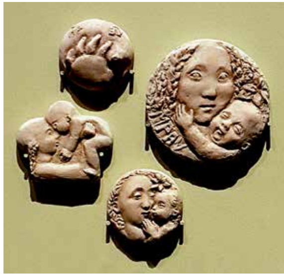
Fyra medaljer i terrakotta. Konstnär: Lena Lervik.