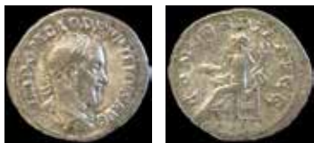
1. Pupienus, Rome, AR denarius, c. AD 238 (Swenson 2400–1292). Ø 20 mm.

beard, the minute rendering of the emperor's pupil. With a sigh of admiration, the forger sets down his loupe and walks to the window, observing the moonlight over the river Main, scattered like pearls across black velvet. A cat purrs and rubs against his leg. The forger returns to his workbench, takes up his burin, and begins cutting his die.