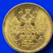
Ryssland 5 rubel 1879