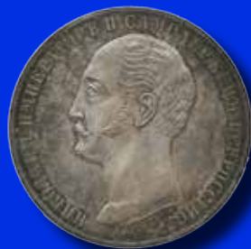
Ryssland 1 rubel 1859