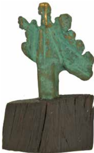
The Woman's Pride. Konstnär: Joze Strazar Kiyohara.