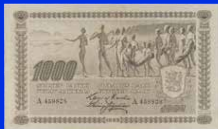
Finland 1000 markkaa 1922

Bättre mynt och hela samlingar mottages till kommande myntauktioner.