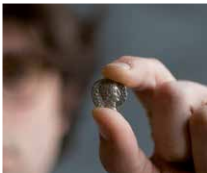
The author with a denarius of Augustus in the Swenson Collection (Swenson 2400–375; RIC Augustus 87A).

Gotland, the Baltic Sea, AD 450. The dreamer’s coin shines through the passing clouds, a crisp silver disk. A wet snick as the spade cuts through rocky mud, a squelch as the spade-load slumps onto the spoil heap. The digger pauses to wipe his brow, takes a draught of ale from the flagon