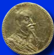
Gustav II Adolf Medalj i guld