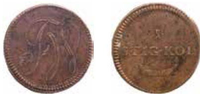
2. Fagerviks bruks pollett gällande 1 stig kol.