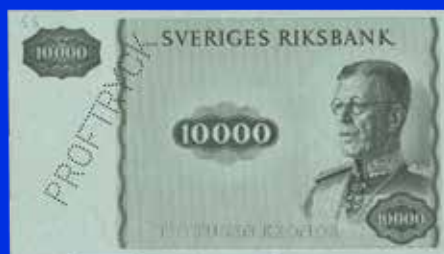
10.000 kronor Provtryck