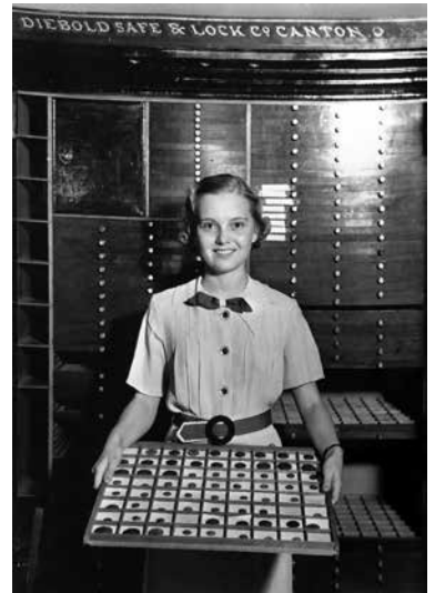
6. A young woman holds a tray of coins from the Swenson collection.