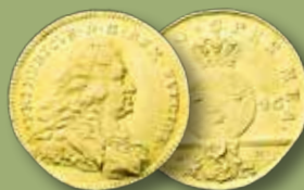
STOCKHOLM. Dukat 1746. RRRR. Av guld från Ädelfors gruva. Såld för 310.000:-