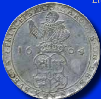
4 mark 1604