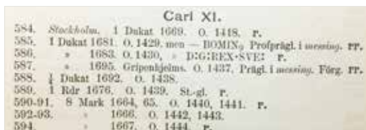
Utdrag ur auktionskatalogen med auktionspost 585. 1 Dukat 1681. O. 1429, men – BOMIN 9 Profprägl. i messing . rr.

Ytterligare en källa till information är Lars O. Lagerqvist trevliga bok Vad kostade det? 6 För år 1900 kan man läsa att en industriarbetare inom metallbranschen med 61,3 timmars arbetsvecka betalades 36 öre per timma, alltså 22 kronor per vecka. Då var det dessutom en arbetsvecka som var mer än 50% längre än i dag! För ett kilo torkat fläsk fick metallarbetaren betala 1 krona och ville han dessutom ha en sup till fläsket så var han tvungen att punga ut med ytterligare 1 krona och 35 öre för en flaska