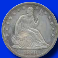
USA ½ dollar 1880