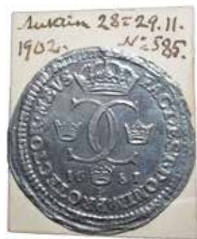
Folieavtryck av en provdukat 1681, här avbildat i skala 1,5:1.

För en del handlar det om att fylla en lucka i en systematiskt upplagd samling, kanske en årtalssamling, för andra att hitta det perfekta exemplaret eller identifiera ett tidigare okänt medeltidsmynt. Men det finns även de som spontanköper numismatiska objekt av ren nyfikenhet för att försöka hitta mer information om något som är okänt vid köptillfället.