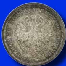
Ryssland Poltina 1880