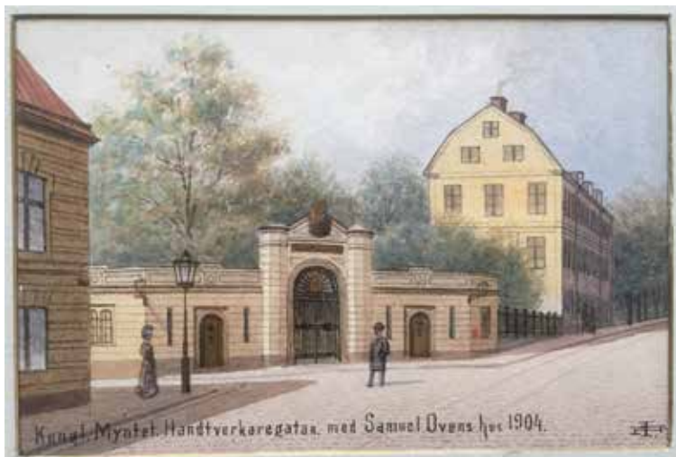
Kungl. Myntets exteriör mot Hantverkargatan. Akvarell av Johan Fredrik Isberg.