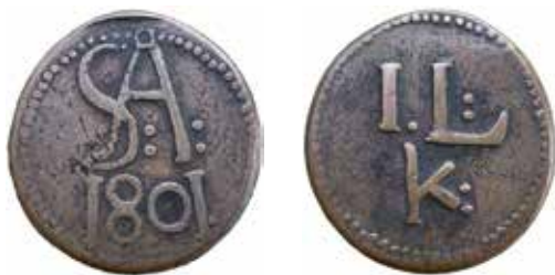
1. Svartå bruks pollett gällande 1 läst kol.

Katalogen över Neschers polletter avslutas med ett avsnitt med obestämda polletter. Bland dessa återfinns en Fagerviks-pollett (fig. 3). Inte heller Stiernstedt (Sti 259:4) kunde attribuera den vackra polletten.