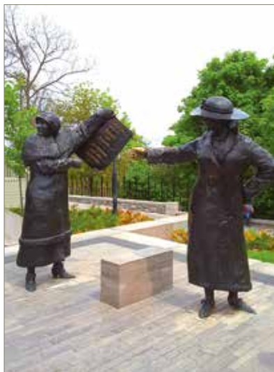
Skulpturgrupp utanför parlamentet med de kvinnor som genomdrev rösträtten i Kanada.

FIDEM hade fått den stora rotundan i Ottawas Naturhistoriska museum till sitt förfogande för utställningen, där över 700 medaljer från 40 länder samsades. Det var just i denna bygg-