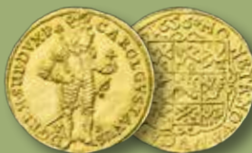
POMMERN. Dukat 1656. RR. Såld för 175.000:-

Vårens första kvalitetsauktion avhålls i mars månad och till denna söker vi nu material av bättre kvalitet. Priserna på framför allt svenska mynt är mycket goda generellt, inte minst äldre guldmynt, varför vi särskilt gärna tar emot inlämningar bestående av sådana.