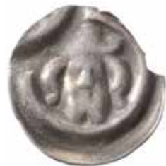
Penning präglad för Albrekt av Mecklenburg i Stockholm. Malmer KrH ÄIII, cirka 1370–80. Diameter 15 mm, vikt 0,28 g. Riksbankens samling, SHM/KMK 23 290.

Kung Albrekt regerade åren 1364– 1389 och myntet visar att ingen större förändring av präglingmetoden vad gäller brakteater skett sedan kung Valdemars tid då han anlät mynt- verkstaden i Örebro.