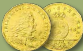
STOCKHOLM. Dukat 1745. RRR. Av guld från Ädelfors gruva. Såld för 186.000:-