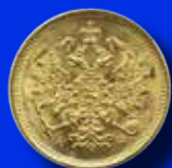
Ryssland 3 rubel 1881