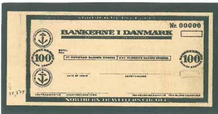
6. Provtryck av resecheck samt modifieringar, av Eskil Verners hand.

hjärta, två spegelvända P. Två ex med nio karbonkopior av brev från 1939 i ärendet med beställaren.