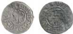
9. Gotland. Visby. Örtug.