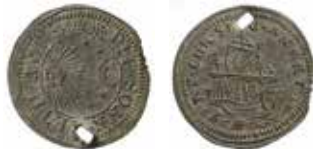
13. Räknepenning. Nürnberg. Sol, mänskära och stjärnor på ena sidan, ett skepp på den andra.