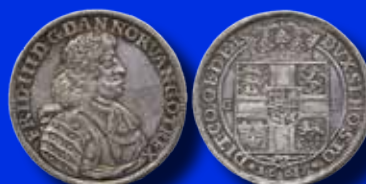
Danmark 1 speciedaler 1667 89.000:-

Bättre mynt och hela samlingar mottages till kommande myntauktioner.