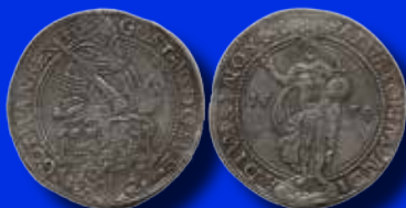
1 daler 1559 96.000:-