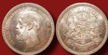
2 kr 1878 "OCH" utrop: 30 000 kr