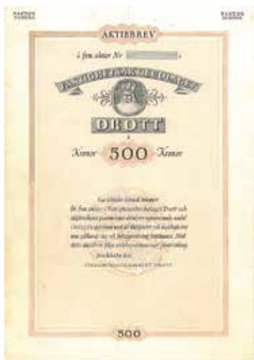
3. Provtryck av Drotts aktiebrev, av Eskil Verners hand.

Det häpnadsväckande intressanta med Eskil Verners konstnärliga insatser är att hans mönster i sin precision visade