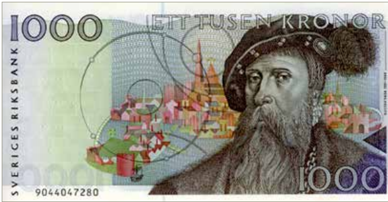
2. Kopplingen mellan Vädersolstavlan och Gustav I Vasa gjordes på tusenkronorssedeln som utkom 1989.