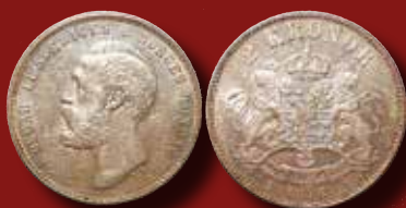
2 kr 1876, Br. årt. st. EB utrop: 15 000 kr