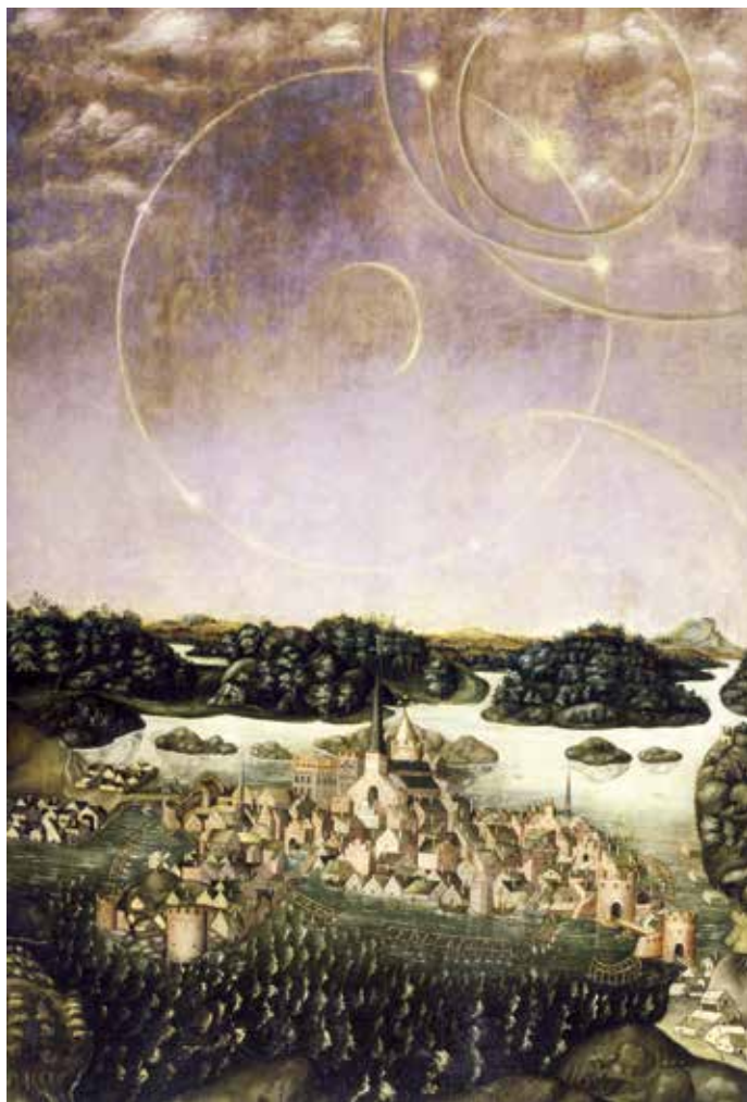
1. Vädersolstavlan 1535. Kan konstnären ha varit myntgravören Gorius målare?

Bakgrunden till tavlans tillkomst har varit känd länge. Åren 1539–1540 hölls en rättegång i Örebro mot reformatorerna Olaus Petri och Laurentius Andrae. I anklagelseskriften mot dem