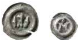
2. Valdemar 1250–1275. Svealand. Penning med krona inom slät ring. LL IX:4.