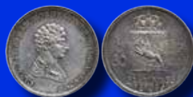
Norge 1/2 speciedaler 1835 23.000:-