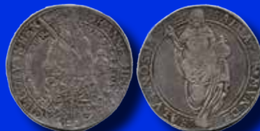
1 daler 1592 75.000:-