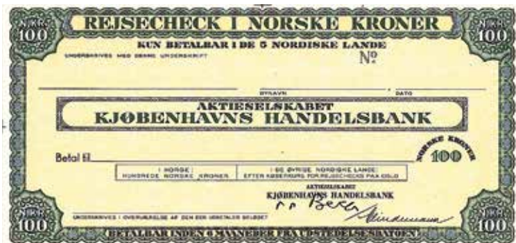
5. Provtryck av tidig resecheck, designad av Eskil Verner.

REJSECHECK I SVENSKA KRONER, Kun betalbar i de 5 nordiske lande. Inom dekorerad ram, med valörbeteckning 100 sv kr i respektive hörn, samt i ramens bas text: BETALBAR INDEN 6 MAANADER FRA UDSTEDELSESDATOEN. I Aktieselskabet Kjøbenhavn's Handelsbank. Olika rutor och linjer för utställande uppgifter. Mått: 166×79 mm. Trycket är uppklistrat på kartonnage samt hålperforerat: EGMONT. H. PETERSEN, krona över