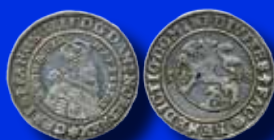
Norge 1/4 speciedaler 1648 29.000:-