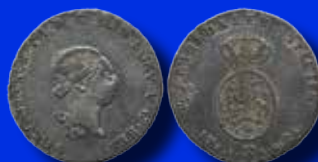
Norge 1/3 speciedaler 1795 121.000:-