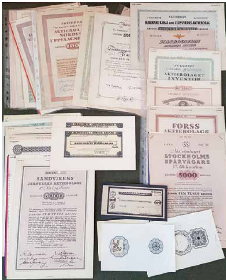
1. En överblicksbild av urval alster som visar Eskil Verners uppdragsgivare.

Eskil Verner lärde sig grunderna i yrket och visade tidigt fallenhet för tecknad figural konst och utsmyckning. Som en autodidakt resurs medverkade han med tecknade illustrationer i produktionen av IDUN, en under senare delen av 1800-talet och in på 20:e århundradet populär tidskrift med nöjesläsning. Tidigt