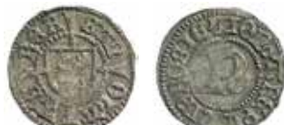
10. Norge. Årkebiskop Gaute Ivarsson (1474–1510). Nidaros. Hvid.