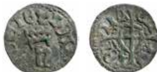
11. Samtida efterprägling av danske kung Hans (1481–1513) hvid.