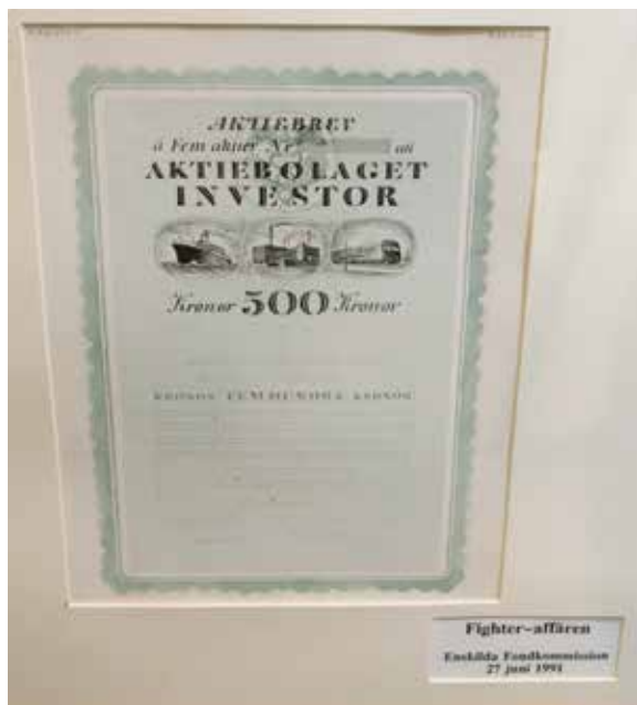
7. Även de allra största börsbolagen anlidade Eskil Verners framstående tjänster.

Dito, provtryck på tegelrött papper med vardera ett motiv 100 kr. Till Bankerne i Danmark respektive 100 kr Till Bankene (Sic: Utan "R") i Norge. Inga annoteringar om datering eller signatur. Dokumentmått: 240×215 mm.