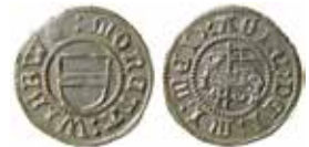
7. LL B:II:5 är en hvid från sent 1520-tal.