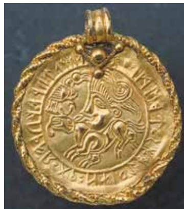
Den bevarade kopian av Vadstena-brakteaten.