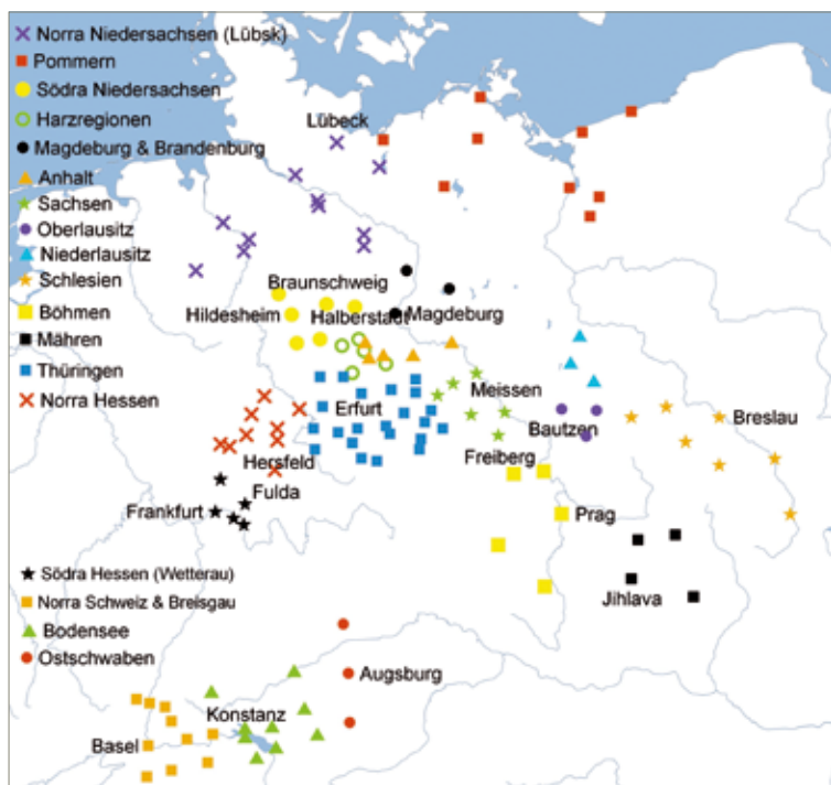
Karta 1. Olika myntfötter för brakteater 1140–1270.

De flesta biskopar (Verden, Hildesheim, Naumburg, Aschaffenburg, Heiligenstadt, Augsburg, Konstanz, Basel), abbotar (Helmstedt, Hersfeld, Fulda, Kempten) och abbedissor (Quedlinburg, Zürich) präglade dock brakteater med motiv av sig själva. Bild 22, 23 . Biskoparna och abbotarna bär alltid mitra (konformad eller dubbeluddig) och vid helfigur ofta kapp. De håller ofta en kräkla i ena handen och en (dubbel)korsstav, liljestav eller bok i den andra. Vål-