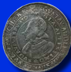
1 mark 1617 23.000:-

Ett urval mynt (inkl. köparprovision) som vi har sålt tidigare: