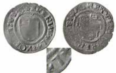
6b. Sören Norbys skilling utan år, LL B:I:1c, med myntmästaren Leinart Pauwermanns initial L, som inte är slagen på Gotland utan numera med säkerhet kan föras till Kustö borg i Finland.