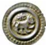
13. St. Gallen.