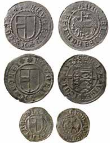
6a. Sören Norbys skilling utan år (1522–1523) och 1524, samt Sörens hvid utan år.

Man bör notera att en ytterst sällsynt variant av Sörens skillingar, LL B:I:1c, numera kan bevisas vara slagen i Kustö borg (omkring en mil