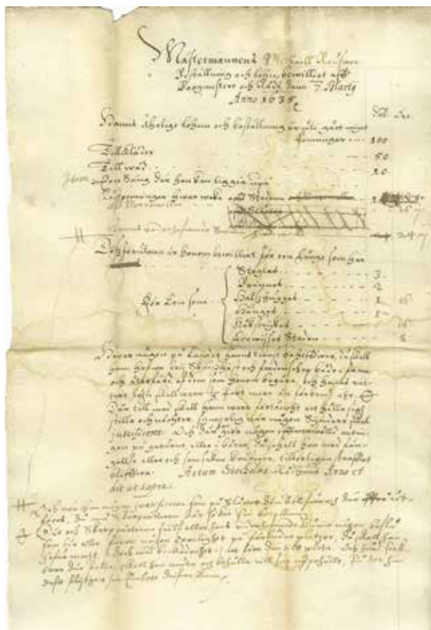
Bödeln Mikael Reissners löneavtal med Stockholms borgmästare och råd den 7 mars 1635.

År 1818 genomfördes den sista hängningen vid Skanstull i Stockholm. Den avrättade var fänriken Odelius