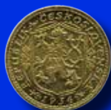
Tjeckoslovakien 1 ducat 1934 20.000:-