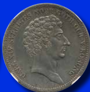
1 riksdaler 1827 30.000:-