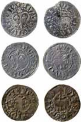
1. Yngre gotar slagna efter cirka 1410. Överst en gote med hyfsad silverhalt. Den mellersta är en ytterst sällsynt variant med högervänt lamm (saknas i LL). Den understa är slagen av nästan ren koppar, en "svart gote", och kan därmed dateras till 1440-talet.