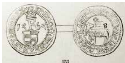
10. Jens Billes mynt. Ø 23 mm.

9. 1554 års gotländska mynt slagna i Köpenhamn; skilling, sösling (½ skilling) och hvid (⅓ skilling). De två förstnämnda med utsatt årtal "54".