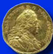
1 dukat 1745/4 36.000:-