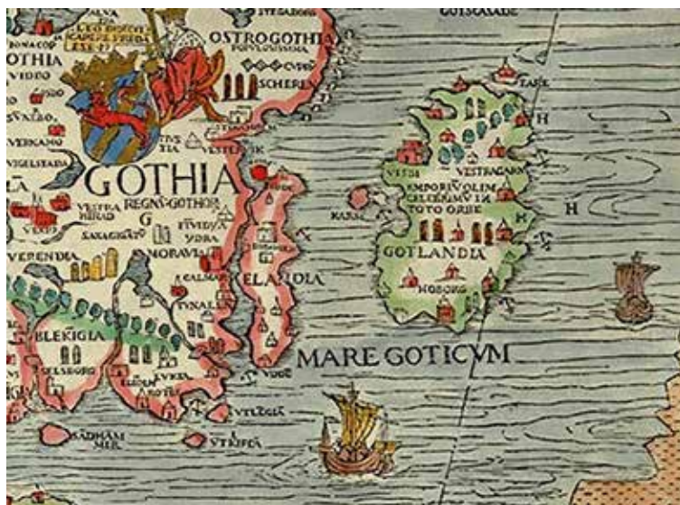
Gotland på Carta Marina 1539.

Den troligen yngsta W-brakteaten (av i stort sett ren koppar) från cirka 1450 är en mycket sällsynt typ med W inom strålring (fig. 3). Några vanliga varianter av W-brakteaten har bitecken i form av streck eller punkt