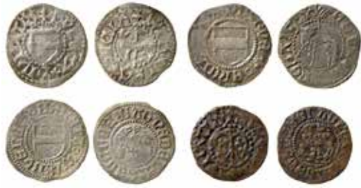
4. Exempel på gotländska hvider från perioden cirka 1450–1520. LL A:1, A:3b, A:5, A:7b.

Inskriften är ytterst sällan korrekt: i stället för MONETA NOVA / WISBVCENSIS är det vanligt med åtsidesinskrift eller fransidesinskrift på båda sidor.