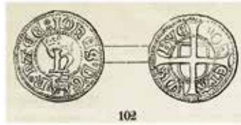
5. Kung Hans hvid. LL A:6. Ø 16 mm. Avbildning ur Haubergs Gullands Myntväsen (1891).

Åtsidesinskriften är dessutom ofta korrupt, till exempel MONETA NOAWIS eller liknande.