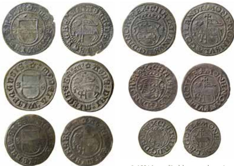
8. Gotländska skillingar 1535–1537.

Golabiewski Lannby, M.: Ny penning med tre kronor och bokstaven W och andra mynt med W. NNUM 2003: 5–6 s. 90–93.