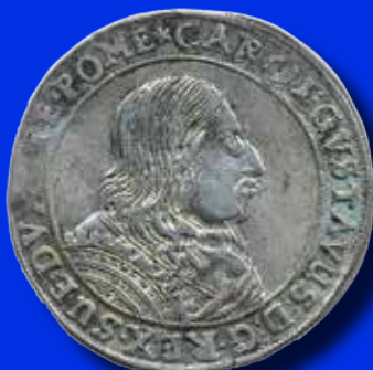
Pommern, 1 taler 1657 24.000:-