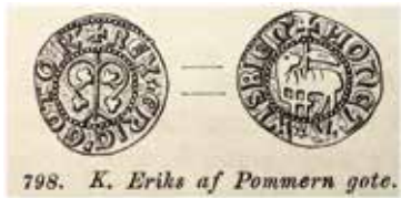
2. Erik av Pommerns gote med inskriften +REX ERIC GOTOR. Ø 17 mm. Bilden ur Hans Hildebrands Sveriges mynt under medeltiden (1887).