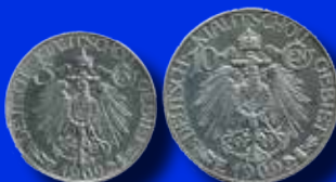
Kiaochow 5 och 10 cent 1909 40.000:-