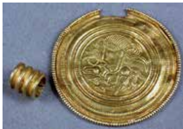
Guldbrakteat funnen i Västergötland och beskriven i en tidningsnotis 1853.