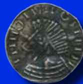
Irland 1 penny 41.000:-

Bättre mynt och hela samlingar mottages till kommande myntauktioner.