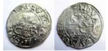
5–6. Okänd myntort, 1 öre 1611. Två stampidentiska exemplar med treflikigt blad eller blomma i omskrifterna.

KMK inv.nr 24 864, SML 4:807, Uppland) med slutår 1611.