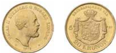
Oscar II. 20 kronor 1873 graverad av Lea Ahlborn liksom de följande som visas nedan. Guld. Upplagan var 115 108 exemplar. Mynten slogs vid Kungl. Myntverket i Stockholm, där myntmästaren vid denna tid hette Sebastian Tham.

Myntunionen klarade sig igenom unionsupplösningen mellan Sverige och Norge 1905 men föll till slut i samband med första världskriget. Den inflation som uppstod genom de ekonomiska påfrestningarna efter krigsutbrottet 1914 gjorde att länderna inte längre kunde uppfylla sina garantier om inlösen av mynt av lägre valörer och sedlar mot guldmynt.