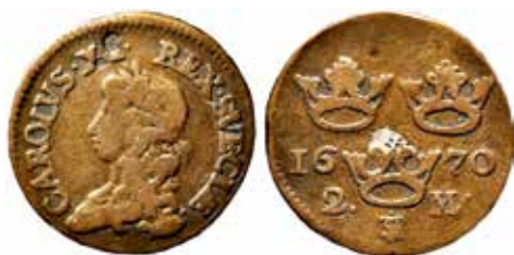
1. Karl XI, Stockholm, 2 mark 1670. Ø 29,2 – 29,6 mm, vikt 9,88 g. Koppar. Årtalssiffror typ 3*, stampställning 180 grader.

Biblioteket är öppet för besök efter överenskommelse med bibliotekarien. Mer info får du från carina.bergman@raa.se