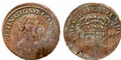
3. Kristina, Stockholm, 1 mark 1649 (?).

Myntets tidiga öde är höljt i dun- kel, men det är sannolikt slaget på myntverket i Stockholm med origi- nalstammar. Eftersom det är ett kop- parmynt kan man tänka sig att en anställd vid myntverket har slagit myntet för egen räkning. Myntet är därmed att anse som en förfalskning. Vilket myntämne som har kommit till användning är omöjligt att fast- ställa och spår av överprägling på ett äldre mynt kan inte upptäckas.