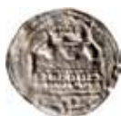
4. Okänt ursprung. Borg. 1100-tal. Skala 1:1. LL IA:15. Två kända exemplar, båda funna i Mackmyra, Gästrikland.