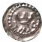
5. Svealand. Johan Sverkersson (1216–1222). Penning med krenelerat torn och kungens inledande bokstäver i namnet IO/hannes/. Finns i ett par varianter, LL III:6a–b. Fynd från Ljungkullen, Västergötland.