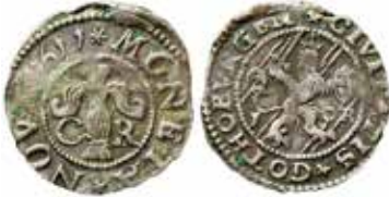
4. Göteborg, 1 öre 1611. Ex MISAB 10 nr 435.