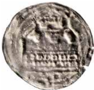
1–2. Borg med krenulerat murkrön.

Motiv på två brakteatpräglade mynt funna år 1930 i den ena delen av tvillingskatten i Mackmyra, Valbo socken, Gästrikland. LL 1A:15.