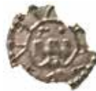
6. Svealand. Knut Långe (1229–1234). Penning med krenelerat torn och tydlig omskrift. Få kända exemplar. LL IVA:9. Fynd från Eskilstuna, Södermanland.