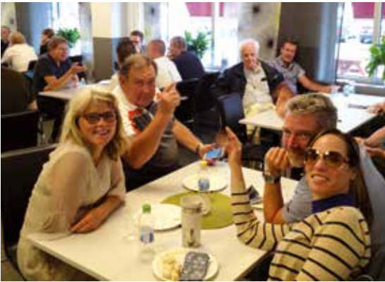
Avbrott för lunch med numismatiska diskussioner får man förmoda.