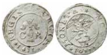
1. Stockholm, 1 öre 1611. Femuddiga stjärnor i omskriften. Ex MISAB 10 nr 429.

År 1611 utökades dock variantfloran. Under de senare åren har det uppmärksammats att Stockholm kanske inte var den enda myntorten för ettören av den här behandlade typen. Det myntades ju som bekant även i Göteborg under året, men stadens mynt är försedda med myntortens