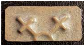
Halv pollett av koppar avsedd för mat eller nattlogi till små barn vid Åtvidabergs Kopparverk. Bredd 35 mm. KMK.

Åtvidabergs Kopparverk använde egna polletter för särskilda ändamål. Förutom de ovan nämnda, som var gemensamma med järnvägsbygget, hade man nio olika dryckespolletter av förtennt järnbleck. Dessa kunde gälla för exempelvis en butelj öl, en