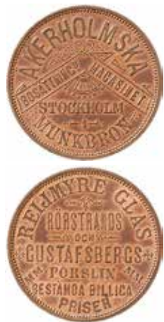
Åkerholmska Bosättningsmagasinet reklampollett.