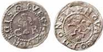
3. Stockholm eller annan myntort, 1 öre 1611. Åtsidans omskrift med en stjärna i punktring. Ex MISAB 13 nr 645.