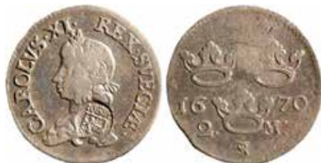
2. Som nr 1 men silver. Ø 30,2 mm, vikt 9,93 g. Årtalssiffror typ 4*, stampställning 180 grader. Kontramarkering 16S81 över sköld. SM 121b.