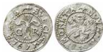
2. Stockholm, 1 öre 1611. ”Tulpan” i båda omskrifterna. Ex MISAB 10 nr 430.

namn, vilket ju gör att vi lätt kan särskilja dem. Därutöver har vi arkivaliska uppgifter om dels en kunglig myntning i Kalmar , som möjligen fortsattes i Nyköping , dels en hertiglig i Vadstena under 1611.