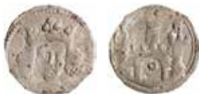
10. Troligen Norge. 1320-tal? Penning med krönt huvud och en borg med torn, krenelerad mur, port samt sidotorn. Ett fåtal exemplar är funna i Sverige, några fler i Norge. LL XXV:2. Fynd från Gudhems kloster, Västergötland.