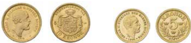
Oscar II. 10 kronor 1874 respektive 5 kronor 1881. Guld. 10-kronan utgavs 1874 i 461 058 exemplar och 5-kronan 1881 (som började ges ut detta år) i endast 65 000 exemplar, nu med Emil Brusewitz som myntmästare.

Eftersom myntkonventionen enbart var en valutaöverenskommelse och det inte fanns någon liknande överenskommelse om ekonomisk samordning mellan länderna, kunde den inte förhindra att inflationstakten utvecklades olika.