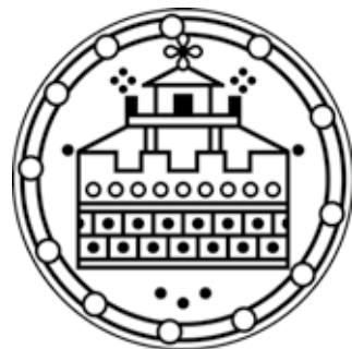
3. Stilerad sammanställning av de två borgmynten från Mackmyra. Den omgivande ringen tycks ha utformats för att passa borgmyntet.

TOLKAD OCH TECKNAD AV EMMELIE GOLABIEWSKI.