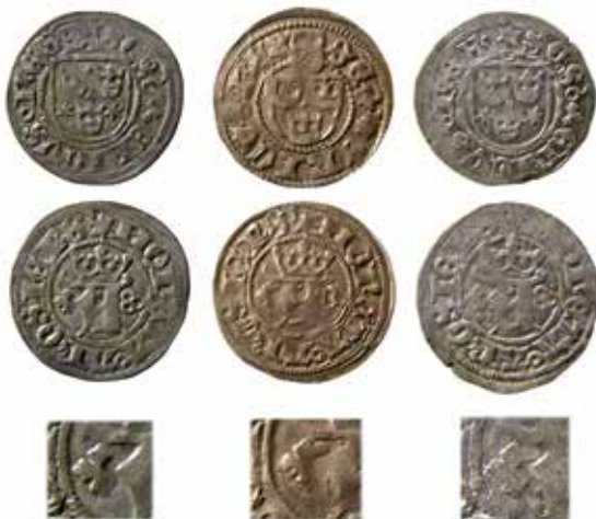
6. Tre örtugar slagna med samma fränsidestamp, 544 04.

Notera stampskadorna på det översta klöverbladet på fränsidestampen, vilket är oskadat på mynt nr 1 (som kan dateras till 1501–1503 då det är slaget med samma åtsidestamp som mynt nr 2 i Fig. 5). Skadorna på mynt nr 2 och 3 visar att de är slagna efter mynt nr 1.