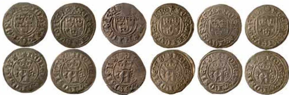
5. Örtugar från Hans (1497–1501), Sten Sture den äldre (1501–1503), och Svante Nilsson (1504–1512), alla slagna med samma frånsidestamp, 544 01. Ordnade kronologiskt efter gradvis ökande rostangrepp på frånsidans stamp.

marberg 1985 sid. 65). Detta hade även noterats av Lagerqvist redan 1961, not 105, sid. 59: ”myntet var uppbränt, så även redskapen”.