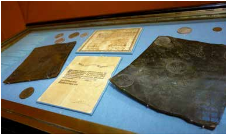
Den trevliga montern med svenska föremål innehåller: Sigismund, riksdaler 1595; Karl IX, 8 mark 1608; Karl XI, 4 mark 1696; Kristina, dubbelriksdaler 1644; Karl XII, riksdaler 1707; Karl XII, nödmünt 1715; Gustav II Adolf, öre 1630; Ulrika Eleonora, 2 daler sm 1719; Fredrik I, 4 daler sm 1739; Stockholm Banco, 10 daler sm 1666; Rikets ständers växelbanco, transportsedel för 6 daler km 1760.