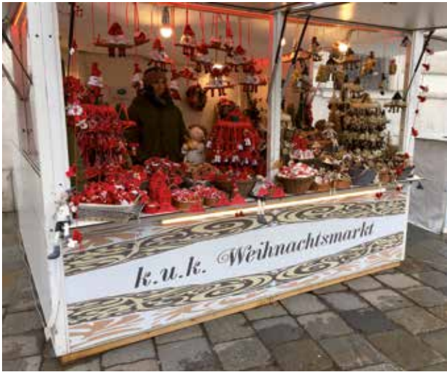
Wiens romantiska julmarknader hade precis startat och bland stånden såldes bland annat pepparkakor, handmålade glaskulor och glögg. Här kungliga och kejsrerliga julmarknaden.