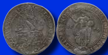
1 daler 1559