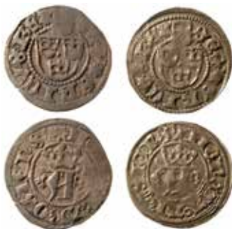
2. De nu kända exemplaren av Svante Nilssons örtug LL 1. Till vänster ex KMK (1,26 g), till höger ex UUMK (1,52 g). Åtsidorna på mynten är stampidentiska; fränsidan på myntet till vänster slagen med stamp 544 01, medan fränsidan på myntet till höger är slagen med en annan fränsidestamp – 544 04.

nade ett helt kapitel åt den medeltida myntningen, skriver han att Svante endast slog halvörtugar. I en fotnot utvecklar han argumentet: ”Brenner berömmar sig i sin Thesaurus nummorum öfver att ega en hr Svantes helörtug från Västerås – det enda kända exemplaret –, hvilket han ock afbildat pl. VIII, fig. 4. Detta mynt har sedermera öfvergått till k. Myntkabinettet, men det är uppenbarligen falskt ...”.