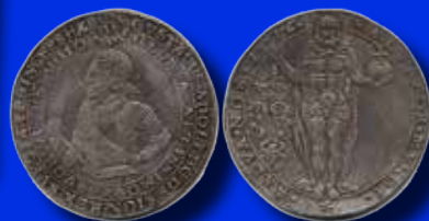
1 riksdaler 1616