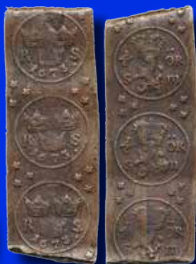
1/6 öre SM 1673