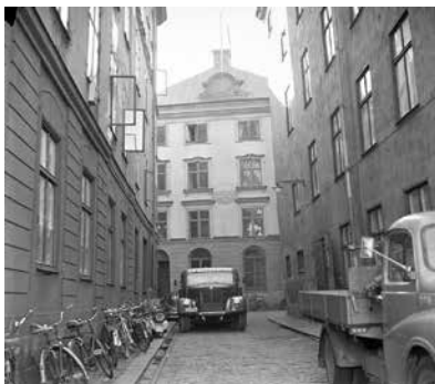
Gaffelgränd i september 1957. I fonden Stockholms Sjömanshus.

Libertas gjorde två resor till Brasilien med Carl Schmidt som kapten, den första från oktober 1821 med återkomst till Stockholm sommaren