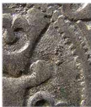
4. Förstoring av en del av bottenytan på dels en Västeråsörtug från Hans, dels en anonym örtug ur Västeråsskatten – båda slagna med stamp 544 01.

Man ser tydligt hur stampen, när den använts för den senare, är kraftigt rostangripen och därmed kan man bevisa att den är slagen senare än Hans-örtugen.