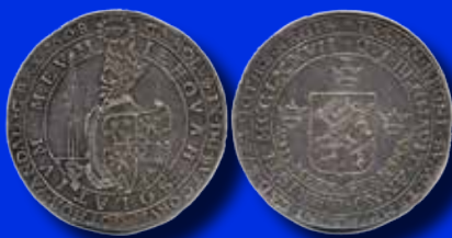
8 mark 1608