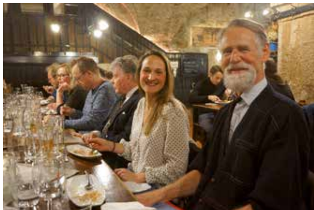
Österrisk middag på Melker Stiftskeller.