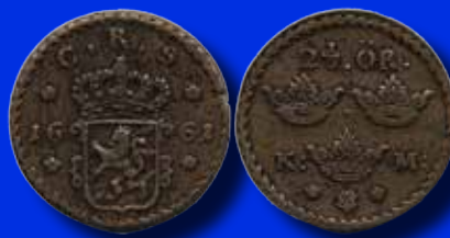
2 1/2 öre 1661

Bättre mynt och hela samlingar mottages till kommande myntauktioner.