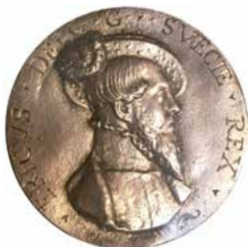
Denna ensidiga silvermedalj över Erik XIV (Hild. 12) är en av Sveriges allra första medaljer.

I myntkabinettet är vi svenskar alltså omedelbart på hemmaplan och detsamma gäller för övrigt hela Skandinavien. I medaljsalen är detta särskilt påtagligt och här finns det par montrar helt dedicerade till Skandinaviens äldre respektive modernare medaljkonst 3 . Det svenska hovet anställde under 1600- och 1700-talen personal till statsapparaten från hela Europa – så också till mynt- och medaljproduktionen. Tysken Sebastian Dadler och schweizaren Johann Carl Hedlinger gjorde medaljer av högsta