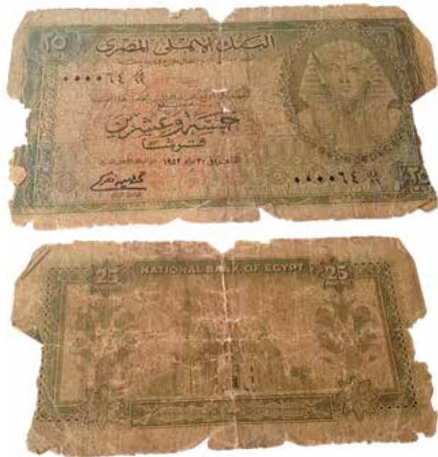
FÖRMINSKAD.