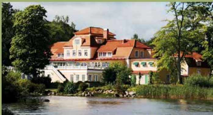
Anrika Möckelsnäs herrgård från sjösidan.

Inlämning till höstens ordinarie kvalitetsauktion pågår hela maj månad ut. Fortlöpande tar vi även emot objekt till våra mycket populära internetauktioner.