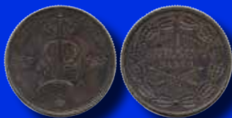
4 skilling banco 1844. Provmynt