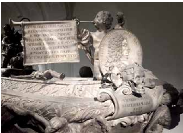
Detalj från Kejsaren Josef I:s (1705–1711) sarkofag.

Många av kistorna var utsmyckade med medaljonger med en bild på regenten.