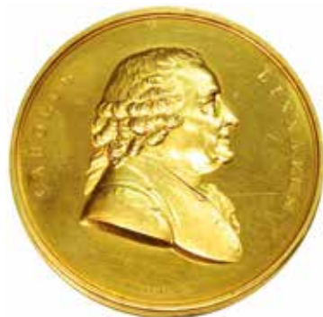
Guldmedaljen med Carl von Linnés porträtt i Bretttauers samling ”Medicina in nummis”.

Detta fick avsluta vår helg i världsstaden Wien och väl på flygplatsen noterades att tidningsaffären både hade Money Trend och Münzen Revue – vi lämnade ett civiliserat land.