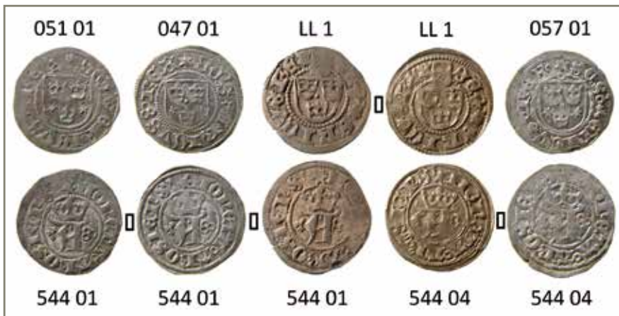
3. Stampkopplingar via fränsidestamparna på Svantes örtugar (mynt nr 3 och 4) med anonyma örtugar (mynt nr 1, 2 och 5) i Västeråsskattens kedja 1 . Stampidentiska åt- och fränsidor markerade med en liten rektangel. De tre mynten till vänster är slagna med fränsidestamp 544 01, de två återstående med fränsidestamp 544 04. Åtsidornas stampnummer enligt Malmer & Hammarberg 1985.