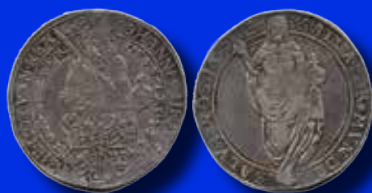
1 daler 1592