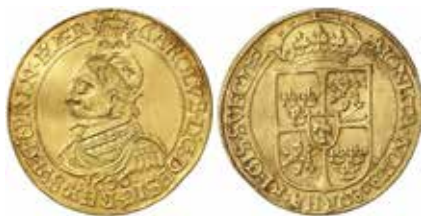
1. Karl IX, Stockholm, 2 ungerska gyllen 1606. Utan valörbeteckning.

Vi kan endast spekulera i skälen till varför man präglade guldmynt utan valörbeteckning innan årsskiftet 1605/06. En möjlighet är ju att Karl IX från början avsåg att ge ut ungerska gyllen, inte mynt enligt svensk