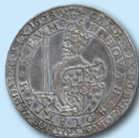
8 mark 1608 81.000:-