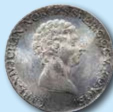
Norge 1 speciedaler 1824 57.000:-