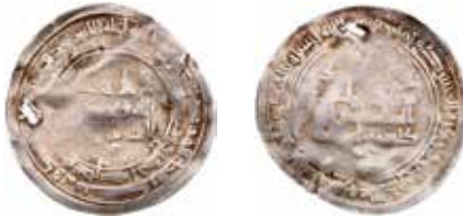
Mynt 4. Daysam bn Ibrahim, Azerbajdzjan, 341 e.H.