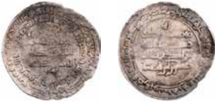
Mynt 1. Daysam bn Ibrahim, Barda'a, 325 e.H.