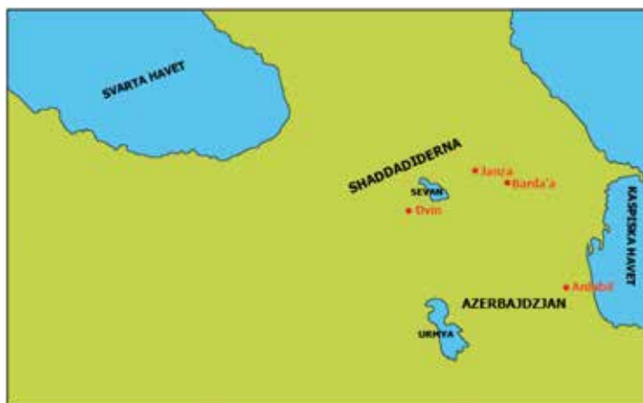
Karta över Transkaukasus med Azerbajdzjan där Daysam bn Ibrahim härskade och shaddadidernas område är utmärkta.

Jibalprovinsen var delad i två delar och den mindre av dessa två och området väster därom tillhörde Kur-