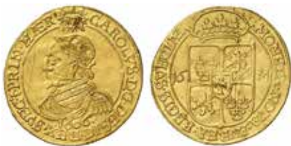
2. Karl IX, Stockholm, 16 mark 1606 (stort årtal, stamp 1). Med valörbeteckning, 16 M.