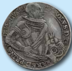
1 daler 1598 106.000:-