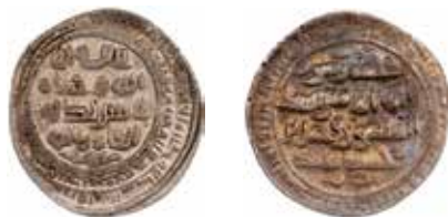
Mynt 5. Al-Fadl bn Muhammad bn Shaddād, Janza, 400 e.H.

Referenser: Gunnar Holsts samling, KMK; Vardanyan & Zlobin 2014