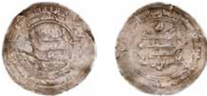
Mynt 3. Daysam bn Ibrahim, Azerbajdzjan, 341 e.H.