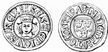
1. Örtug från Stockholm med omskriften SCS ERICVS REX på åtsidan och MONETA STOCKHOLM 1478 på frånsidan.

Som jag är ägare av tio (10) st gamla mynt, vilka äro hittade i Ytterhogdals socken i Huskölens by (Jämtlands län)