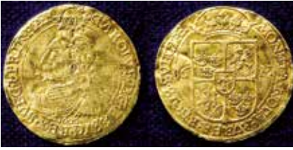
3. Karl IX, Stockholm, 16 mark 1606 (litet årtal, stamp 2). Med valörbeteckning, 16 M.

ANTIKÖRENS AUKTION 17, FOTO: ULF OTTOSSON.