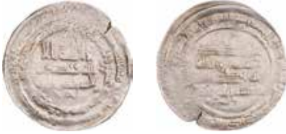
Mynt 2. Daysam bn Ibrahim, Barda'a, 327 e.H.