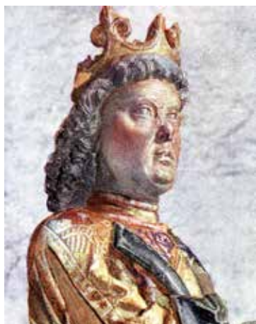
Sannolikt porträttlik trästaty av kung Karl Knutsson Bonde. Konstnär: Bernt Notke (cirka 1440–1509).