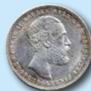
Norge 1/2 speciedaler 1873 181.000:-

Bättre mynt och hela samlingar mottages till kommande myntauktioner. Vi har mycket goda möjligheter att finna köpare till dina objekt eftersom mer än 20.000 kunder i Sverige och utlandet ser varje auktion via vår hemsida och katalogen. Kontakta oss för en förutsättningslös diskussion!