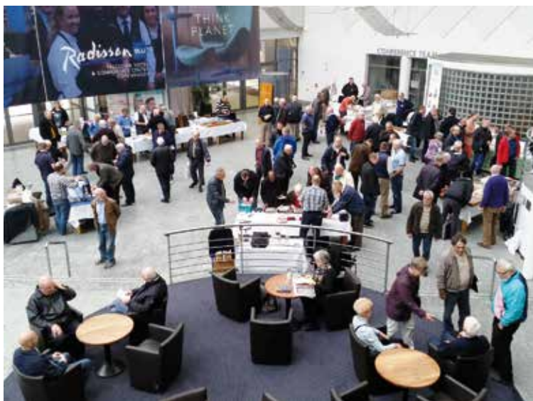
Før åbningen Møntbørs 2015 på Frederiksberg.