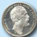
1 riksdaler riksmünt 1873 39.000:-