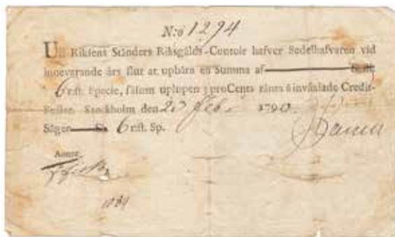
Riksgäldskontorets räntepollett på 6 runstyck specie 1790. Mått cirka 157 × 93 mm.