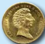
4 dukater 1843 68.000:-