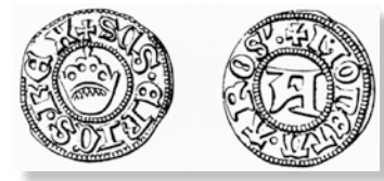
2. Halvörtug från Västerås med omskriften SCS ERICVS REX på åtsidan och MONETA AROS på frånsidan.

den 23/9 1911. Mynten hittades av 2 st. arbetare som var sysselsatt med odling, där det ej odlats förut, utan odlingsplatsen var en tallbacke ungefär 10 meter från Ljusnan (elf). Det hittades (16) sexton mynt av vilka jag nu är ägare av 10 st. Nu tänker jag sälja mynten och frågar härmed vördsamt huru högt pris de betingar. 6 utav mynten äro från Sten Stures d.y. tid, 2 st från Karl VIII Knutssons örtugar, samt 2 st från Erik den XIV tid. Alla mynten äro av silfver. Wore nu tack-samt om jag kunde erhålla underrättelse, huru högt värde de har.