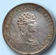
Norge 1/2 speciedaler 1832 135.000:-