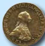
Ryssland 5 rubel 1762 460.000:-