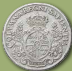
Kristina. 1½ rd/8 mark 1649. Utrop: 100 000