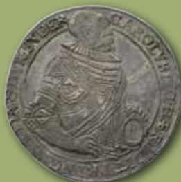
Hertig Karl. Daler 1594. Utrop: 150 000