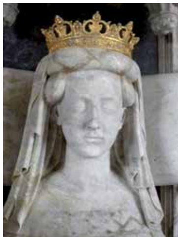
Detalj av drottning Margaretas sarkofag i Roskilde domkyrka.