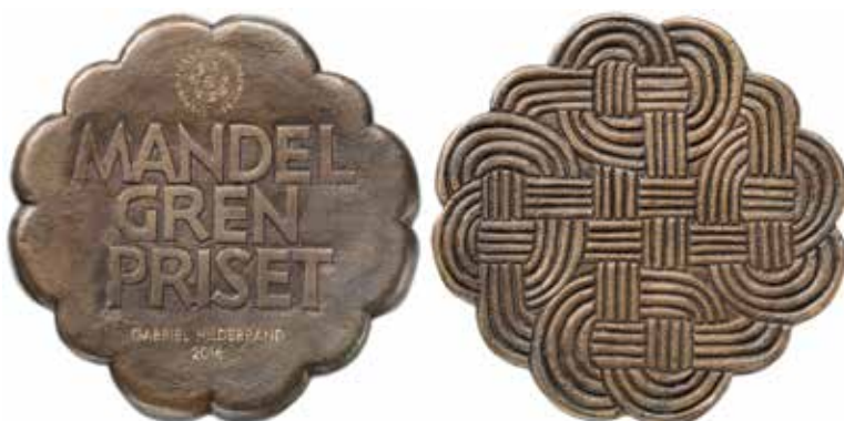
Svenska Fornminnesföreningens nyinstiftade prismedalj har formgivits av Annie Winblad Jakubowski.

Diameter 100 mm. Här i skala 1:2. Material: brons. Gjuten hos H. Bergmans Konstgiuteri, Enskele.