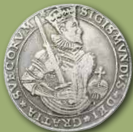
Sigismund. Daler 1595. Utrop: 100 000

Auktion 20 avhålls fredagen och lördagen den 9-10 september på Hotell Sheraton, Stockholm. Auktionskatalogen erhålls genom insättning av 190 kronor till bg 399-0090.