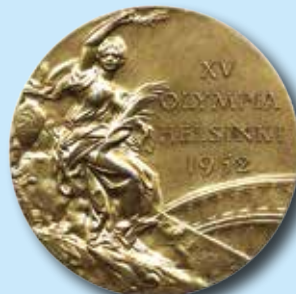
Finland OS 1952 Guldmedalj 99.000:-

Bättre mynt och hela samlingar mottages till höstens myntauktion.