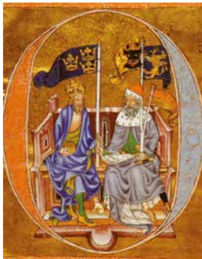
Albrekt av Mecklenburg som svensk kung och hans far. Anfang på titelsidan till Ernst von Kirchbergs rimkrönika 1378.