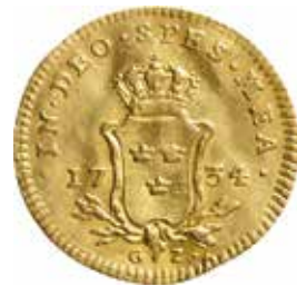
Fredrik I. Stockholm. 1 dukat 1734. Ø 22 mm. Skala 1,5:1. Gravör var J. C. Hedlinger. Myntmästarens Georg Zedritz initialer ses längst ner på fränsidan.