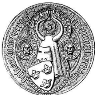
Rekonstruktion av Albrekt av Mecklenburgs trekronorssekret. Originalen finns på Riksbankens arkiv.

Albrekt var inte ensam om sitt val av skäggsfrisyr, det vittnar flera samtida avbildningar om. Sticker ut gör gestaltningen av den engelske sagokungen Arthur med tudelat skägg på en fransk tapet vävd i slutet av 1300-talet. Inte minst intressant därför att han också visas med en sköld, där tre gyllene kronor ses ordnade två över en mot blå botten. Till skillnad från det medeltida skäggsmodet har trekronorsskölden diskuterats flitigt i artiklar och böcker.