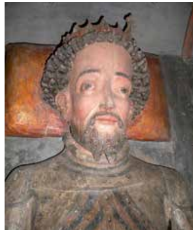
Albrekt av Mecklenburg (död 1412) med sitt kluvna skägg och mustascher. Samtida gravvård i Mecklenburg.

Den förre svenske kungen, Magnus Eriksson, hade en syster vid namn Eufemia. Hon var gift med hertig Albrekt II av Mecklenburg. År 1338 fick paret en son, som döptes till Albrekt efter sin far. Ännu var det långt kvar till arvkungadöme i Sverige (Erik XIV skulle bli förste arvprinsen), men Albrekts kungabörd gjorde honom lämplig att inkallas av de svens-