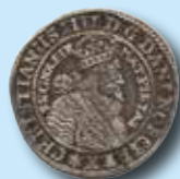
Norge 1/4 speciedaler 1631 68.000:-