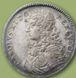
Karl XI. Riksdaler 1676. Utrop: 100 000