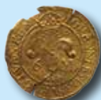
6 mark 1590 218.000:-

Ett urval mynt (inkl. köparprovision) som vi har sålt tidigare: