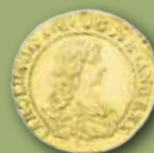
Karl XI. Dukat 1664. Utrop: 100 000