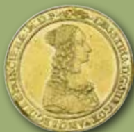
Kristina. 2 dukater 1646. Utrop: 100 000