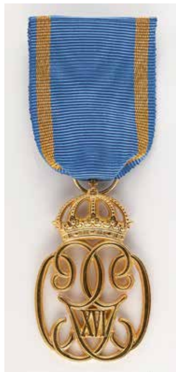
2. Kung Carl XVI Gustafs jubileumsminnestecken med anledning av 70-årsdagen. Mått 50 × 33 mm. Bandet 35 mm brett.

Härmed återknyts till en tradition med så kallade genombrutna tecken, inspirerat av kung Gustav V:s minnestecken II från år 1948. Fig. 2.