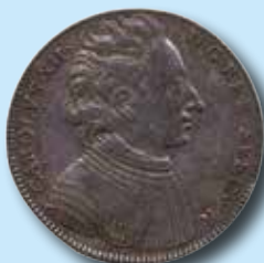
1 riksdaler 1707 49.000:-