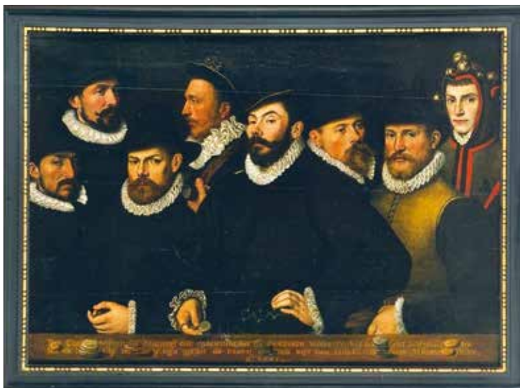
1. Målning av okänd konstnär daterad 1581 föreställande myntmästaren i Zaltbommel, Clemens van Eembrugge (i mitten, med ett mynt i handen) och hans personal. Lägg märke till pojken i narldräkt längst till höger. Vid många av myntverken i Nordeuropa var det tradition att den yngste gesällen bar en sådan dräkt.

Clemens van Eembrugge hade blivit utsedd till myntmästare i Zaltbommel år 1579. Två år senare avgick han och var därefter verksam vid olika myntverk i Nederländerna (Batenburg och Nijmegen) och i Tyskland. Under åren 1589–1591 var han återigen myntmästare i Zaltbommel;