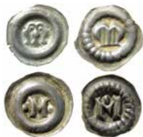
7–10. Magnus ladulås (1275–90). Svealand. Brakteater med M inom slät ring respektive strårling.