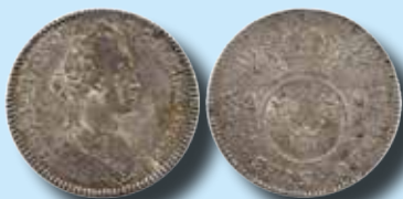
2 mark 1719