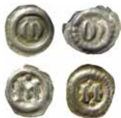
11–14. Magnus ladulås (1275–90). Götaland. Brakteater med M inom slät ring respektive strårling.

krönt lejon. Fig. 3–4. Myntningsavfall har hittats i Örebro och Lödöse respektive. De flesta bevarade exemplaren kommer från ett gigantiskt myntfynd i Styra socken i Östergötland år 1786, då över 30 000 av dessa mynt hittades. Endast en mindre del av dem inlöstes till statssamlingarna, resten av fyndet skingrades bland privata samlare och andra. Troligen nersmältes även delar av skatten.