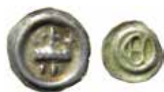
5. Valdemar/Magnus ladulås. Svealand. Brakteat med krona.