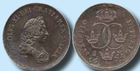
8 mark 1672