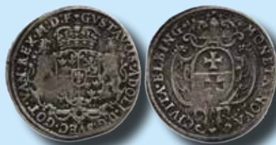
Elbin ½ thaler 1628 XR