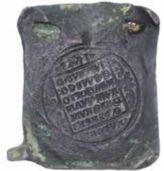
Gustav I Vasa. Svartsjö, 2 mark/16 öre 1543. 55 × 68 mm.