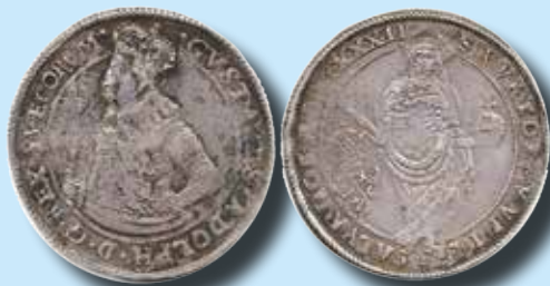
1 riksdaler 1632 Avvikande porträtt och rättvänt vapen