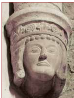
Birger jarl. Stenhuvud i Varnhems kyrka där han ligger begravd.