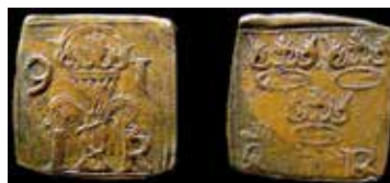
4. 8 öre klipping 1591, samtida förfalsknings.