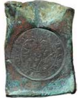
Gustav I Vasa. Svartsjö, 1 mark 1541. 50 × 68 mm.