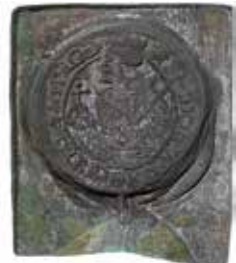
Gustav I Vasa, Svartsjö, ½ mark 1542. 41 × 45 mm.

torie- och Antikvitetsakademien "för vidare åtgärd". Den 3 april samma år betalades 50 kronor för dem och de tillfördes Kungl. Myntkabinettets samlingar med inventarienummer 13696. I inventariet står följande beskrivning av dem: