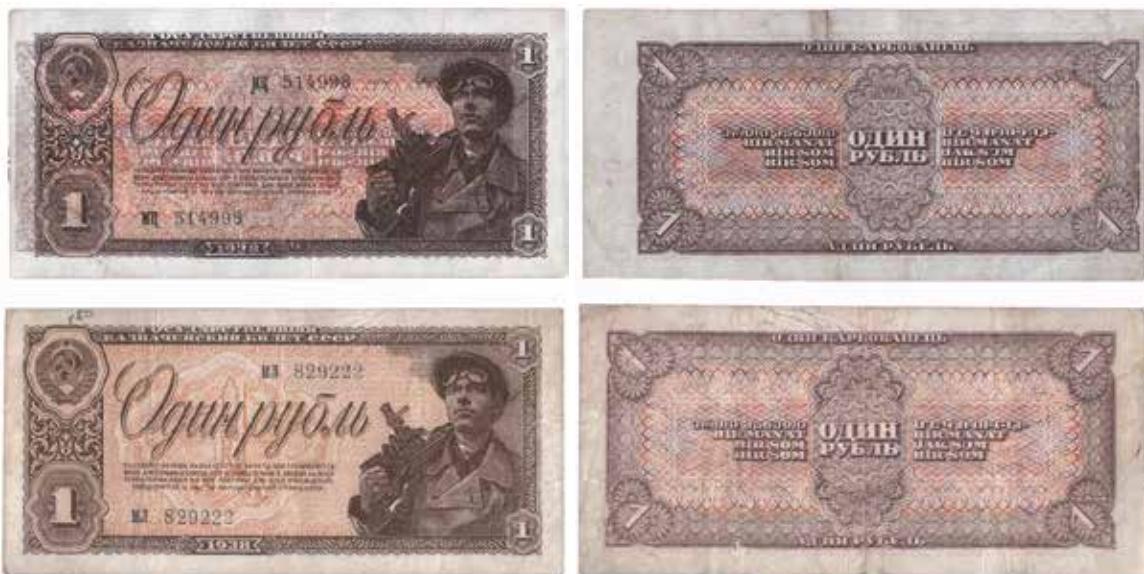
Sovjetiska 1-rubelsedlar 1938, varav den översta är feltryckt. Storlek 80 × 40 mm.