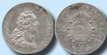
4 mark 1753

Mynt och hela samlingar mottages till vårens/höstens auktioner. Vi har mycket goda möjligheter att finna köpare till dina objekt eftersom mer än 20.000 kunder i Sverige och utlandet ser varje auktion via vår hemsida och katalogen. Kontakta oss gärna för en förutsättningslös diskussion!