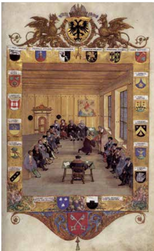
2. Möte i Regensburgs rådhus år 1536; målning av Hans Muelich (1516–1573). Den ger en bild av hur det kan ha sett ut när Casper Leuhusen stod inför rätta i Stockholms rådstuga år 1592.

orter för provinserna Gelderland respektive Friesland), men utan resultat. Så småningom blev förfalskningarna i stället beslagtagna av myndigheterna i Amsterdam. Syvert – som hotades av livsstraff – försökte försvara sig med att varken han eller Simon hade tjänat något på myntaffärerna. I slutändan lät därför borgmästarna i Amsterdam ”nåd gå före rätt” och dömde Syvert till dryga böter.