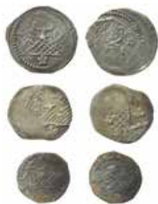
15–17. Birger Magnusson. Mynt tillkomna efter myntreformen cirka 1290.

Mynten är mycket enhetliga med en krona på ena sidan och en bokstav på den andra – båda oftast försedda med ett ruttmönster. Ett flertal bokstäver förekommer, men tolkningen är i många