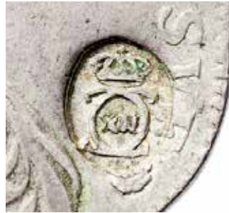
Förstoring av kontramarkeringen med Karl XII:s krönte monogram.

Valören 5 öre med kontramarkering är relativt vanliga mynt, medan markmynten är sällsynta. MISAB 16 anger endast 6–10 exemplar av 4 mark i privata samlingar. Mynten har blivit populära bland samlare av både rikssvenska mynt och besittningsmynt men även bland specialsamlare av kontramarkeringar.