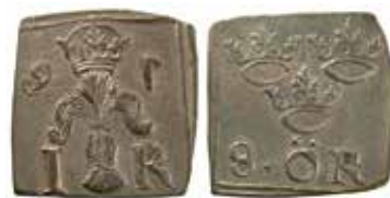
3. 8 öre klipping 1591, ett äkta exemplar från Stockholms myntverk.

Den 6 maj 1592 inleddes en process i Stockholms rådhusrätt som möjligen kan ha ett samband med de holländska förfalskningarna. En av stadens förmögna köpmän, Casper Leuhusen , stod nämligen anklagad för att ha försökt prångla ut ”misstänkta” klip-