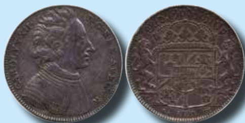
1 riksdaler 1707 Eget hår