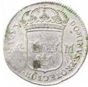
Riga. 4 mark 1693. Kontramarkerat med Karl XII:s monogram. Genom kontramarkeringen fördubblades myntens nominella värde en kort tid.