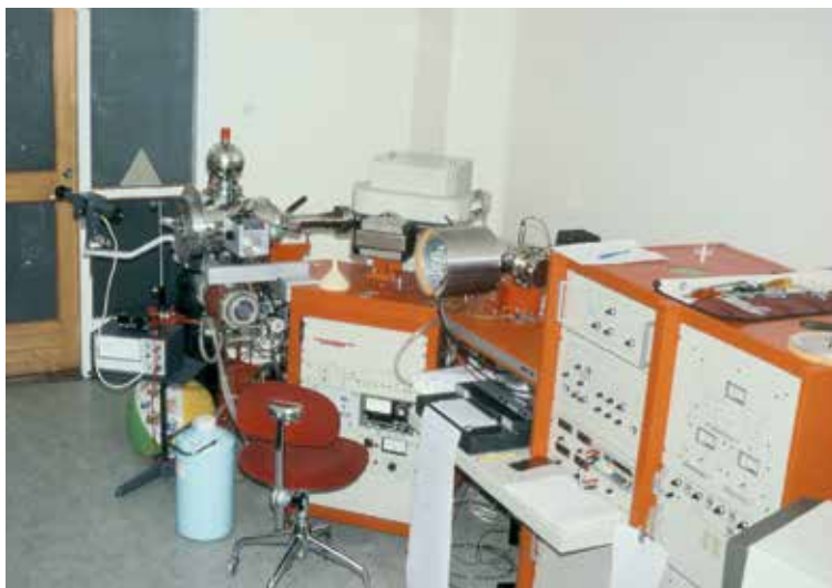
Masspektrometer för isotopbestämning av tungmetaller. Naturhistoriska Riksmuseet, Avd. för Geovetenskaper.

Varför är det då så intressant att kunna påvisa spårämnen? Svaret är att dessa ämnen är av stor betydelse när det gäller att bedöma ett mynts äkthet. För några hundra år sedan kunde man inte framställa helt rena