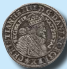
Norge ¼ speciedaler 1631