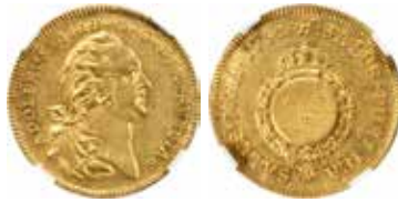
4. Adolf Fredrik, Stockholm, 1 dukat 1752. Såld för $ 6 000.