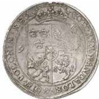
2. Sigismund, Stockholm, 1 daler 1594. Sålđ för $ 24 000.

köptes till en norsk samling för höga $ 28 000 + 17,5% ( bild 1 ). 1 ½ mark 1562 (MS-61) såldes för $ 3 800.