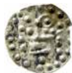
10. Ärkebiskopen i Uppsala, 1190-tal. En utsträckt hand som håller en biskopsstav.

verna IVA eller IV, fig. 4. Flera olika tolkningar av de senare har framförts. Frågan om dessa bokstävers betydelse får till vidare anses vara öppen.