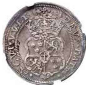
1. Erik XIV. Stockholm. ½ daler 1561. Sålđ för $ 28 000.