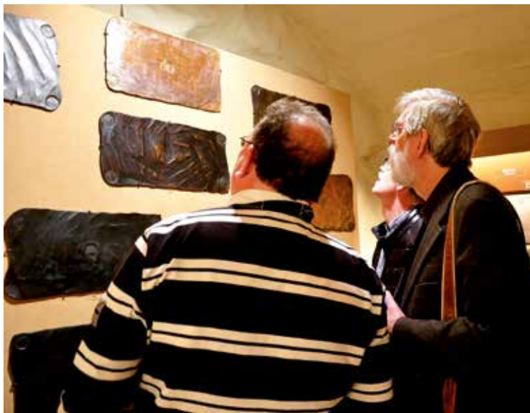
4. En hel vägg med 8-dalermünt.

Men framför allt är det samlingens silver- och guldmynt som sticker ut. Många av dem fångar effektivt åskådarens öga i utställningen. Förutom Gustav I:s tidiga, klassiska dalrar brukar besökarna imponeras av mark ortig 1593 (SM 8), den extremt sällsynta interregnum- och typdalern 1600 (SM 8), Erik XIV:s 2, 1 och ½ mark Reval 1561–1562, hertig Karls 8 mark