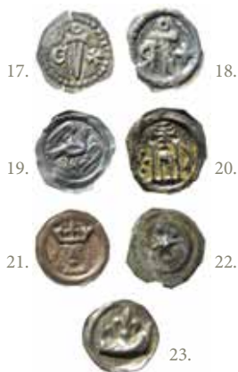
Götalandspenningar sannolikt präglade för Erik Eriksson (1222–29, 1234–50). 17–18. Svärd omgivet av uncialt E och kors respektive spegelvänt R och kors. 19. Fågel. 20. Kyrkobyggnad. 21. Krönt huvud. 22. Stjärna och nymåne. 23. Krona.