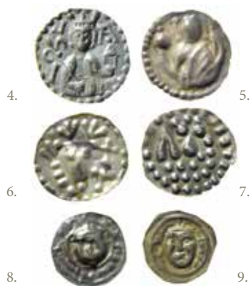
Knut Eriksson (1167–96). 4–7. Svealandspenningar, Sigtuna. 8–9. Götalandspenningar, Lödöse.