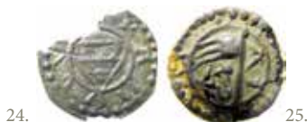
Svealandspenningar. 24. Knut Långe (1229–34), heraldisk sköld med omskriften KANVTVS. 25. Möjligen Ulf jarl (1231–48), tretungad fana samt bokstäverna VICA.

Myntning under Knut Långe är endast belagd från Svealand. I ett fynd från Eskilstuna kyrkogård 1879 fanns ett flertal typer. Vissa med inskriften KANVTVS, andra med inskriften ARVSAR – syftande på myntorten som bör ha varit Uppsala (Östra Aros). Några typer har mer eller mindre förvirrade inskrifter. Många av mynten i fyndet var fragmentariska.