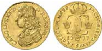
3. Karl XI, Stockholm, 1 dukat 1677. Såld för $ 9 500.