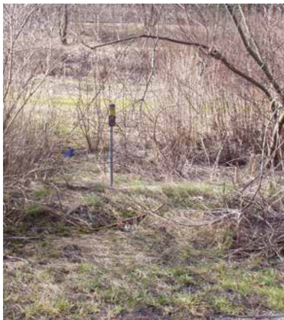
BILDEN ÄR BESKUREN.

25–28. Avesta, ¼ skilling 1805 (1 ex), 1806 (1 ex), 1807 (1 ex), 1802–08 (1 ex).