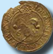
Sverige 6 mark 1590