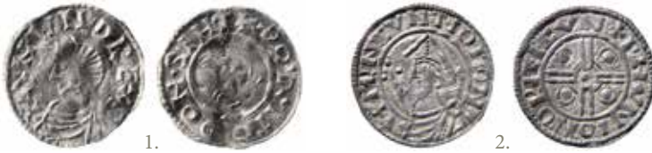
Anund Jakob: 1. Long Cross/Small Cross-hybrid med reguljära inskrifter (ANVND REX S / DORMOD ON SIH). 2. Penning av typen Pointed Helmet med barbariserade inskrifter på båda sidor.