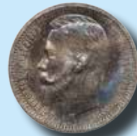
Ryssland 1 rubel 1913 Proof 266.200:-

Bättre mynt och hela samlingar mottages till vårens auktioner.