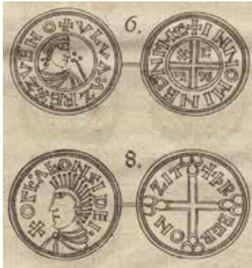
Två mynt från Olof Skötkonungs tid avbildade i Nils Keders Nummi aliquot diversi ex argento praestantissimi ... tryckt i Leipzig 1706.

Troligen den äldsta tryckta avbildningen av Olofs mynt.