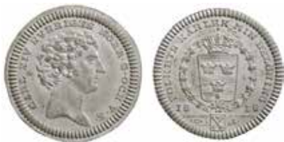
Karl XIV Johan, avslag av åt- och frånsida i tenn för en tilltänkt myntning av daladukater 1818. Ingår i den osålda delen av Sven Svenssons samling, katalognummer 5073.

Vi kan bara spekulera i varför det inte slogs några "daladukater" under Gustav III:s regering. Man hade redan 1786 upphört med den regelbundna präglingen av dukater med Smålands vapen, trots att leveranserna av guld från Ädelfors fortsatte oavbrutet under åren fram till sekelskiftet; endast under år 1796 slogs dylika mynt. Detta tyder på att man inte längre var lika mån om att framhålla produktionen av det inhemska guldet inför allmänheten.