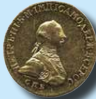
Ryssland 5 rubel 1762 St. Petersburg