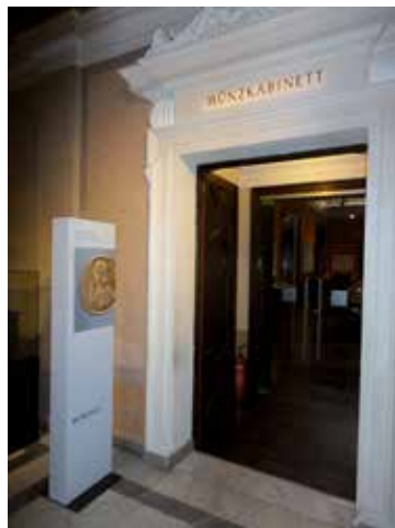
1. Entrén till Myntkabinettet vid Konsthistoriska museet i Wien.