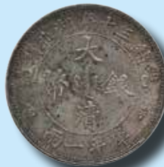
Kina Hupeh Prov. tael30 (1904) 67.700:-