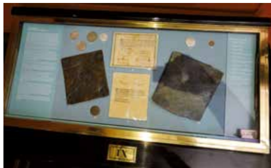
3. Monter med svenska mynt.