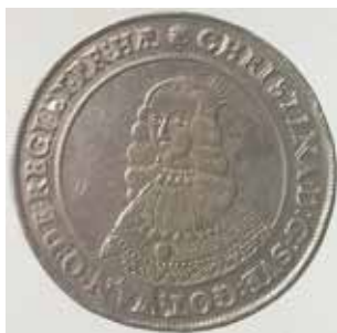
4. Kristina, Stockholm, 2 riksdaler 1644.