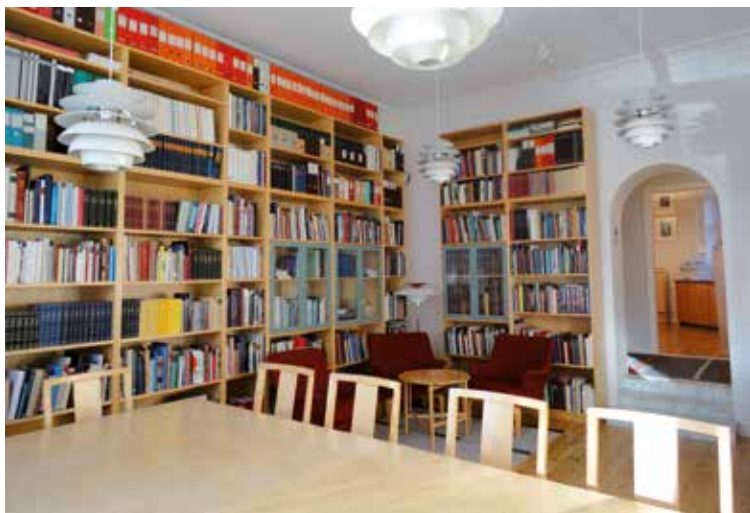
Svenska Numismatiska Föreningens bibliotek och mötesrum på Banérgatan 17.

En annan nyhet, från 1970-talet, var att Riksbanken på den tiden hade funderingar på att släppa ut en del av den svenska guldreserven bestående av en större mängd 20-kronor 1925 på marknaden. Nu var inte tanken att släppa ut alla 300 000 som enligt uppgift finns i guldreserven. Tanken var att släppa ut ett mindre antal mynt samt att "kontramarkera" dessa på