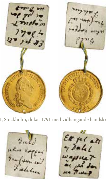
Gustaf III, Stockholm, dukat 1791 med vidhängande handskriven lapp.

Följande år skedde bara en leverans av faluguld till Myntet; den 5 december 1791 gjordes en inlämning motsvarande 285 dukater 37 öre. Visserligen slogs endast 1160 dukater under året, men faluguldet motsvarade bara en fjärdedel av den metall som levererades till präglingen. Påståendet som citeras inledningsvis är således inte helt korrekt.