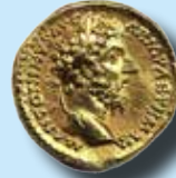
Romerska Imperiet Aureus / Marcus Aurelius (161-180)

Ett urval mynt (inkl. köparprovision) som vi sålt tidigare: