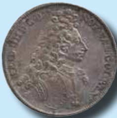
Danmark 1 speciedaler 1704 47.100:-

Ett urval mynt (inkl. köparprovision) som vi sålt tidigare: