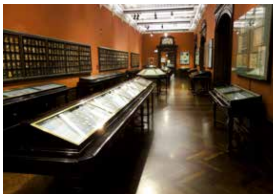
2. Interiör i Wiens Myntkabinettet med dess utställningar.