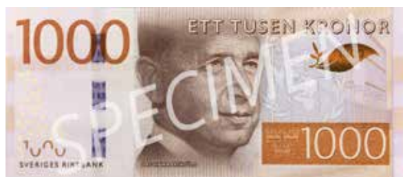
1 000 kronor: Dag Hammarskjöld – Lappland. 66x154 mm.