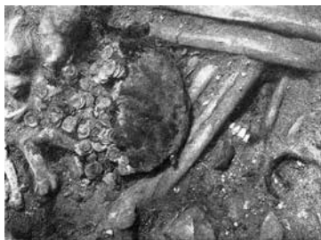
2. Läderpungen med de 385 mynten.

Materialet är helt enastående. I utställningen på Historiska museet presenteras och visas valda delar av de medeltida rustningarna, såsom harnesk och ringbrynjor. Se fig. 1. Inte ens nedskrivna berättelser kan som arkeologiskt funna originalföremål från enskilda slag säga något om hur