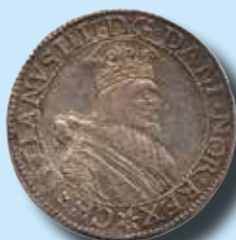
Norge. 1 speciedaler 1628 151.200:-