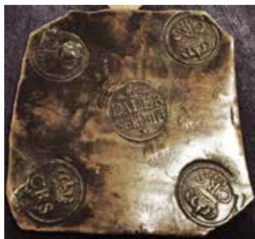
Det unika plåtmyntet ½ daler sm 1712.

En av kvällens åhörare hade med sig ett nyinköpt plåtmynt från USA. En 2-daler sm 1674 som måste ses som en viktraritet. Dalern är troligen slagen efter den förordning som gällde fram till slutet av 1673 och väger över 3 kg. 2-dalern ska enligt 1674 års förordning väga endast 2,721 kg.