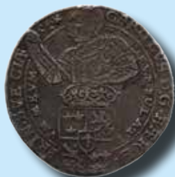
1 daler 1601 26.600:-

Ett urval mynt (inklusive köparprovision) som vi har sålt tidigare: