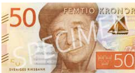
50 kronor: Evert Taube – Bohuslän. 66x126 mm.