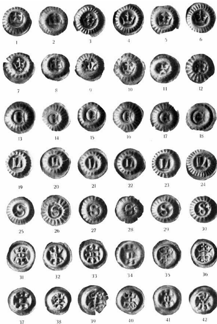
3:1-42. Exempel på mynt i en läderpung funnen i den större Korsbetningsgraven, fynd I (inv.nr 19325). Plansch ur Thordeman 1932 (fig. 28).

medeltidens krigare var rustade. Och om till exempel en av individerna finns genom undersökning av hans bevarade skelett följande information: "Gotlänning, 30–35 år. Lårbenet skadat, omöjligt att säga hur lång han var. Relativt kraftigt byggd. Ett ytligt hugg mot bakhuvudet av svärd eller yxa. Spår efter en spikklubba."