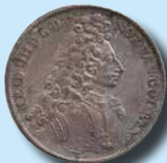
Danmark. 1 speciedaler 1704 47.100:-