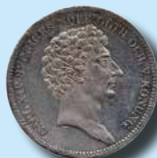
1 riksdaler 1827 "TROYSKA ASS" 32.600:-