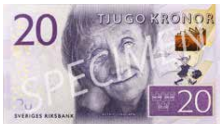
20 kronor: Astrid Lindgren – Småland. 66x120 mm.