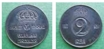
2a och b. År 1951, inför Gustav VI Adolfs första myntemissioner, präglades bl.a. detta provmynt om 2 öre i blåanlöp järn (SM 195). Jämför metall och ytbehandling med Gustav V:s järnmynt från 1940-talet på bild 1a och b.

Av innehållet i mappen kan man också utläsa att Kungl. Mynt- och justeringsverket köpte järnband av Domnarvet för sin produktion av järnskilljemynt till Sveriges Riksbank under åren 1948–1950. Man köpte band av tre tjocklekar avsedda för respektive 5 öre (1,58 mm), 2 öre (1,38 mm) och 1 öre (1,18 mm). Bredderna var 59, 66 respektive 67 mm. Ban-