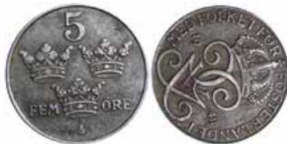
Gustav V. 5 öre 1948. Järn. Vriden 80 grader.