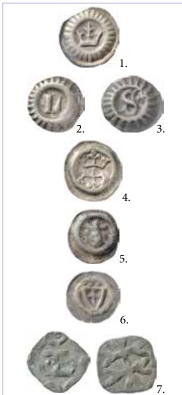
5:1–7. Mynt ur Fynd I (läderpungen). 1–3. Magnus Eriksson. Penning med krona, L och S. LL XXVIII:2–4, ca 1354–1360. 4. Penning med två motställda kronor. LL XXIX:4, ca 1360–1364. 5. Penning med krönt huvud. Malmer KrH Åla, ca 1300–1325. 6. Tyska orden. korssköld. Paszkiewicz 2007 fig. 8, ca 1307–1318. 7. Skåne under Sverige, 1332–1360.