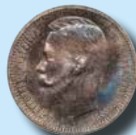
Ryssland. 1 rubel 1913 Proof 266.200:-

Bättre mynt och hela samlingar mottages till höstens myntauktion.