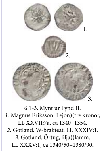
6:1–3. Mynt ur Fynd II. 1. Magnus Eriksson. Lejon(tre kronor, LL XXVII:7a, ca 1340–1354). 2. Gotland. W-brakteat. LL XXXIV:1. 3. Gotland. Örtug, lilja(lamm). LL XXXV:1, ca 1340/50–1380/90.