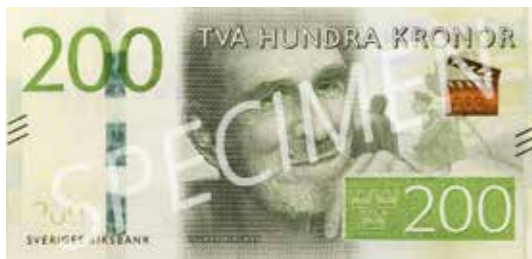
Helt ny är 200-kronorssedeln: Ingmar Bergman – Gotland. 66x140 mm.

* Se även artiklarna i SNT 2012:7 s. 162–163 och 2014:6 s. 136–137.