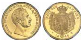
2. Oscar I. 1 dukat 1844.