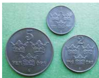
1a och b. Svenska skiljemynt av blåanlöp järn från efterkrigstidens 1940-tal.

gav myntplattorna en speciell kulör på kemisk väg. Jämför till exempel med våra svenska blåanlöpta järnmynt från 1940-talet. Det är förstas omöjligt att veta vilken ytbehandling eller färgning som de danska myntplattorna skulle underkastas. Men mycket talar för att de skulle få samma karaktäristiska blåsvarta utseende som de som Kungl. Mynt- och justeringsverket präglat och levererat till Sveriges Riksbank, se bild 1 . Till yttermera visso hade man året innan, 1951, tagit fram en provmyntstyp om 2 öres valör i samma blåanlöpta järn som 1940-talets, jämför bild 2 på nästa sida.