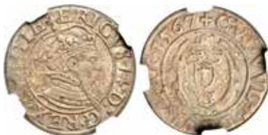
3. Erik XIV. Stockholm. 2 öre 1567.

(SM 55) inropades för $5.288 och $5.581. Karl XII:s 2-daler 1718 (SM 171) och Fredrik I:s Husådaler 1748 (SM 308) auktionerades för samma pris, $4.406.