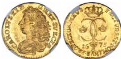
1. Karl XI. Stockholm. 1 dukat 1675.

Näst dyrast blev Karl XII:s rara 2-daler 1716 av kanonmetall (SM 201) som såldes för $11.163. Karl XI:s sällsynta ½-daler 1683 (SM 321) klubbades för $7.638, medan Karl X Gustavs daler 1658 (SM 54) och 1659