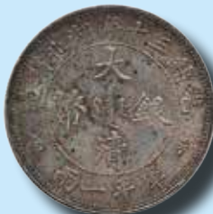
Kina. Hupeh Prov. tael30 (1904) 67.700:-