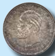
Norge. 2 kroner 1888 84.700:-