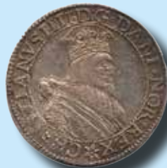
Norge. 1 speciedaler 1628 151.200:-