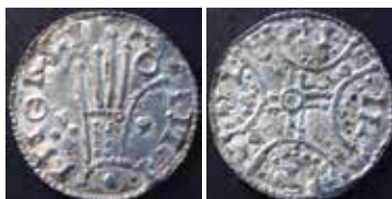
Svend Estridsen (1047-1074), penning, Roskilde, type Hauberg 40.