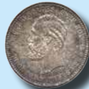
Norge. 2 kroner 1888 84.700:-