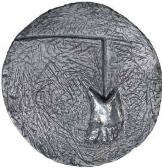
5. Elementary Road Sign. Bly. Diam 79 mm. Konstnär: Christian Wirsén.