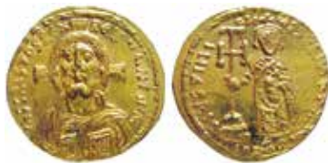
Solidus utgiven av Justinianus II 692- 695 e.Kr. Diam 20 mm. Detta mynt är det första som präglats med en bild föreställande Kristus.