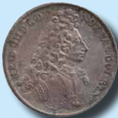
Danmark. 1 speciedaler 1704 47.100:-