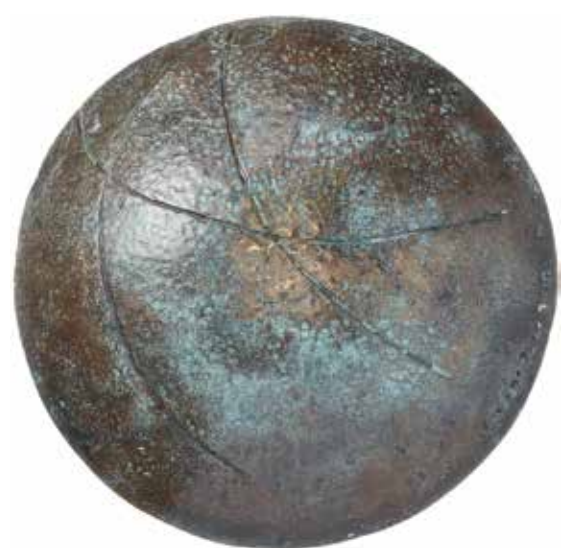
4a-b. Mother's Day. Brons. Diam 104 mm. Konstnär: Joze Strazar Kiyohara.