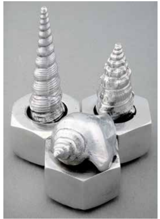
6. Spiral Tribute 1, 2, 3. Aluminium. Bredd 69 mm. Konstnär: Håkan Bull.

lis, trakiska Pulpudeva och romarnas Thrimontium för dess omgivande kullar, till att på 1400-talet få sitt nuvarande namn. I dess grön-gula stadsvapen ser man kullarna med floden Maritsa nedanför.