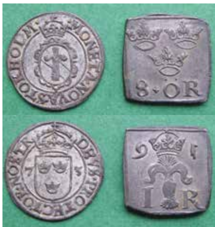
Starkt kopparhaltiga silvermynt från Johan III:s två inflationsperioder på 1570- och 1590-talen med från vitsjudningen delvis bevarad silvervryta. Åt- och fränsida av 2 öre 1573 (SM 65a) och 8 öre klipping 1591 (SM 137).

Mynt med så här låga silverhalter är ju egentligen att betrakta som kopparmynt med minimal silverinblandning. För att lyckas prångla ut och få mynten accepterade av menige man gällde det därför att locka fram det bästa ur mynten – det vill säga silvret! Detta åstadkoms genom en kemisk metod som brukar kallas vitsjudning . Begreppet är känt i numismatiska sammanhang i Norden, bland annat genom notiser och artiklar av Peter Flensburg 2 och Bengt