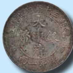
Kina. Hupeh Prov. tael30 (1904) 67.700:-