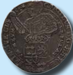
1 daler 1601 26.600:-

Ett urval mynt (inklusive köparprovision) som vi har sålt tidigare: