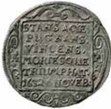
5. ¼ riksdaler (1634).