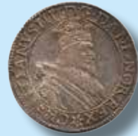
Norge. 1 speciedaler 1628