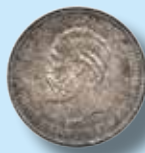
Norge. 2 kroner 1888