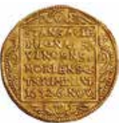
3. Dukater (1634).