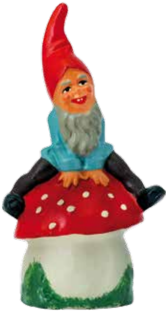
Tomten som sparbössa kom vid 1800-talets slut. Den här är av keramik och tillverkad i Tyskland. KMK.

Spardjur av olika slag förekommer i de flesta länder. I Polen till exempel gäller ekornen, i Portugal tuppen, i Indien är elefanten en viktig sparsymbol och i Peru laman. I dag finns de flesta djur i sparbössornas fauna. Lustiga sparbössor har skapats för att uppmuntra barn till sparande. Omtyckta husdjur som katter, hundar och kani­ner i form av sparbössor vänder sig också i första hand till barn.