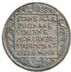
1. ½ riksdaler (1634).