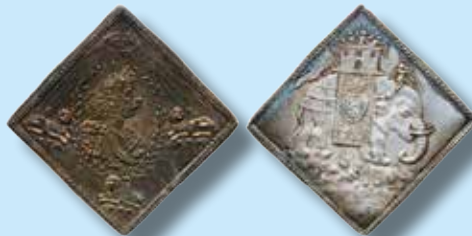
Danmark. Medalj Christian V

Bättre mynt och hela samlingar mottages till vårens myntauktion.