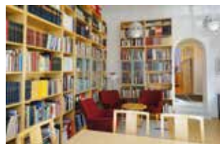
Julfest med auktion i SNF:s trevliga lokaler onsdag 3/12