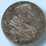
Norge. ½ speciedaler 1693