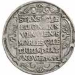
6. ¼ riksdaler (1634).