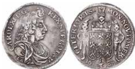
3. Karl XI, Stettin, 1/3 taler 1689. SB 140a.