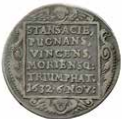
2. ½ riksdaler (1634).