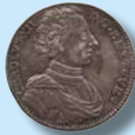
1 riksdaler 1713 Smala lejon