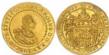
1. Karl XI, Stettin, 2 dukater 1661. SB 49.

Även andra R-mynt ingick, som objekt 2190, 1/3 taler 1674 (SB 130), objekt 2198, 1/24 taler 1675 (SB 170) och objekt 2205-2206, 1/96 taler 1673 och 1684 (SB 197 och 199).