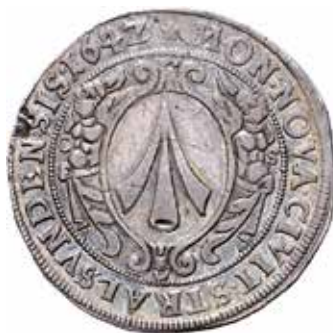
7. Kristina, Stralsund, taler 1642. SB 9.