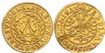
5. Karl X Gustav, Stralsund, dukat 1655. SB 34b.