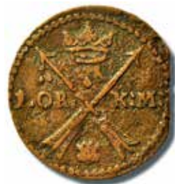
3. Karl XI, Avesta, 1 öre km 1662. Diam 34 mm, vikt 17,1 gram.

Ersättningen för 12 tunnor träkol (= 1 läst) var 120 mynt i denna valör.