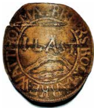
2. Pollett gällande 1 läst kol, Wattholma bruk, näver, 1670-talet. Diam 31,5 mm, vikt 0,79 gram.