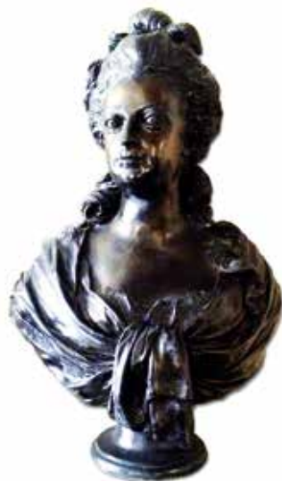
Byst av drottning Lovisa Ulrika skulpterad av Johan Tobias Sergel (1740-1814).