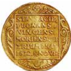
4. 2 dukater (1634).