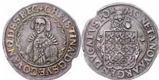
2. Kristina, Stettin, ½ taler 1641. SB 21.