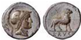
Ett av mynten ur drottningens gåva till Uppsala universitets myntkabinett.