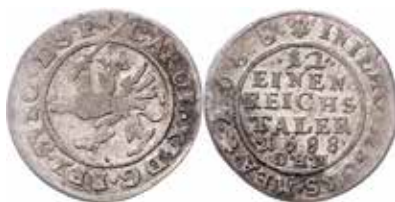
4. Karl XI, Stettin, 1/12 taler 1688. SB 147b.