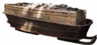
1. En påbyggd kolryssa, så kallad storstig . Siljansfors skogsmuseum, Mora. Mängden träkol i denna storstig betalades med två polletter.

Men antagligen användes polletten för inköp av något nyttigare eller för betalning av arrende.