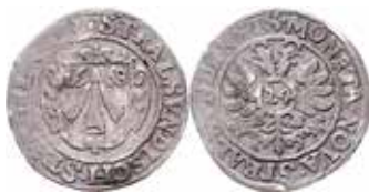
8. Karl XI, Stralsund, 1/24 taler 1668. SB 72.