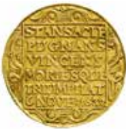
8. Dukat med årtalet 1634 på åtsidan.