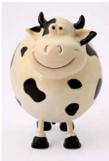
En humoristiskt utförd glad sparbössekossa. Plast. 1970-tal.

igenom på 1900-talet började deras karaktärer introduceras i sparbössornas värld. I dag finner man allt från amerikanska Kalle Anka, Musse Pigg och Snobben till belgiska Tintin,