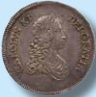
8 mark 1670

Ett urval av mynt som vi har sålt tidigare: