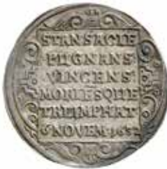
7. ¼ riksdaler (1634).