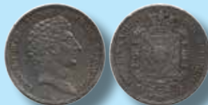
1 riksdaler 1827 "TROYSKA A55" 35.000:-