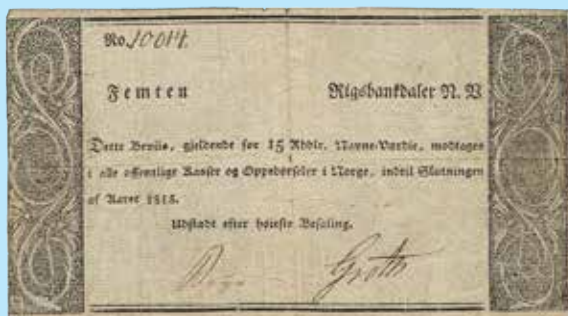
Norge. 15 rigsbankdaler (Prinssedel) 187.000:-