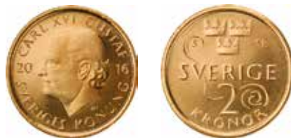
Tvåkronan blir den nya valören i den kommande mynten 2016. Bilden ovan visar den konstnärliga utgångspunkten för hela myntserien.

Det är Riksbanken som beslutar om utformningen av mynt och sedlar enligt lag (1988:1385) om Sveriges riksbank. Det formella beslutet om mynten och sedlarnas utformning fattades av riksbanksfullmäktige den 20 december förra året. Besluten gäller utformningen av sex nya sedlar varav en helt ny valör på 200 kronor samt tre nya mynt. Föreskrifterna om de nya mynten och sedlarna träder i kraft den 1 januari 2015 men ska enligt övergångsbestämmelserna inte börja tillämpas förrän 1 oktober 2015 vad gäller vissa sedlar och den 1 oktober 2016 vad avser övriga sedlar och mynt.