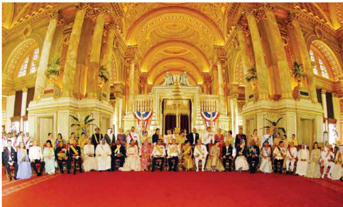
Från festligheterna i Bangkok i juni 2006. De kungliga gästerna. I mitten kung Bhumibol och drottning Sirikit. På deras vänstra sida ses svenska kungaparet.