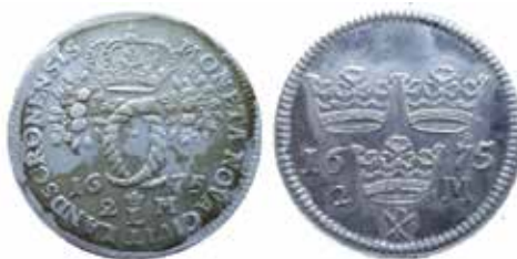
Frånsidor på tvåmarken från Landskrona.