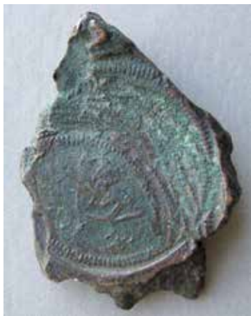
1a-b. Kopparstycke med på ena sidan en prägel av åtsidan till 2 öre sm från Adolf Fredriks regering. Baksidan utan prägning. Längsta bredd är 56 mm.