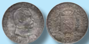
Norge. 1 speciedaler 1861 med "B" 2.238.000:-