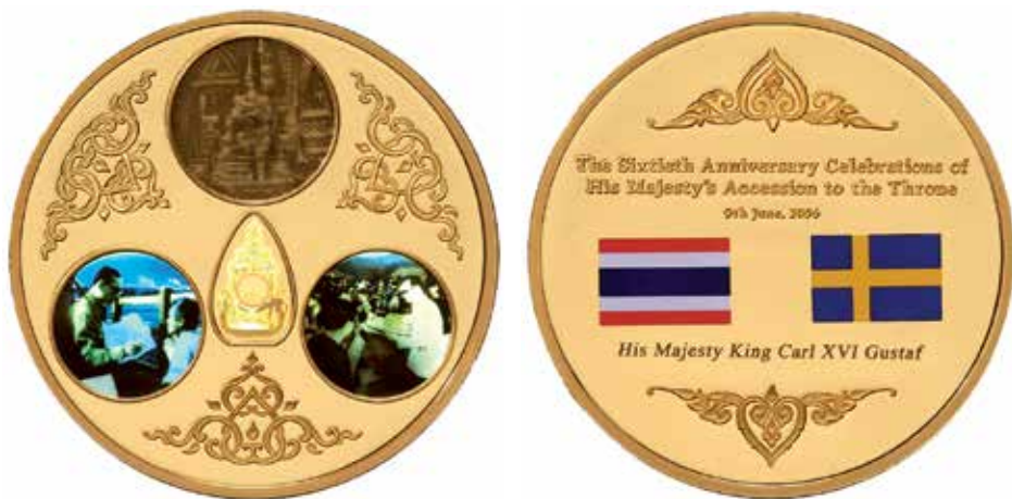
Firandet av kungens av Thailand sextioåriga regeringsjubileum 2006 i Bangkok. Medalj överlämnad av denne till H. M. Konung Carl XVI Gustaf vid festligheterna. H. M. Konungens samling. Guld och emalj. Diameter 60 mm. Konstnär: Chatinun Jivaluk.