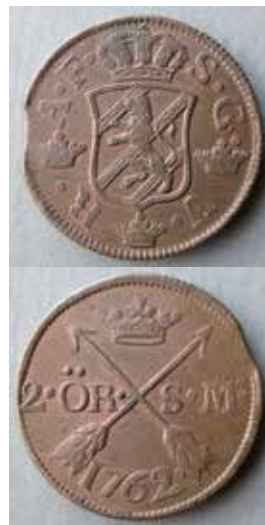
3a-b. Åt- och frånsida till kopparskiljemyntet 2 öre sm präglat vid Avesta myntverk år 1762.