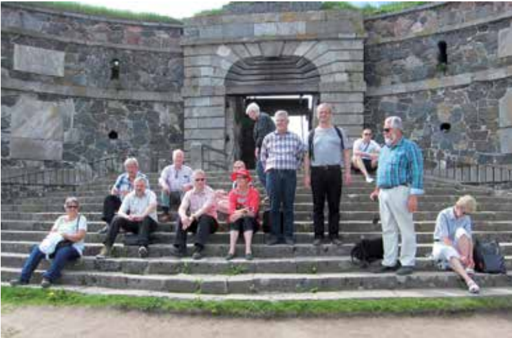
Mötesdeltagare vid Kungsporten på Sveaborg.