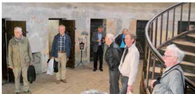
På besök i den gamla fängelsehålan på Citadellet.

SM = Ahlström, B. m.fl.: Sveriges mynt 1521-1977 . Stockholm 1976.