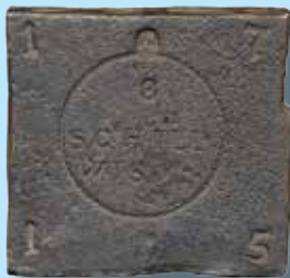
Wismar 8 Schilling 1715. Plåtmynt 90.000:-