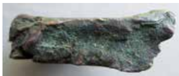
2a-b. Kopparstyckets kant med respektive utan brottkaraktär.