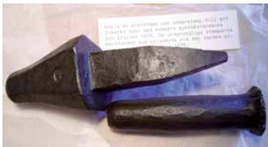
Kopior av originalstamparna till 2-marksmyntet 1675 i Landskrona. Originalen finns på det Kongliga Myntet i Köpenhamn.

trerättersmeny bestående av lax- och skaldjurs-ballotine med örtsallad och citrusreduktion, helstekt oxfilé med tryffelsky och örtkryddade primörer samt fransk chokladkaka med espressosirap och bär-coulis. För många avslutades inte lördagen med den gemensamma middagen, mynt diskuterades långt in på småtimmarna på Hotell Lundia.