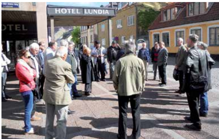
Årsmötesdeltagare samlade utanför Hotell Lundia.

Lunch avnjöts på Kulturkrogens uteservering innan nästa programpunkt, Kulturen i Lund, förevisades. Efter Skansen i Stockholm är Kulturen världens äldsta friluftsmuseum. Ett besök som tyvärr en handfull SNF:are var tvungna att avbryta i förtid för att hinna ställa ordning till auktionen.