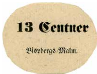
Papperspollett från Bispsbergs gruva i Dalarna. Viktvalörerna var 13, 14, 16, 18 och 19 centner och användes vid kontroll av malmleveranser. Tom baksida. Cirka 67 x 51 mm. SKANNAD AV MGL.

Under 1800-talet började man använda sig av nitroglycerin vid brytningen. Ett dubbelt gruvspel anlades