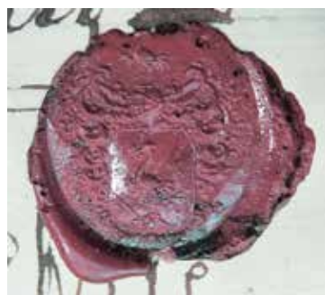
Claes Grills sigill.