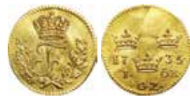
1. Fredrik I, Stockholm, ½ dukat 1735. Präglad på 1-öresstamp. GZ = myntmästare Georg Zedritz. SM 45.