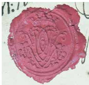
Gustaf Kiermans sigill.

Dessa dystra personöden bär vittnesbörd om såväl viktiga finanspolitiska förhållanden vid mitten av 1700-talet som det hårda politiska klimatet under den period som kallas frihetstiden.