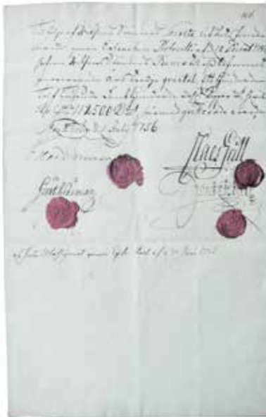
Kvittens år 1756. Hela dokumentet.

Til följe af Riksens Ständers Secrete Utskots förordnande, genom Extractum Protocolli af d 12 Decemb: 1747, hafwer Riksens Ständers Banco til oss lefwererat innewarande års tredje quartal, Ett Hundrade Tolf Tusende Femhundra Dall. Koppar mt, hwilka Dr 112500 K mt härmed qvitterade warder. Stockholm d. 5 Julij 1756.