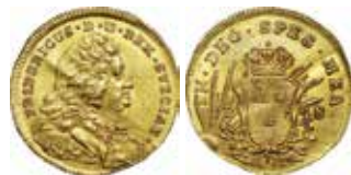
2. Fredrik I, Stockholm, dukat 1748 (omgraverad från 1747). HM = myntmästare Hans Malmberg. SM 39.