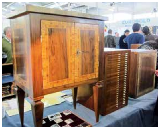
Några av Zecchis smakfulla myntskåp/lådor.