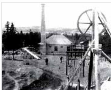
Cornelii maskinhus år 1895. Nederst ses Cornelii schakt.