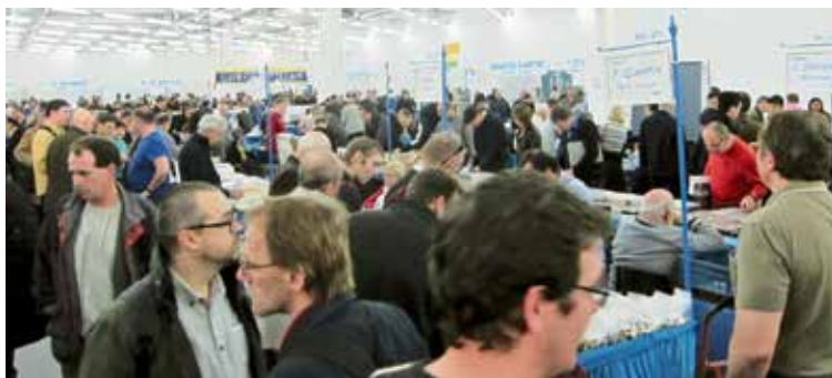
Översiktsbild från en del av myntmässan i München 2014.

München-mässan presenteras av mässarrangörerna som The largest