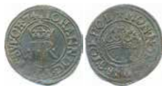
Johan III, Stockholm, ½ öre 1574. Åtsida: IOHANN D G 3 REX SVECE 74