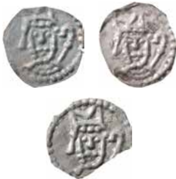
6. Påträffade i en grav på Blidsbergs kyrkogård år 1956. Vikt 0,27, 0,28 och 0,11 g. Ögonbrynen är markerade. Variant B.