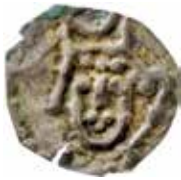
1. Påträffat i ett större skattfynd innehållande medeltida mynt och annat silver år 1739 i Kockhem, strax utanför Skara. Vikt 0,23 g. Variant A.