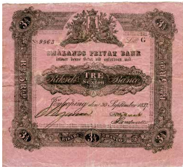
3 riksdaler 16 skillingar banko / 5 riksdaler riksgälds 1837. Ca 160 x 147 mm.