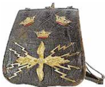
Exempel på blixtnippets användning som emblem i Wendes artilleriregemente.