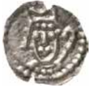
2. Påträffat i Kestads kyrka, Västergötland, år 1936, där även andra medeltida mynt framkommit. Vikt 0,24 g. Variant A.