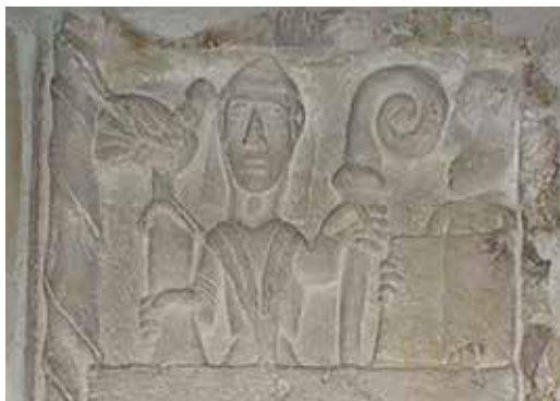
8. Domkyrkan i Skara invigdes vid 1100-talets mitt. En av dess tre stenreliefer från ungefär samma tid visar biskopen i mitra och hängande band. I sin vänstra hand håller han biskopsstaven.

Biskopen är huvudman för ett stift. Till tecken på biskopens värdighet bär han bland annat mitra och kräkla. Mitran är en huvudbonad som biskopen ska använda vid högtidliga