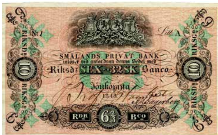
6 riksdaler 32 skillingar banko / 10 riksdaler riksgälds 1848. Ca 145 x 90 mm.