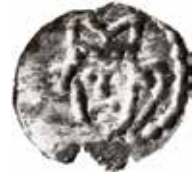
7. Påträffat invid domkyrkogårdsmuren på Södra Kyrkogatan i Skara år 1978. Mitran har annat utseende än andra kända mynt av denna typ. Vikt 0,24 g. Variant C.

stampvarianter, utan (A) och med (B) markerade ögonbryn.