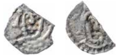
3-4. Påträffade i Nedre Ulleruds kyrka i Värmland år 1949, där även ett flertal andra medeltida mynt framkom. Vikt 0,12 och 0,16 g. Mitran har tyvärr fallit bort på båda mynten, men det till höger tycks ha en helt annorlunda pärlring än de andra biskopsmynten, Variant D.