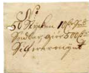
Handskrivna sedlar, 1700-tal.