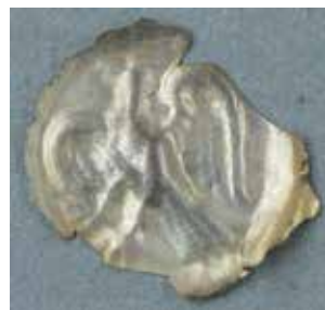
Svealandspenning med kungsörn.

Vid samma undersökning som det funna kungsörnsmyntet i Leksands