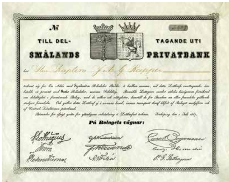
Aktiebrev 1847 gällande Smålands privatbank. Ca 261 x 206 mm.