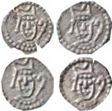
5. Påträffade i en grav på Blidsbergs kyrkogård år 1956. Vikt 0,17, 0,23, 0,20 och 0,22 g. Utan markerade ögonbryn. Variant A.