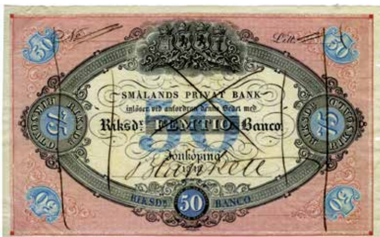
Provblankett om 50 riksdaler banko / 75 riksdaler riksgälds 1848. Ca 186 x 115 mm.

erbjudandet och man tillät till och med personer som bodde i Blekinge (!) att köpa aktier i bolaget.