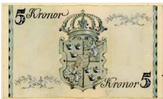
Sedelförslagen av Akke Kumlien är daterade. Överst från vänster: odaterad men inkommen till Riksbanken 5 augusti 1940, 3 mars 1941, 15 maj 1941 samt 21 september 1941.