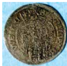
Gustav I. Stockholm. 1 öre 1528 med vase respektive G.