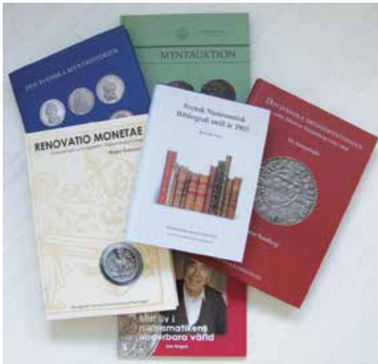
En del av SNF:s bokproduktion de senaste femton åren.