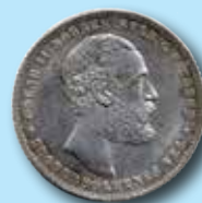
Norge 1/2 speciedaler 1873 181.000:-

Bättre mynt och hela samlingar mottages till vårens myntauktion.