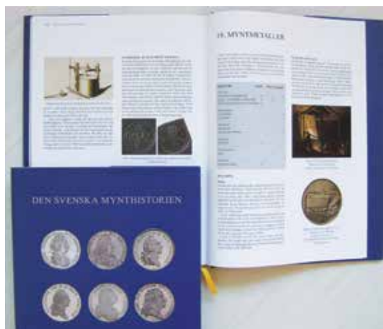
Den första volymen av Den svenska mynthistorien , Frihetstiden och den gustavianska perioden 1719-1818 , gavs ut år 2007.