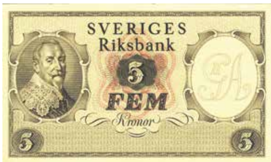
Hur Akke Kumliens förslag till ny femkronorssedel 1941 ....