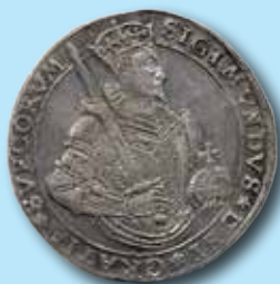
1 daler 1594 "SIGIMVNDVS" 677.000:-