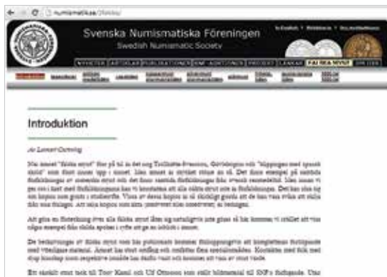
Startmenyn med menypunkten Falska mynt på föreningens hemsida anno 2013.