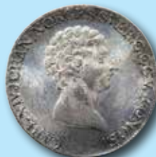
Norge 1 speciedaler 1824 57.000:-