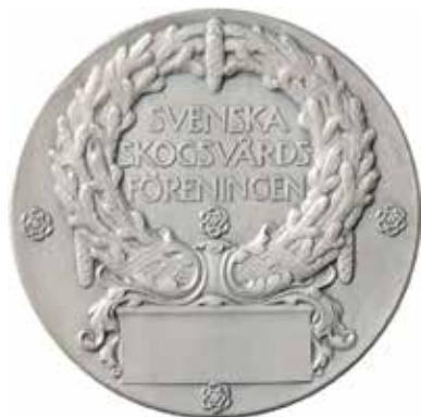
Svenska Skogsvårdsföreningens förtjänstmedalj. 1927.