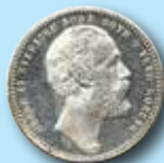
1 riksdaler riksmünt 1873 39.000:-