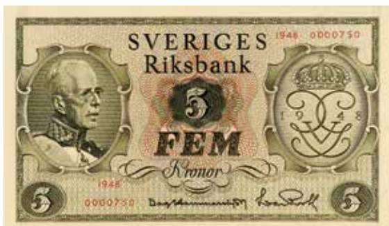
... blev Gustav V:s jubileumssedel 1948.