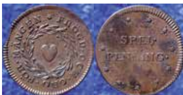
★ FRÖGD OCH ORO FÖR MÅNGEN / SPELPENNING Holst 153.