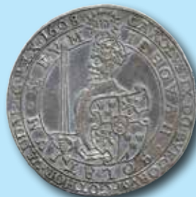
8 mark 1608 81.000:-