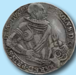
1 daler 1598 106.000:-