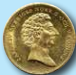
4 dukater 1843 68.000:-