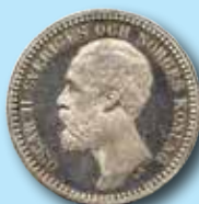
2 kr 1878 "OCH" 84.000:-