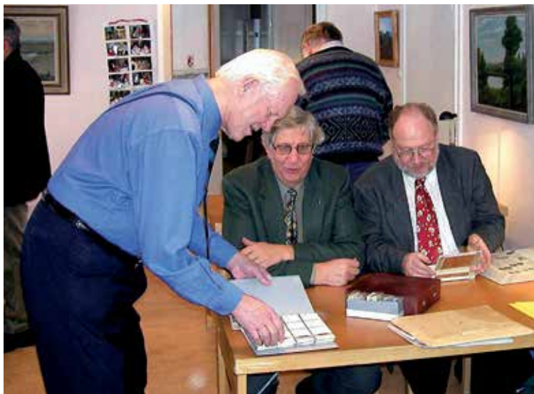
Tre ordföranden i succession.

Inledningsvis var medlemsantalet inte så stort genom att mötena endast hölls dagtid (för pensionärerna!), men