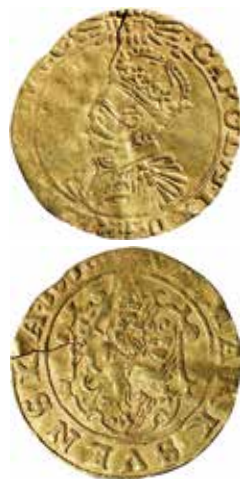
2a-b. Åt- och fränsida av Göteborgs 6 mark guld 1610. Troligen ur Elias Brenners samling. Naturlig storlek ca 20 mm.