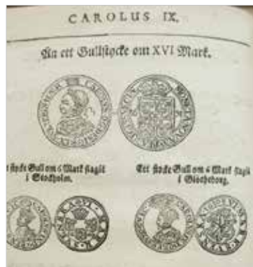
2c. Träsnittsillustration av Elias Brenners exemplar av Göteborgs 6 mark guld 1610. Ur Thesaurus Nummorum 1691.