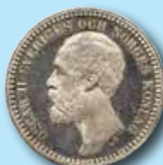
2 kr 1878 "OCH" 84.000:-