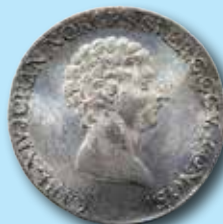
Norge 1 speciedaler 1824 57.000:-