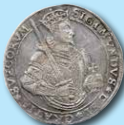
1 daler 1594 "SIGIMVNDVS" 677.000:-