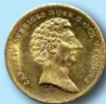
4 dukater 1843 68.000:-