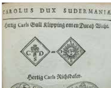
1c. Träsnittsillustration av Elias Brenners exemplar av 8 mark guldklipping 1598 hämtad ur Thesaurus Nummorum 1691.