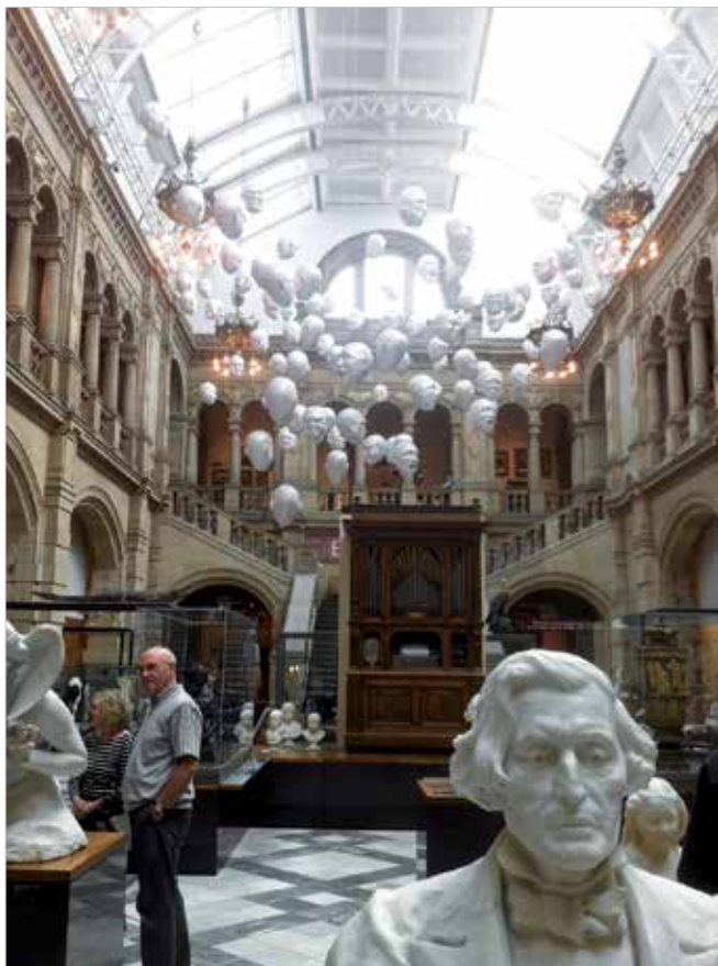
The Hunterians pampiga entréhall bjöd bland annat på dessa svävande huvuden.