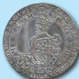
8 mark 1608 81.000:-