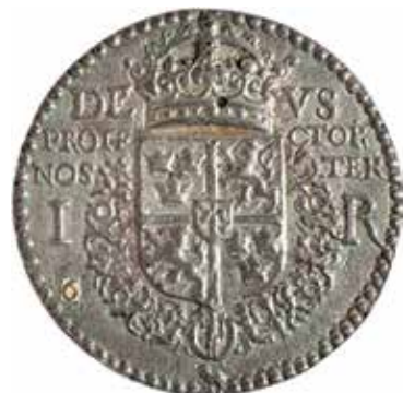
3a-b. Åt- och frånsida av medalj över Johan III:s och Katarina Jagellonicas kröning i Uppsala domkyrka den 10 juli 1569. Originalgjutning i silver. Naturlig storlek ca 41 mm.

att få veta, ej heller var övriga mynt ur den svenska samlingen nu finnes. Det är emellertid – trots dessa osäkra data – författarens bestämda uppfattning, att vi här har en del av den Brennerska samlingen" .