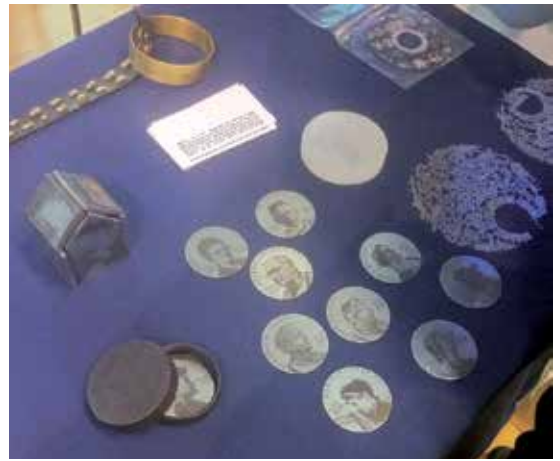
Exempel på holländsk medaljkonst visades på medaljmarknaden under konferensens sista dag.