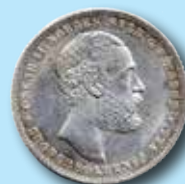
Norge 1/2 speciedaler 1873 181.000:-

Bättre mynt och hela samlingar mottages till höstens myntauktion.