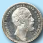
1 riksdaler riksmünt 1873 39.000:-