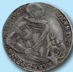
1 daler 1598 106.000:-