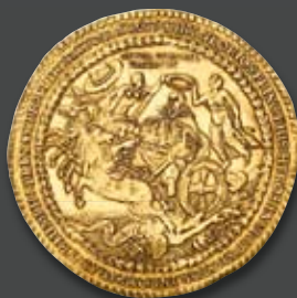
Wolgast Under Sweden. Gustav II. Adolf, 1631–1632. 20 Ducats 1633. Extremely rare. Attractive specimen.