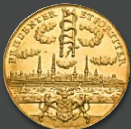
Riga Under Sweden. Karl X. Gustav, 1654–1660. Golden Medaillon of 100 Ducats (1655). Extremely rare. Extremely fine – uncirculated.