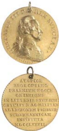
2. Södermanlands regementes militärakademis belöningsmedalj i guld. Exemplaret tilldelat S. Hederstierna år 1788. Privat ägo.

Låt oss göra en något förenklad beskrivning av medaljen (fig. 2) efter Hildebrand 1875 (nr 116):