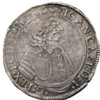
KRAKOW. Taler 1649.

Katalogen beställs genom insättning av 190 kr på bg 399-0090.