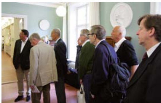
SFHV-medlemmar på besök i Kungl. Myntkabinettet.

Den svenska aktiedokumentssamlingen torde tillhöra den fylligaste och mest allsidiga källan till vår kunskap om dessa ekonomiska dokument utveckling, grafiska tekniker och utgivarnas bakgrund. Ur särskilt ändamålsenliga skåp liknande arkiv för kartor drogs underhand fram exempel på världsberömda aktiebrev, till vilka naturligtvis räknas handelskompaniernas samt Kreugers aktiebrev med flera. Motivaktier är populära bland samlare och de tidigaste järnvägsaktierna från 1850-talet tilldrog sig berättigat intresse och ledde också till en diskussion om exakt när det första järnvägsaktiebrevet är utgivet. Denna definitionsfråga lär följas upp.