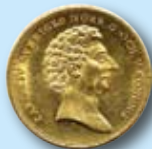
4 dukater 1843 68.000:-