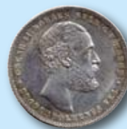
Norge 1/2 speciedaler 1873 181.000:-

Bättre mynt och hela samlingar mottages till vårens kvalitetsauktion.