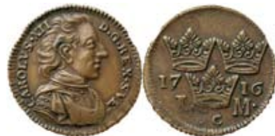
Nr 1002. Karl XII. Stockholm. 1 mark 1716. Provmynt i koppar.