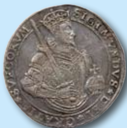
1 daler 1594 "SIGIMVNDVS" 677.000:-

Några mynt vi har sålt tidigare: (inklusive köparprovision)