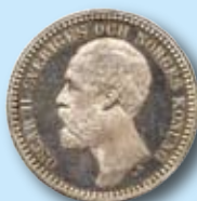
2 kr 1878 "OCH" 84.000:-