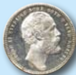
1 riksdaler riksmynt 1873 39.000:-