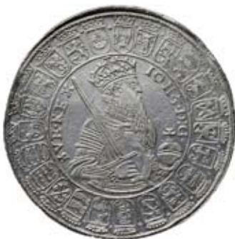
VADSTENA. 2 daler u. å.