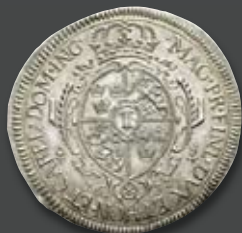
Erfurt Under Sweden. Gustav II. Adolf, 1631–1632. Reichstaler 1632. Extremely rare. The only specimen in private ownership. Extremely fine.