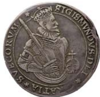
STOCKHOLM. Daler 1594.