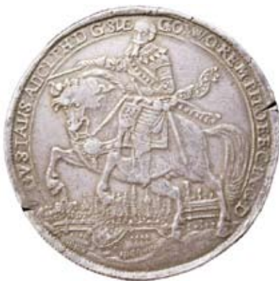
Nr 699. Gustav II Adolf. Stockholm. 2 riksdaler 1633. Åtsida.

MISAB har sedan den första auktionen (Frösell) skämt bort medeltidssamlare med många och trevliga mynt, så även vid denna auktion. Bäst betalt blev det för: nr 552, penning, Olof Skötkonung (SMH 225), 1/1+