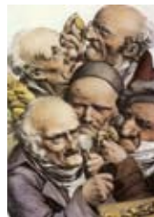
Numismatiska afnar 29/2 och 28/3.

5-6 SNF:s årsmöte i Mariefred (Gripsholms slott) Ett utförligt program meddelas på sid. 18 i denna tidskrift samt på hemsidan www.numismatik.se