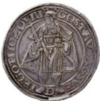
STOCKHOLM. Daler 1534.

Restaurang Garnisonen, Stockholm 10 mars 2012