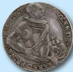
1 daler 1598 106.000:-