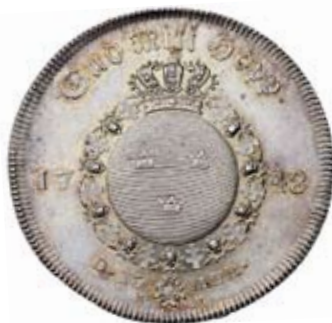
STOCKHOLM. Serafimerriksdaler 1748.