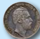
50 öre 1862 26.000:-