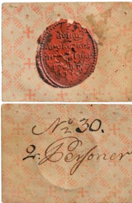
Papperspollett gällande inträde till Kungliga Djurgården för två personer år 1774.

bläck att biljetten har nummer 30 och gäller för två personer. Man kan därför anta att minst trettio sådana polletter tillverkades 1774. Stämpelns text lyder: