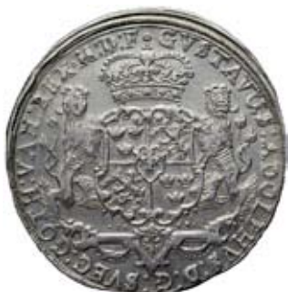
ELBING. 2 taler 1628.