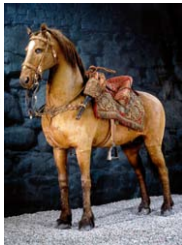
Streiff, Gustav II Adolfs häst, kan beskådas uppstoppad på Livrustkammaren i Stockholm.

Ett riktigt praktmynt, 2 riksdalern 1633 (nr 699) i kvalitet 1+ betalades