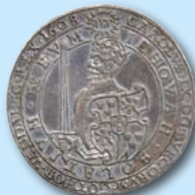
8 mark 1608 81.000:-