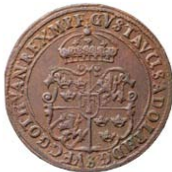
Nr 735. Gustav II Adolf. Nyköping. 1 öre 1627. Åtsida.