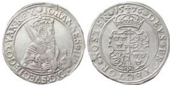
Nr 623. Johan III. Stockholm. 1/2 daler 1576.