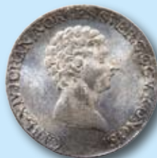
Norge 1 speciedaler 1824 57.000:-