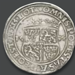
Kingdom of Sweden Gustav Vasa, 1521–1560. Daler 1534, Stockholm. Extremely rare. Attractive, very nice specimen.