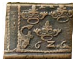
Nr 726. Gustav II Adolf. Säter. 1 öre. Valsverksprägla klipping. Åtsida.