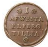
Nr 1032. Polletten berättigade till fri överfart över Dalälvsbron.

med moderata 40 000 kr (30 000). Myntet visar Gustav II Adolf till häst. Hästen är troligen kungens favorit Streiff, som var med kungen den ödesdigra dagen i Lützen 1632 och som då också träffades av fiendens kulor. Streiff avled året efter, blev uppstoppad och har sedan 1600-talet varit utställd i olika sammanhang. I dag finns kungens häst att beskåda på Livrustkammaren i Stockholm. Streiff pryder också Livrustkammarens logotype. Intressant ur numismatisk synvinkel är det pris kungen betalade för Streiff, 1 000 riksdaler. En enorm