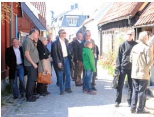
Husen på Klinton

Visborgs slott var en försvarsanläggning som började anläggas 1411. Enligt Visby-franciskanernas diarium Scriptores rerum svecicarum medii aevi var det kung Erik (av Pomern) själv som den 1 augusti 1411 lade grundstenen. När Erik förlorade kungamakten bosatte han sig i borgen. Vid freden i Brömsebro 1645 fick borgen svensk besättning. Borgen var då förfallen och inredningen förstörd av danskarna vid utrymningen. Vid det svensk-danska kriget 1676 anfördes Visby av en dansk flotta. Den sven-