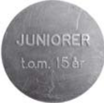
31. Pollett gällande Hellsfjäll. Mässing.