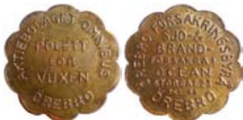
16. Transportpollett för en vuxen resenär gällande AB Omnibus i Örebro, Närke. På dess framsida ses reklam för Örebro försäkringsbyrå. Mässing.