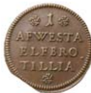
Pollett Avesta kopparverk. Såld för 5.000 kr.