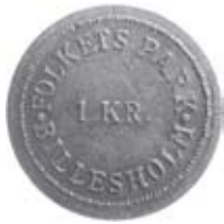
27. Spelpollett à 1 krona gällande i Billesholms Folkets Park, Skåne. Aluminium.