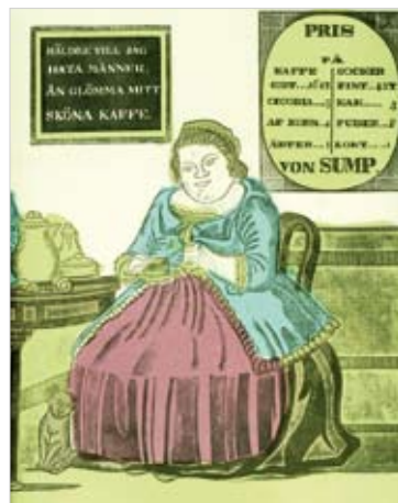
Del av träsnittstavla tryckt 1845 hos L. Gullbranssons i Varberg.