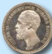
2 kr 1878 "OCH" 84.000,-