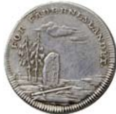
Belöningsmedaljen "Hederlige sår" Såld för 10.000 kr.