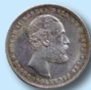
Norge 1/2 specie - daler 1873 181.000,-

Vi söker bättre mynt till vårens kvalitetsauktion. Kontakta oss för en förutsättningslös diskussion.