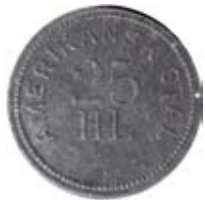
30. /Spel?/pollett à 25 HL. Amerikansk Stal. Zink.