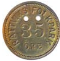
28. Spelpollett à 35 öre gällande i Rättviks Folkpark, Dalarna. Mässing.