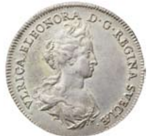
4 mark 1720. Såld för 72.000 kr.