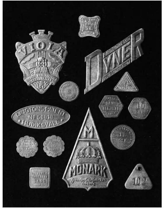
4. År 1927 deltog företaget i en utställning i Falun. Man hade fått i uppdrag att ta fram evenemangets utställningsnål, vilken såldes i flera tusen exemplar. Bilden visar företagets egen reklam under denna utställning.

banor var det stora folknöjet på denna tid och dansbanorna fanns lite överallt ute i den svenska naturen. Vid dansbanorna förr i tiden betalades en liten eller ingen entréavgift. Däremot fick de dansande betala, ofta i form av polletter, när de trädde in på dansgolvet. Polletten gällde per par och för två danser, oftast en snabbare låt och en lite långsammare. Därefter tömdes dansbanan på folk och ville man dansa på nytt fick man erlägga ny avgift. Det var alltid kavaljeren som bjöd upp och som stod för pollettköpet. Polletterna köptes ofta i en enkel pollettkiosk intill dansbanan. Danserna kunde anordnas av till exempel folkparker, idrottsföreningar och andra ideella organisationer. Fig. 8-10.