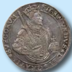
1 daler 1594 "SIGIMVNDVS" 677.000,-