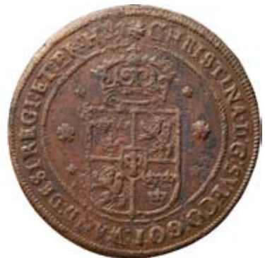
Öre 1638 utan voluter. Såld för 24.000 kr.

Myntauktioner i Sverige AB Banérgatan 17 - 115 22 Stockholm E-mail: info@myntauktioner.se - Telefon: 08-410 465 65 www.myntauktioner.se