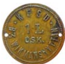
20. Pollett gällande 1 liter oskummad mjölk från Kooperativa Föreningen Södra Dalarna, Vikmanshyttan. Mässing.