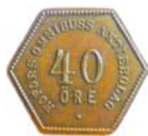
13-15. Transportpolletter à 20, 30 respektive 40 öre gällande Hofors Omnibuss AB i Gästrikland. Mässing.