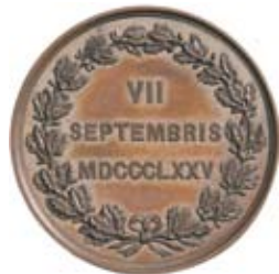
A: MUNIFICENTIA ET PIETATE POPULI, statyn över Karl XIV Johan ridande åt vänster (heraldiskt). G. LOOS D. E. WEIGAND F. i avskärningen. R: VII / SEPTEBRIS / MDCCCLXXV inom en ekkrans.