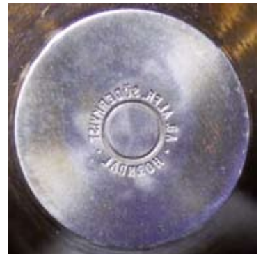
7. Söderkvists andra runda stämpel visad retrograd på en stämpel: •AB. ALFR. SÖDERKVIST• HORNDAL