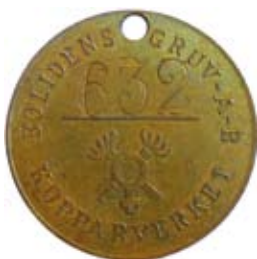
25. Löneutbetalningsbricka från Bolidens Gruv AB i Västerbotten. Mässing.