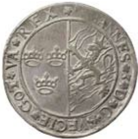
2 mark 1590. Såld för 72.000 kr.

På vår auktion 5 upplevde vi en stark efterfrågan med bra priser, nedan illustrerade med en del slutpriser (exklusive provision). 25-26 november har vi efter överenskommelse öppet på kontoret på Banérgatan 17 för inlämning.