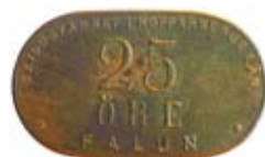
18. Pollett à 25 öre gällande Skyddsvärnet i Falun, Dalarna. Koppar.