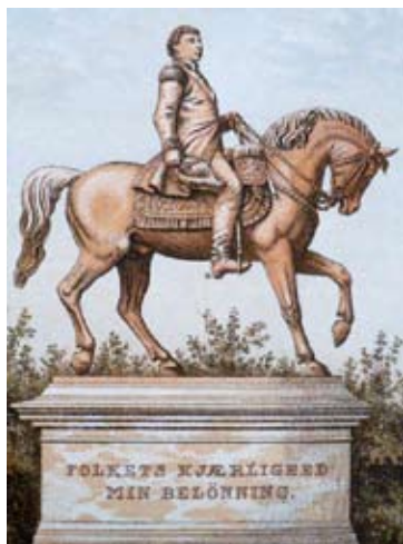
Ryttarstatyn i Oslo med Karl XIV Johan, rest 1875. UR SVEAKALENTERN 1876.

Den 7 SEPTEMBER 1875 – på 57-årsdagen efter Karl XIV Johans kröning i Trondheims domkyrka – skulle denna dag ryttarstatyn över honom avtäckas i Christiania (nuvarande Oslo) framför kungliga slottet, det hade Oscar II på förhand bestämt.*