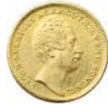
Dukat 1847. Såld för 21.000 kr.