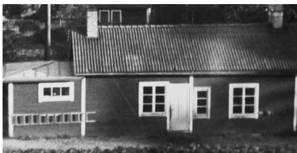
2. Äldsta fabriksbyggnaden. Här tillverkades stålstämpel, bronsstämpel och namnskyltar.

Söderkvists har använt minst två olika stämpel på sina polletter, här benämnda den runda respektive den raka stämpeln. Fig. 5-7. Men vissa av polletterna har ingen stämpel alls. Den raka stämpeln har jag enbart sett användas på de så kallade Skyddsvärnspolletterna. De allra flesta av