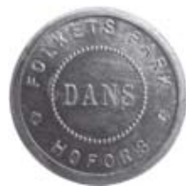
8. Danspollett från Hofors Folkets park i Gästrikland. Aluminium.