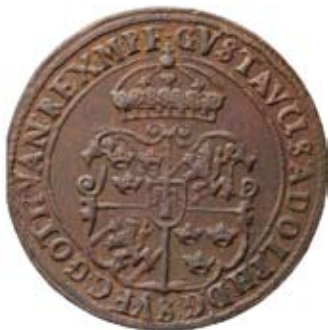
Öre 1627 med rak kronbotten. Såld för 27.000 kr.