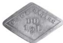
21. Pollett gällande ½ liter /mjölk/ hos Dala-Bagarn, Borlänge. Aluminium.