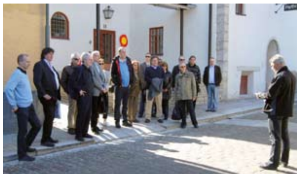
Lördagen inleddes med samling vid Fornsalen på Strandgatan 14 i Visby innerstad.