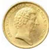
2 dukater 1839. Såld för 62.000 kr.