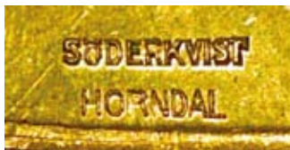
6. Söderkvists raka stämpel på två rader: SÖDERKVIST HORNDAL