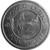
29. Piccololiften i Fornbyklint, Horndal, By socken i Dalarna. Polletten med dess fina avbildning av liften och skidbacken med stuga användes så sent som på 1980-talet. Aluminium.