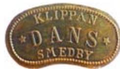
10. Danspollett från Klippans festplats i Smedby, Dala-Husby, i Dalarna. Mässing.