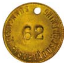
24. Inlämningsbricka för ytterplagg i Sunnsjö Fiskevårdsförening, Dalarna. Mässing.