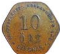
17. Pollett à 10 öre gällande Skyddsvärnet i Säfsnäs, Dalarna. Koppar.