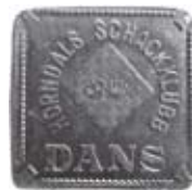
9. Danspollett från Horndals Schackklubb i Dalarna. Aluminium.