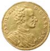
Dukat 1718. Såld för 60.000 kr.