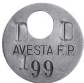
23. Inlämningsbricka för cykel i Avesta Folks Park, Dalarna. Aluminium.