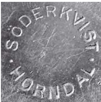
5. Söderkvists ena runda stämpel: •SÖDERKVIST• HORNDAL

Till att börja med producerade Söderkvists många danspolletter . Dans-