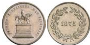
A: FOLKETS KJÆRLIGHED MIN BELÖNNING, statyn över Karl XIV Johan ridande åt vänster (heraldiskt). R: 1875, krans av ek- och lagerkvistar.

Upplagga: guld med krona i rött band 2 ex, silver 30 ex, förgylld brons 30 ex, brons 600 ex.