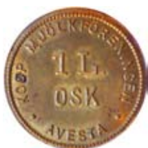
19. Pollett gällande 1 liter oskummad mjölk från Kooperativa Mjölföreningen Södra Dalarna, Avesta. Mässing.