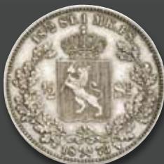
Kingdom Norway Oskar II., 1872–1905. 172 Speciedaler 1873, Kongsberg. Very rare. Extremely fine – uncirculated.