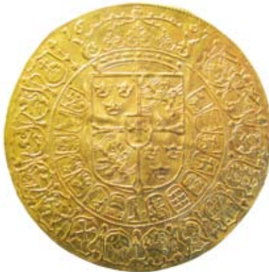
Karl IX. Stockholm, 64 mark 1607. KMK.

enligt 1604 års myntordning skulle väga 29,62 g, medan en riksdales rätta vikt var 29,25 g. Halterna skiljer sig dock; 820/1000 i det ena fallet och 875/1000 i det andra. Frågans lösning ligger i en haltundersökning. Intill dess att en dylik har genomförts får Menzinskys argument anses väga tungt.