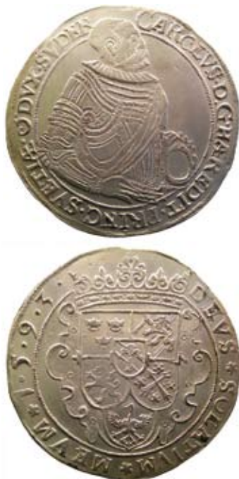
Hertig Karl. Stockholm, 1 daler 1593. KMK.