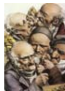
Numismatisk afton 29/9

18.00 Diskussionsafton. Tag med er ett numismatiskt ämne som ni vill ta upp till diskussion eller ett föremål som ni vill berätta om. Föreningen bjuder på enklare förtäring.