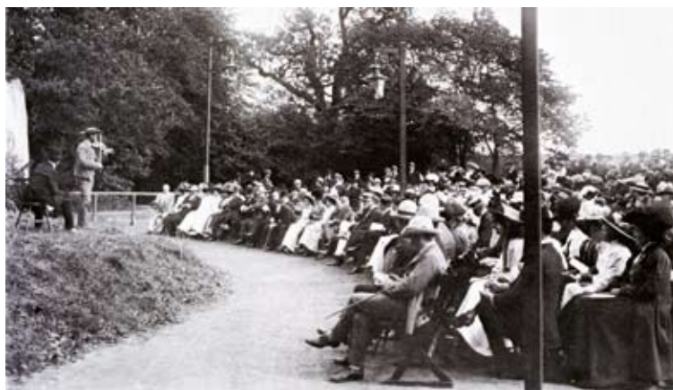
Uppspelning på Skansens friluftsteater i augusti 1910.

Den är ensidig och användes i valörerna 3:50, 2:50, 1:50 och 1 krona.