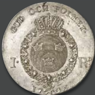
Kingdom Sweden Gustav IV. Adolf, 1792–1809. Riksdaler 1793, Stockholm. Very rare. Nearly uncirculated.