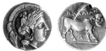
Didrachm från Nola i Kampanien slagen omkring 400 f.Kr. 6,81 g.

Åtsidan visar gudinnan Athena med sin ugglan på den lagerkransprydda hjälmen. Frånsidans tjur har ett människohuvud. Den anses av många representera en flodgud. Legendens Nolaion bör läsas som "Noliernas (mynt)". Under tjurens buk finns ett ligerat LE, som kan tänkas identifiera