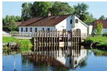
Strömsbergs järnbruk i Tolfta socken, Uppland. Bruket anlades av Welam Wervier år 1643 och nedlades så sent som 1920.

Polletten saknades i Svenssons annars så rika pollettsamling och vi får väl därför anta att den är sällsynt.