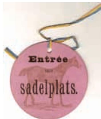
4. Biljett gällande sadelplats 1887 – troligen på Ladugårdsgården.

1. Personbiljett från Kapplöpningarne å Malmen den 11 Aug. 1877 . Biljetten, som är tillverkad av grönt papper, har svart text. 91x64 mm. Den kostade 50 öre och skulle användas på följande sätt enligt texten: Att för ordningens skull bäras synbarligen. Av denna anledning finns det en genombruten springa på biljetten som skulle göra det lättare att kunna fästa den på t.ex. en rockknapp.