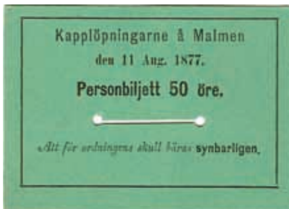
1. Personbiljett gällande kapplöpningarna på Malmen den 11 augusti 1877.

I mitten av 1880-talet framkastades tanken om att återuppta kapplöpningar på de gamla löpningsplatserna. År 1888 reds löpningar inte bara vid de flesta regementen utan också på offentliga banor i Stockholm och på Malmen vid Linköping. År 1889 bildades svenska "Jockeyklubben". Då hade redan "Skånska Fältrittklubben" bildats (1888). År 1900 tillkom "Stockholms Kapplöpningssällskap".