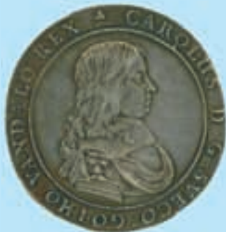
Riga 1 taler 1660 37.000:-