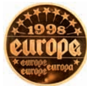
Medalj från 1998 över dåvarande statsministern Göran Persson. Medaljen är utgiven av Bayerisches Münzkontor och ingår i serien Die ersten Farb-Europa-Prägungen. Okänd konstnär.

minister Persson hade vid tiden något bredare ansikte vilket tillsammans med den på medaljen överdrivet höga pannan ger medaljen ett lätt idealiserat intryck. Dessvärre har jag inga uppgifter om varken gravör eller upplagesiffror.