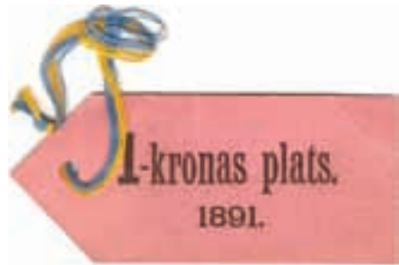
6. Biljett från någon hästkapplöpning 1891.