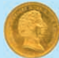
4 dukater 1838 44.000:-

Bättre mynt mottages regelbundet till våra auktioner.