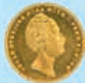
2 dukater 1857 29.000:-