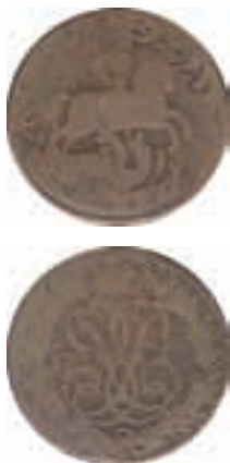
Rysk 1-kopek 1758 präglat på svenskt 1 öre sm 1746.

För vidare information: www.myntkabinettet.se tel: 08 519 553 04