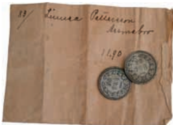
Linnéa Petterssons lönekuvert med dess innehåll; två femtioöringar från 1875 respektive 1898.

Lagerlista över svenska personmedaljer och numismatisk litteratur www.nordlindsmynt.se