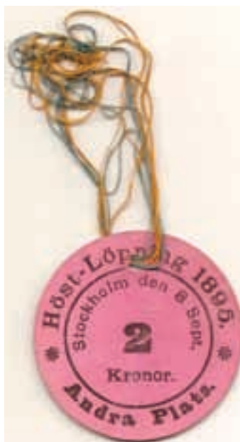
7. Biljett från Höstlöpningen i Stockholm 1895.

7. Biljett från Höstlöpningen 1895. Rosafärgat papper med svart text, rund. Diam 63 mm. Biljetten är hålslagen och ett blågult band finns