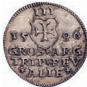
2. Reval under Sverige. Sigismund. 3 groschen 1596. Unik! Förstoring mot originalets 21,5 mm.

Förteckningen omfattar över 2.021 exemplar av främst baltiska och svensk-baltiska mynt, värderade till 18.000 kronor – ett betydande belopp som motsvarar drygt 280.000 kronor i dagens penningvärde.