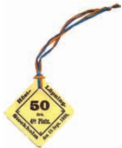
8. Biljett från Höstlöpningen i Stockholm 18 september 1898.