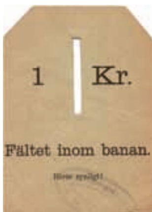
2. Biljett från Malmen från ca 1890.