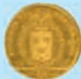
1 dukat 1810 Dalarna 43.000:-