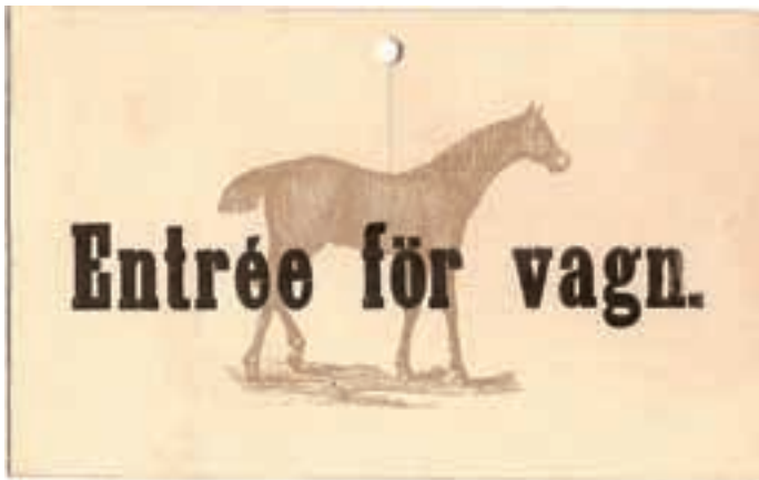
5. Biljett för den som önskade anlända till tävlingarna i vagn. 1880-talet?

2. Biljett från Malmen, olivgrönt papper med svart text samt genombruten springa för fästande på knapp. 88x65 mm. De två övre hörnen är "avklipp-ta". Text: 1 Kr. / Fältet inom banan / Bäres synligt! Längst ned finns en stämpel med stämpel med texten: Kapplöpningskommittén – Malmen.