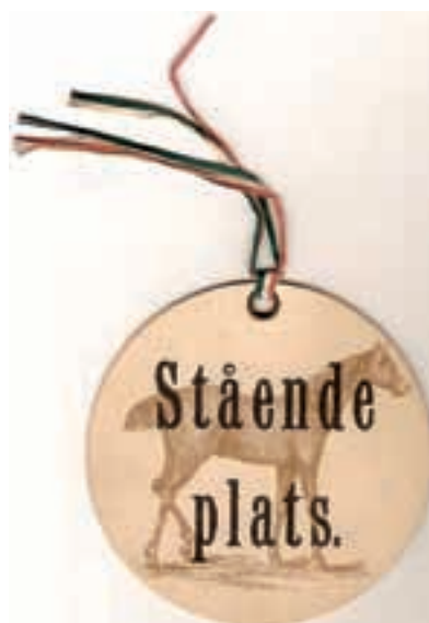
3. Biljett gällande "stående plats" på Ladugårdsgården 17 juli 1886.