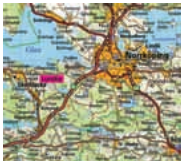
1. Fyndplatsen Lundby, Kullerstads socken, Östergötland, ligger omkring en mil väster om Norrköping.

Myntet visade sig vara en efterprägling av ett romerskt guldmynt, i vissa sammanhang kallat barbar. Ser man till vikten, 4,72 g med ögla, skulle det kunna vara en efterprägling av en solidus eller en aureus. Solidimyntet höll stadigt vikten 4,5 g. Aureusmynten däremot hade gått från 8 g under republiken till drygt 7 g i början av 200-talet e. Kr. och därefter kraftigt