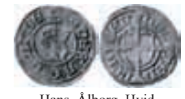
Hans. Ålborg. Hvid. Galster 36. 0,54 g.

Bilderna som ses här intill utgör ett urval av de mynt som påträffades i Maltorp och inlöstes. Fyndet har inv. nr SHM-KMK 5090 och 5108. De svartvita fotografierna som tagits av Jan-Eve Olsson, KMK, har retuscherats av författaren.