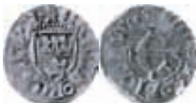
Erik av Pommern. Stockholm. Örtug. LL 3, efter 1405. 1,08 g.

Ur inventariet (SHM-KMK 5090): Större silfvermynt och små svenska och danska silfvermynt från 1400-talet. Inlöst med 8 riksdaler. Vikt, 9,5 ort [= 41 g].