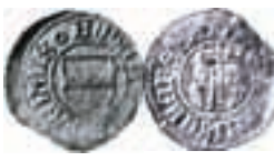
Gotland under Danmark. Hans. Visby. Hvid. LL 5, ca 1480-90-talen. 0,73 g.