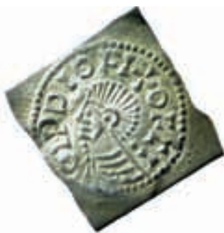
3. Åtsida slagen med stampen 4.272. Myntet kommer från ett gotländskt fynd från Sälle i Fröjel socken. Förstorat.

Givetvis ställer man sig frågan vilka relationer som fanns mellan Sig-