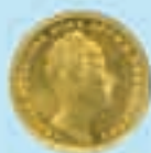
1 Dukat 1849