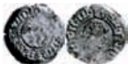
Hans. Bergen. Hvid. Skaare 297. 0,79 g.

Ur inventariet (SHM-KMK 5108): Något mer än 1.600 silfvermynt (svenska, gotländska, norska och några prov på danska) från 1400-talet. 210 st inlösta med 20 riksdaler. Vikt 36,5 ort [= 155 g].