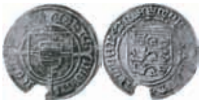
Hans. Köpenhamn. Skilling. Galster 32. 2,21 g.