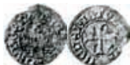
Hamburg. Dreiling. Jesse 529, ca 1468-92. 0,49 g.

Sten Sture d.ä. 1470-1497, 1501-1503 Från Sten Sture den äldres långa regeringstid finns endast ett mynt bland de inlösta mynten.