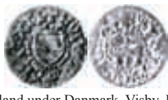
Gotland under Danmark. Visby. Hvid. LL 1, 1450-tal. 0,58 g.