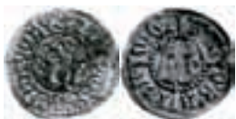
Hans. Nidaros. Hvid. Skaare 302. 0,69 g.