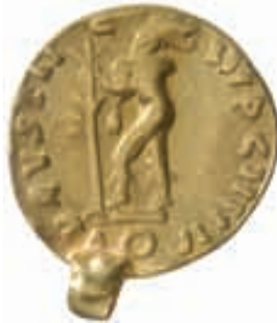
6. Frånsidan – Lundby-myntet. SHM-KMK inv.nr 7903. Skala 2:1.