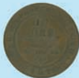
10 Öre Provmynt (1853-1854)

Bättre mynt mottages regelbundet till våra auktioner.