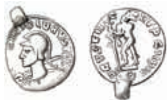
2. Salin publicerade fyndet från Lundby med en teckning av myntet år 1892.

minskat i vikt, i mitten av århundradet hade de fallit ända ner till 3,55 g. Om man däremot ser till motivet blir tolkningen att det är en efterprägling av en aureus och inte en solidus då kejsarporträttet tycks efterlikna kejsar Probus.