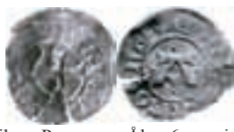
Erik av Pommern. Åbo. 6-penning. LL 9b, efter 1409. 0,44 g.