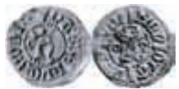
Hans. Oslo. Hvid. Schive 25. 0,78 g.