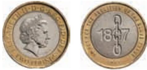
2 pund till 200-årsminnet 2007 av slavhandelns upphävande.

Slavhandeln under 1700–1800-talen var oerhört lukrativ och stora transporter med män, kvinnor och barn fördes över Atlanten från Afrika till Europa och Amerika. Det var den högsta formen av mänsklig degradering och reaktionerna på denna människohandel var starka.