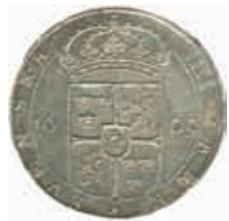
Karl IX. Stockholm. 4 mark 1609.