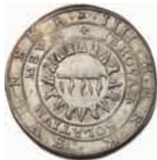
Karl IX. Stockholm. 4 mark 1606.