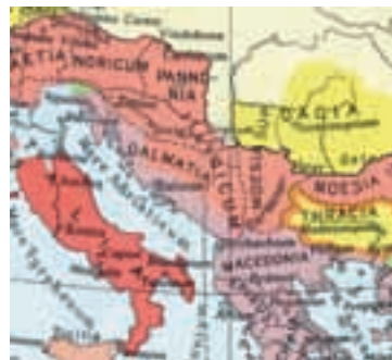
4. Ungern under romartiden.

Var och när myntet präglats samt av och för vem är osäkert. Emellertid återfinns i en artikel av Alföldi liknande mynt, daterade till ca år 300 eller senare, som hittats i Ungern. Under 300-talet beboddes dagens Ungern av bland annat sarmatiska, dakiska, keltiska och illyriska stammar. Området väster om Donau var en del av den romerska provinsen Pannonien och det sydöstra landområdet var en del av den romerska provinsen Moesia Superior. Resten av "Ungern" ingick inte i det romerska riket (fig. 4).