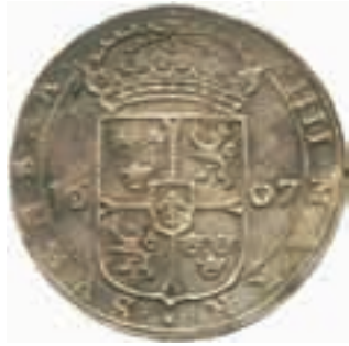
Karl IX. Stockholm. 4 mark 1607.