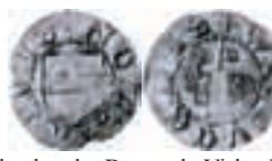
Gotland under Danmark. Visby. Hvid. LL 2, ca 1455-80. 0,65 g.