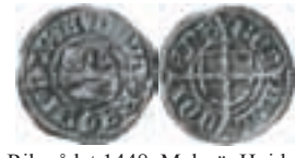
Riksrådet 1448. Malmö. Hvid. Galster 22. 0,73 g.