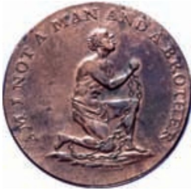
Engelsk token från slutet av 1700-talet. Förstorad.