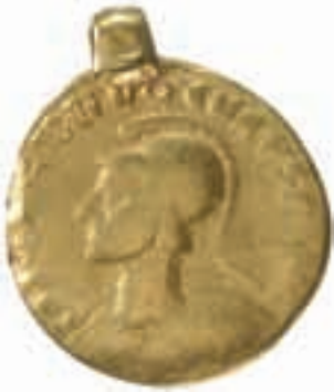
5. Åtsidan – Lundby-myntet. SHM-KMK inv.nr 7903. Skala 2:1.