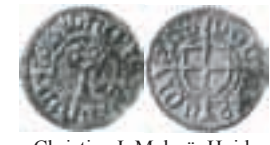
Christian I. Malmö. Hvid. Galster 23. 0,67 g.