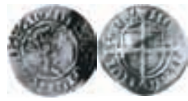
Christoffer av Bayern. Malmö. Hvid. Galster 20. 0,87 g.