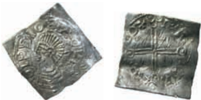
1. Det aktuella myntet som väger 2,98 g och har måtten 20,7x20,3 mm.

Det fanns två tydliga orsaker till att stampkedja 5 då hänfördes till Sigtuna; dels en Crux-frånsida, 4.71, som stilistiskt är av typiskt sigtunautförande, dels de många mynt i kedjan