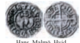
Hans. Malmö. Hvid. Galster 31. 0,67 g.

Bilderna som ses här intill utgör ett urval av de mynt som påträffades i Maltorp och inlöstes. Fyndet har inv. nr SHM-KMK 5090 och 5108. De svartvita fotografierna som tagits av Jan-Eve Olsson, KMK, har retuscherats av författaren.