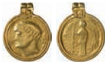
3. Efterpräglingen funnen i Stånga, Nårs socken på Gotland. SHM-KMK inv.nr 709.

Porträttet på åtsidan liknar, som ovan nämnts, den romerske kejsaren Probus som regerade åren 276-282. Kejsaren är iförd hjälm, spjut och sköld. Allra mest påminner det om porträttet på en aureus präglad i Thrakien i myntorten Serdica nära gränsen till Moesia Superior (RIC V:II:833, pl. IV:17).