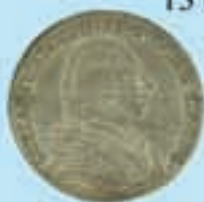
1/3 Riksdaler 1800