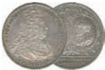
Ett mynt från våra tidigare auktioner

Välkommen som köpare eller inlämnare på våra auktioner.