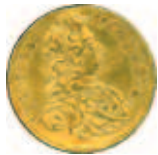
1 dukat 1691