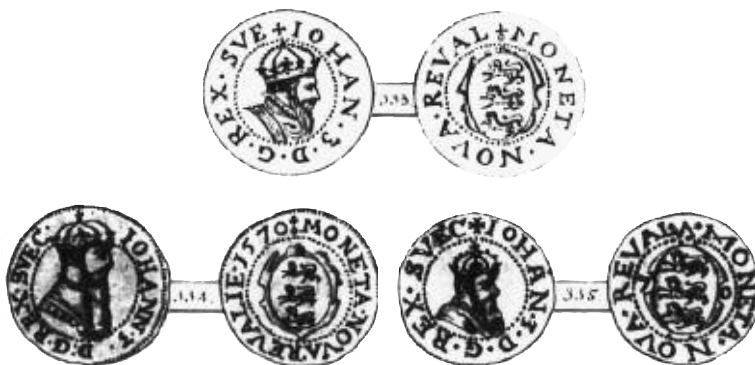
Fig. 5a. Schmith: Johan III:s feringar. Taf. XXXVI:333-335. Lägg märke till rätt kronologisk ordning.