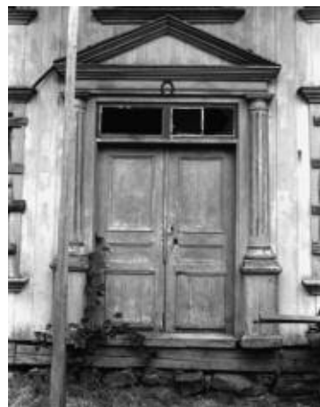
2. Portalen med doriska halvkolonner. På bilden syns sällstocken under tröskeln, där det vid renoveringsarbetet skulle visa sig ligga ett mynt.