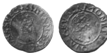
Fig. 18a-b. Två ex av Urban Denes första ferdingar (15)7-0, mm \Lambda (ex Reval).