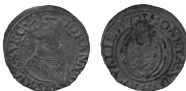
Fig. 14. Ferding 1570, Stockholmstypen, mm riksäpple. Privat ägo.