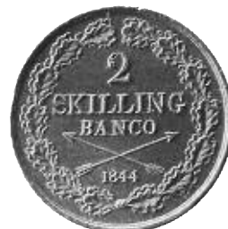
Oscar I:s 2 skilling banko 1844. Ett sådant kopparmynt, men från 1846, hade placerats under ingångens tröskel vid herrgårdens uppförande.

Men, hur förhåller det sig egentligen med en sådan tolkning av depositionen? Jag har inte i västerbottenskt sammanhang tidigare stött på något exempel som visar att mynt deponerats för att ge en anvisning om byggnadsåret.