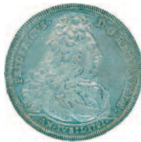
1 riksdaler 1721 Jubileum

Myntkompaniet Svartensgatan 6 116 20 Stockholm