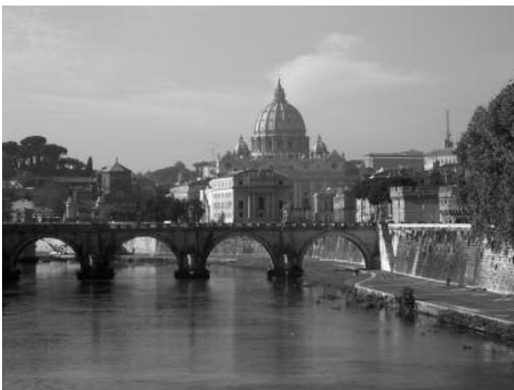
1. Vy över Rom mot Vatikanstaten.

Återigen ställde vi oss frågan – vad har vi egentligen gett oss in på? Vi stötte bara på återvändsgränder och insåg att vår förhoppning om att få se de påvliga medaljerna i Vatika-