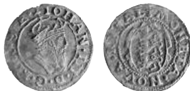
Fig. 11. Ferding u.å. (SB 40), mm riksäpple. Konungens ordningsnummer romerskt: IOHAN • III. Privat ägo.

Av någon orsak blev denna emission ytterst ringa, eller mynt av Typ III har hamnat på sådana håll där de har t.ex. smälts, eftersom halten inte ser ut att vara lägre än hos Eriks sista ferdingar eller hos de andra olagliga