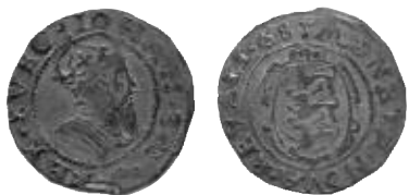
Fig. 9. Ferding (15)68, mm riksäpple. Privat ägo.