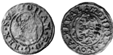
Fig. 10b. Ferding u.å. SB 40, mm riksäpple (ex Reval).