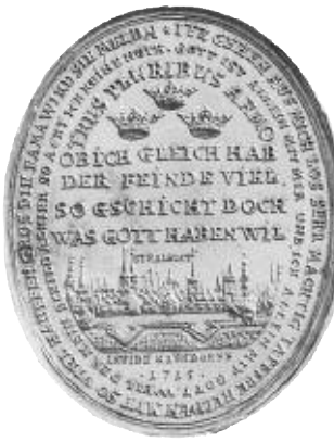
2. Medaljen över belägringen av Stralsund 1715. Graverad av G. W. Vestner i Nürnberg efter förslag av Egidius Naundorff. Hild. 182.

fattarskapet till några liknande skrifter, publicerade 1713-1714 av en viss Chevalier de Bellerive. 6 I det år 1889 publicerade registret till Warmholtz bibliografi uppges att Bellerive är en pseudonym för Naundorff, ett påstående som dock verkar sakna grund. I Kungliga Bibliotekets lappkatalog anges också under "Bellerive, chevalier de" att uppgiften "är med sannolikhet oriktig." 7