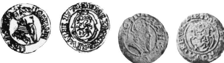
Fig. 7. Fering u.å., med buktig sköld, mm Paul Gulden, riksäpple (ex SB).