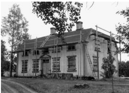
1. Norrfors herrgård i långt gånget förfall i september 1979.

ning nr 244). På samma sätt hette det i Alanäs i Jämtland, att det ”aldrig ansetts för bra att helt och hållet tömma sin börs. Då skulle man bli fattig. Det borde alltid vara åtminstone en liten slant kvar. I min [d.v.s. sagesmannens] hemtrakt kallades den slanten för äla-styvern eller tet'n ” (nr 245).