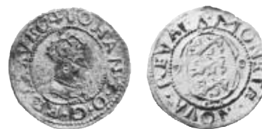
Fig. 19. Urban Dene II:s första ferding (15)7-0, mm \Lambda (ex Levin, ex SB, ex KMK).

Antalet Urban Dene II:s första ferdingstamplar är inte stort. Bara en avers- och en reversstamp är kända. Dessa mynt kan även klassificeras som provmyntsliknande, eftersom typen ej präglades i fortsättningen och att det inte finns någon stampkedja, endast mynt präglade med ett stamp-par. Antalet präglade, cirkulerande mynt måste också ha varit begränsat.