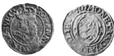
Fig. 15. Ferding 1570, Stockholmstypen, mm riksäpple. SB / Neumann / KMK.