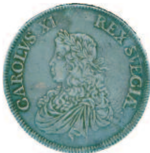
8 mark 1667