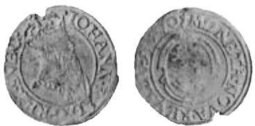
Fig. 13. Ferding 1570, Stockholmstypen. Kieler 1937 Nr 229, mm riksäpple.