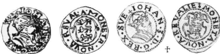
Fig. 6. Fering u.å., mm riksäpple. Körber s.151.