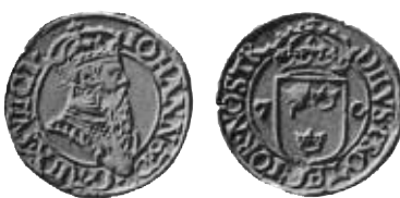
Fig. 16. Johan III:s stockholmska tvåöre från 1570. Bruun.

parna tillverkades 1+2, vilket är normalt för en svit stamplar (1+2 eller 1+3 stamplar).