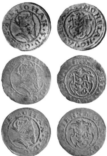
Fig. 8a-c. Tre ferdingar u.å., med buktigt sköld, mm Paul Gulden, riksäpple. (Fig. 8a, ex Reval, Fig. 8b-c, privat ägo.)

Då Erik XIV avsattes i Stockholm den 29 september 1568 måste också myntens utseende i Reval ändras, men först sedan man hade fått kännedom om tronskiftet. Stadens privilegier angående myntningen hade dock ännu ej förnyats. Tiden kan ha varit knapp vad gäller 1568 års emissioner med den nye konungens bild och titel, och för att spara tid använde man i så stor utsträckning som möjligt redan befintliga verktyg, punsar och stamplar från Eriks tid.