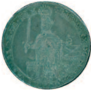
1 riksdaler 1608