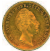
4 dukater 1846