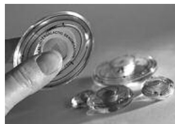
Quid – ny valuta för rymdturister.