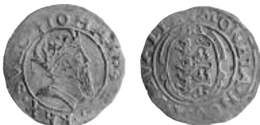
Fig. 10a. Ferding u.å. Vanlig SB 40, mm riksäpple. Privat ägo.