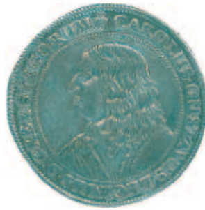
1 riksdaler 1654