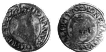
Fig. 12. Ferding 1570, Stockholmstypen, mm riksäpple (ex Reval).