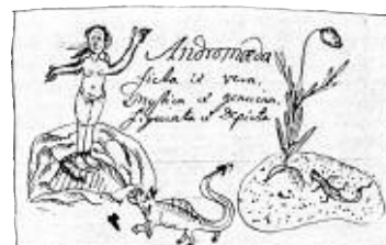
Linnés egen teckning från Lapplandsresan av en rosling, Andromeda polifolia , och en ödla, från vilken idén till medaljens frånsida är hämtad. Skannat ur Borg 1979.

Om medaljen över Linné säger Powell: "Jag ville visa något av den skönhet och det klagörande som Linnés klassifikationssystem givit oss och samtidigt säga något om hans person, inte bara visa ett porträtt utan även något av hur han tänkte ... Jag tyckte också att det var viktigt att