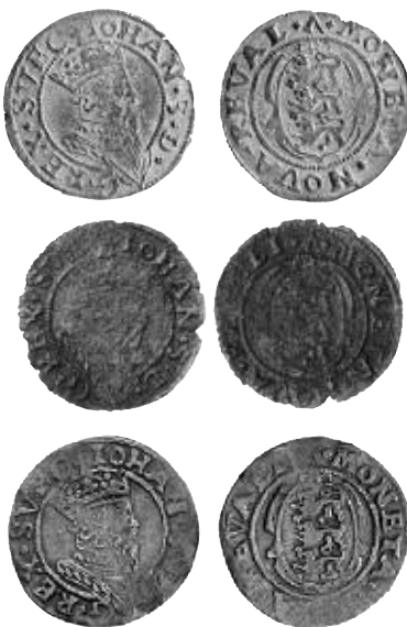
Fig. 20a-c. Ferdingar u.å., mm \Delta (stampkopplingar: 7A med 8a och 10a ovan), mm A åstadkommet med nummerpuns 7. Privat ägo och SNF 141:46.

Varför gjorde man 1+3 stampar? Kanske rörde det sig om en beställning. Då ett myntverk utövar sin verksamhet kontinuerligt, görs också