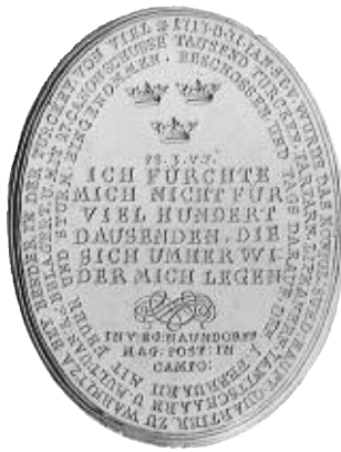
1. Medalj präglad över kalabaliken vid Bender 1713. Graverad av G. W. Vestner i Nürnberg efter förslag av Egidius Naundorff. Hild. 167.