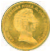
4 dukater 1843