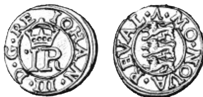
3c. Mäster Urban Dene II:s mm, \Lambda , på revalskt mynt med krönt IR.