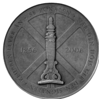
Konstnärsklubbens jubileumsmedalj 2007.

Konstnär är Andreas Ribbung. Exemplet tillhör Kungl. Myntkabinettet.