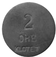
8. Denna kopparpollett användes på Café Klotet. Den gällde som synes för två öre. Den andra sidan är helt slät.

Särskilt en gång i månaden såg man hamnarbetarna fylla kaféet. Det var när baronen fått ut sitt underhåll, då tänkte han nämligen på de sämre lottade. Vid dessa tillfällen gick baronen själv ner till hamnen och bjöd in alla arbetare till Klotet, där de fick äta så mycket de ville på hans bekostnad. Även Stadens gatflickor bjöd han in på detta sätt, men till det finare "damrummet" på övre våningen. Det enda han begärde i gengäld var att man skulle tilltala honom "baron", själv duade han dem.