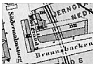
1. Här i kvarteret Nedra Jerngravens västra del invid Södermalmstorg låg Café Klotet.