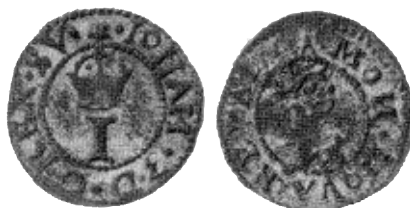
3b. Mäster Urban Dene II:s mm, \Lambda , på revalskt mynt med krönt I. SNF 141:48.