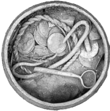
Förgyllt silverkärl fyllt med välbevarade mynt och andra föremål från 900-talet funna i Leeds i Yorkshire.