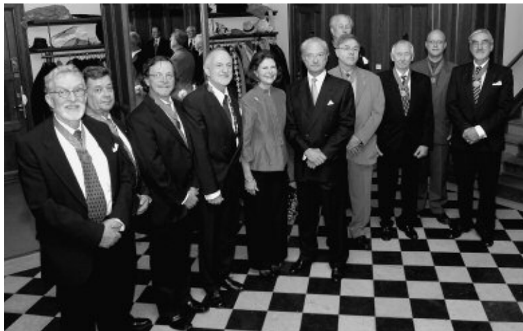
Konstnärsklubbens styrelse omger kungaparet (oktober 2006). Konstnären står näst längst till höger.

Anm.: Pokalen skulpterad i trä och behängd med smärre medaljer har klubben haft sedan senhösten 1856. Den står framför ordföranden. Nyintagna medlemmar (ceremonin äger