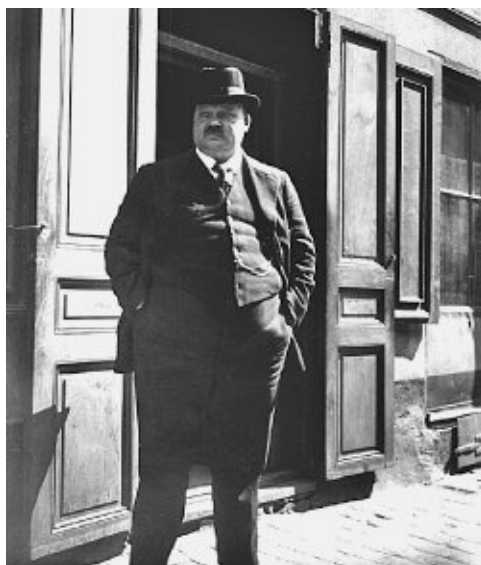
7. Utanför ingången till sitt kafé vid Klotgränd 3 står den bistre ölhandlar'n i solen.

Till höger skimtar kafégardinerna bakom det spröjsade fönstret.