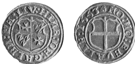
4. Revalsk ferdingförfälskning i tenn-bly, troligen från ca 1568. Präglad med gamla stam-par från ordenstiden. Privat ägo.