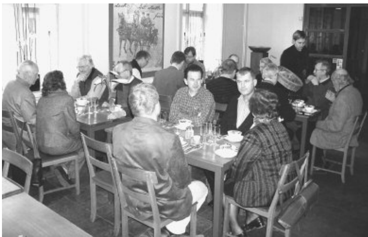
Deltagare i det numismatiska seminariet samlade för lunch på Myntkrogen.

Förmiddagens nästa föredragshållare var Kjell Holmberg som gjorde en översikt över den svenska myntningen 1364-1520 och presenterade några nya rön kring vissa mynttypers datering. Efter en kort beskrivning av förhistorien, mynttyper 1290 till 1364, fick vi en detaljerad och intressant genomgång av olika mynttyper från 1364 till 1520. En intressant utveckling gjorde Kjell angående penningar med krönt A – Åbo eller Västerås? Kjell kunde konstatera en ”störande” avsaknad av penningprägling under Karl Knutsson. Efter en genomgång av olika bitecken avslutade