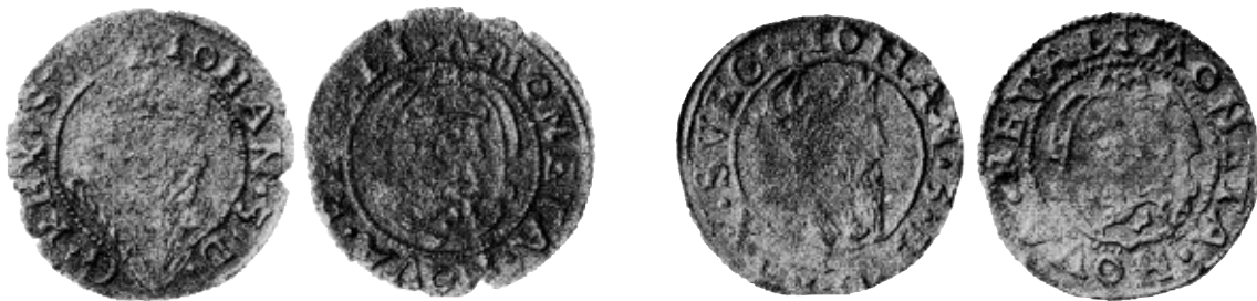
1. Johan III, Reval, ferding u.å., mm \Lambda (SB 40, SS 6138).