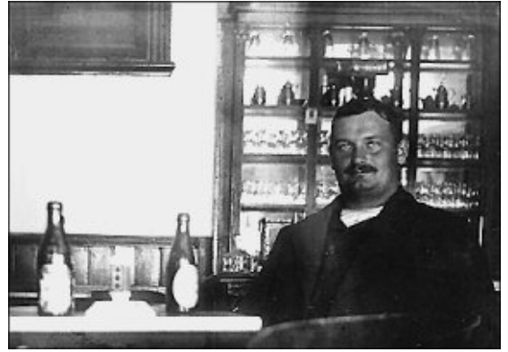
5. En av Klotets gäster med ett par ölbuteljer på bordet. Mellan flaskorna ses en tändsticksask på ett askfat med ställ. Det var säkerhetständstickorna Tre stjärnor från Svenska Tändsticks AB som användes.