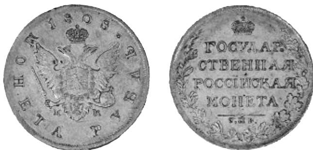
2. En mycket väl bibehållen rubel från 1808 förvaras i Umeå läroverks mynt- och medaljsamling.

Finland och gå i förläggning kring Torneå i dåvarande Västerbotten.