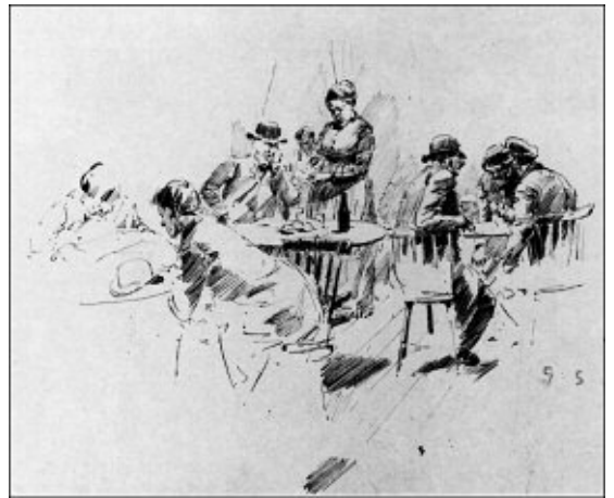
6. Inne på okänt ölkafe omkring år 1890. Tuschteckning av Georg Stoopendal.

var inrett. Gästerna satt på enkla men snygga, mörka pinnstolar vid vad vi i dag skulle kalla kafébord. Till den lite proprare övervåningen kom de "finare" gästerna, män med manschetter. Där var sätena klädda med plysch. Här brukade Stadens gatflickor, "lärkorna", också få sitta. Våningen benämndes därför ofta på skoj "damrummet". Bild 2-6.