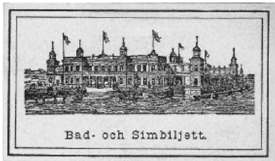
Fram- och baksida av den vackra biljetten till Strömbadet gällande år 1891. Förminskad.