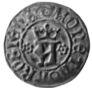
Fig. 4. KMK, Stockholm, Riksbankens samling, vikt 1,27 g. Skala: 2:1.