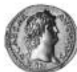
14. Klubbat pris 40.000:-

Vi tackar alla våra kunder för en mycket lyckad första auktion på KMK 15 maj 2005!