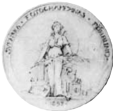
Förlaga till medalj för Svenska Fotografernas Förbund som utförts i blyerts av Carl Milles 1897.