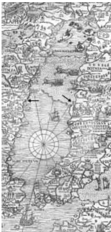
Fig. 2. Både Korsholm och Grundsunda finns markerade på Olaus Magni Carta marina, tryckt i Venedig 1539.

Kung Kristian hade avancerade handelspolitiska planer. Han ville utmanövrera Lybeck och övriga hansestäder från den nordiska marknaden. Det skulle ske genom strikt organisering av direkta handelsförbindelser mellan Norden och Västeuropa. Seglationen skulle gå via Öresund. Kristian ville inrätta ett omfattande nordiskt köpmanssällskap, med kontor i fyra strategiskt belägna städer; nämligen i Stockholm, i en stad vid ryska gränsen – antagligen Viborg –, i Köpenhamn och i en stad vid atlant-