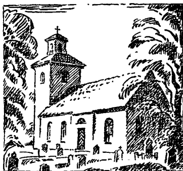
Ramkvilla kyrka. Ur Ek 1951.

År 1765 var det dags för att ersätta det gamla vapenhuset i trä med ett helt nytt av sten. I Historisk beskrifning ... berättas om ett myntfynd i