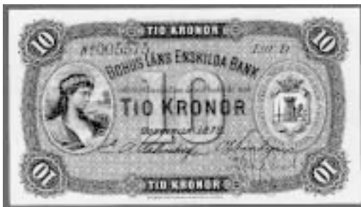
10 kr Bohus Läns Enskilda Bank 1879 ett objekt från en samling privatbanksedlar

Katalog 75:- till pg 53301-8 eller se den på vår www-adress