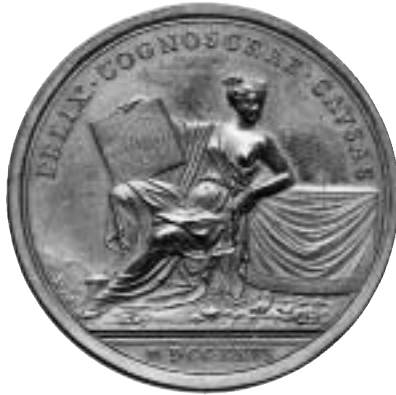
Präglad bronsmedalj över Isaac Newton. Medaljen mäter 52 mm och den är graverad av den engelsk-tyske gravören John Croker (född i Dresden 1670 och död i London 1741). Medaljens fränsida visar en gudinneliknande kvinna som symboliserar "vetenskapen". Med högra handen håller hon i en platta som visar solsystemet.

mynt för hela riket men de skotska mynten fortsatte att cirkulera. Brittiska mynt präglades i myntverket i Edinburgh. Däremot fick man inte längre blanda in kopparkoppar i silvermynten.