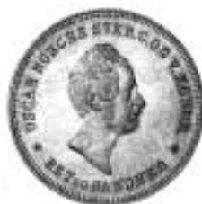
485. Klubbat pris 15.500:-