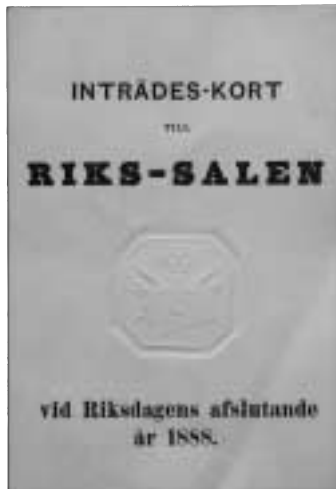
Ett minne från riksdagens avslutning 1888.

Inträdeskortet har kanske använts av någon anhängig till en riksdagsman eller av en person som hedrades av någon särskild orsak. Troligen är dessa kort tämligen sällsynta idag. IW