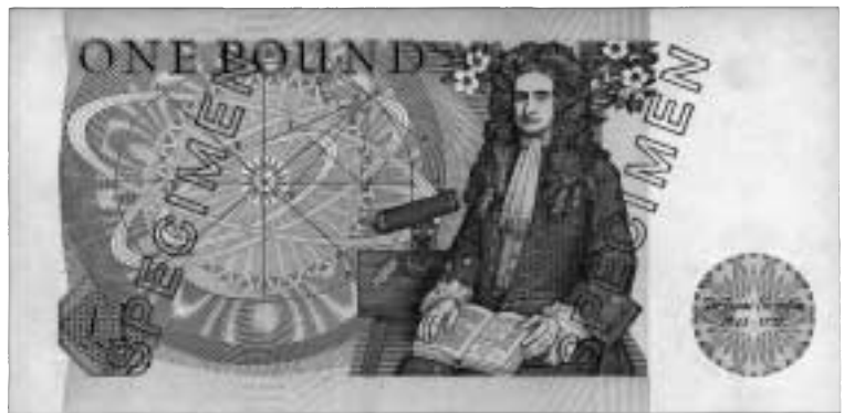
Sedelspecimen utgiven av Bank of England på valören £1. Sedelns baksida visar en sittande Isaac Newton som i knät har sin bok Principia. Denna sedel utgavs 1981.

Jordanova, L.: Defining Features: Scientific and Medical Portraits 1660-2000. London 2000. □