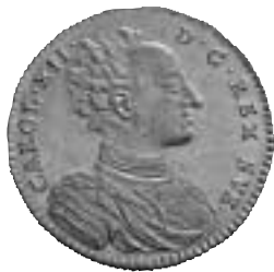
Kanske det mest porträttlika bilden av Karl XII, dukt 1718. Gravör är Johann Carl Hedlinger. Dubbel storlek.