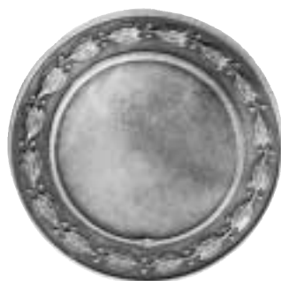
Den färdiga medaljen till Svenska Fotografernas Förbund. Medaljens upphovsman är målaren m.m. Oscar Andersson, d.v.s. signaturen O. A. Präglad i silver vid Kungl. Myntet, 41 mm.

Han kände ett stort främlingskap och led av psykisk sjukdom. Hur som helst var det inte till OA:s nackdel i medaljtävlingen att han redan visste en del om medaljernas väsen.