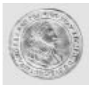
Dukat G II A Nürnberg 1632