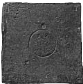
Bild 11. 32 schilling.