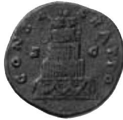
Fig. 2. Sestertius präglad år 161. På åtsidan DIVVS ANTONINVS, kejsarens porträtt. På frånsidan CONSECRATIO, pyramidalt krematorium i fyra våningar. Överst kejsarens vaxstaty i triumfvagn.