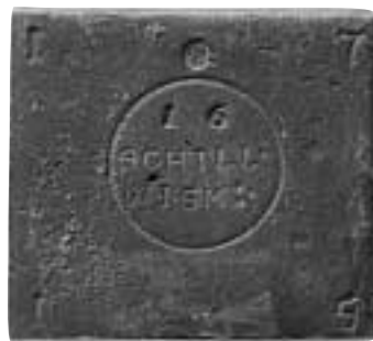
Bild 13. 16 schilling.