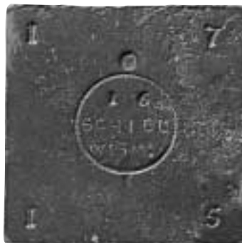
Bild 15. 16 schilling. Se även omslaget.