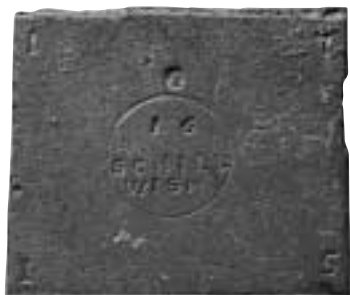
Bild 14. 16 schilling.