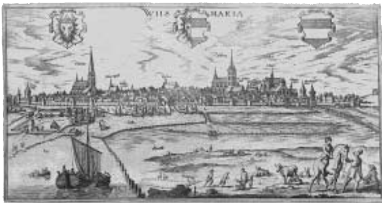
Bild 1. Wismar ca 1710. Stadshuset (Rathhaus) i vars källare myntningen ägde rum ses t.v. om S. Maria kyrka. Se även omslagsbilden.