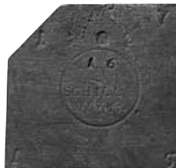
Bild 16. 16 schilling.