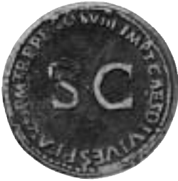
Fig. 1. Sestertius, präglad under kejsar Titus år 80. På åtsidan DIVO AVGVSTO VESPASIANO. Fyra elefanter drar en ornamenterad vagn, på vilken en vaxstaty av kejsar Vespasianus tronar.