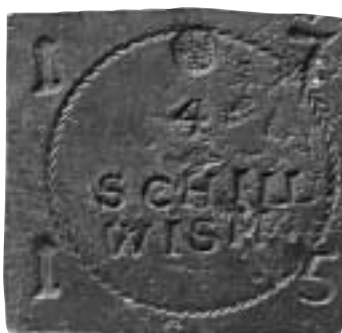
Bild 21. 4 schilling.