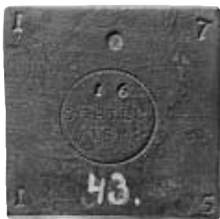
Bild 9. Falsk 16-schilling (87x87 mm, nr 12 enligt Tabell 4). Avesta myntmuseum