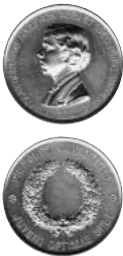
Bild 2. Kronprins Gustafs prismetalje, avslag i 31 mm forgylt bronse.

latin OSCAR GUSTAVUS ADOLPHUS NORV. ET SUEC. PRINC. SUCCESS. OG ANNO MDCCCLXXIV INST. Reversen får kun få forandringer fra den opprinnelige medaljen utført i 1849. Kronprinsens gullmedalje ble fortsatt delt ut frem til og med i 1907 da den erstattes av en medalje med den nye norske kong Haakon VII's portrett. Den får også da det nye navnet "Kongens prismetalje". Kongens prismetalje deles fortsatt ut av universitetet i Oslo, men er ikke lenger i gull som den opprinnelig var i perioden 1851-1907.