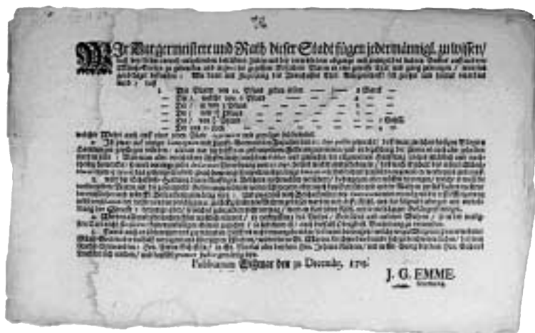
Bild 2. Förordning 30 december 1715 för plåtmyntningen i Wismar. Reprofoto.

med tillståndet att använda kanonerna som råmaterial för plåtmynten vet vi inte. Enligt en skrivelse av den 24 juni 1714 (Jakobsson 1939) förbjöd kungen uttryckligen under någon som helst förevändning nedsmältning av erövrade kanoner. Skrivelsen är undertecknad av Karl XII och Casten Feif. Om kungen ändå godkände nedsmältningen så måste han alltså gjort ett extra ordinarie undantag på grund av Wismars mycket prekära finansiella läge. En officiell förordning (Bild 2) rörande plåtmynten är daterad 30 december 1715. Där stadgas att plåtmynt i valörerna 8 och 4