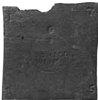
Bild 17. 8 schilling.