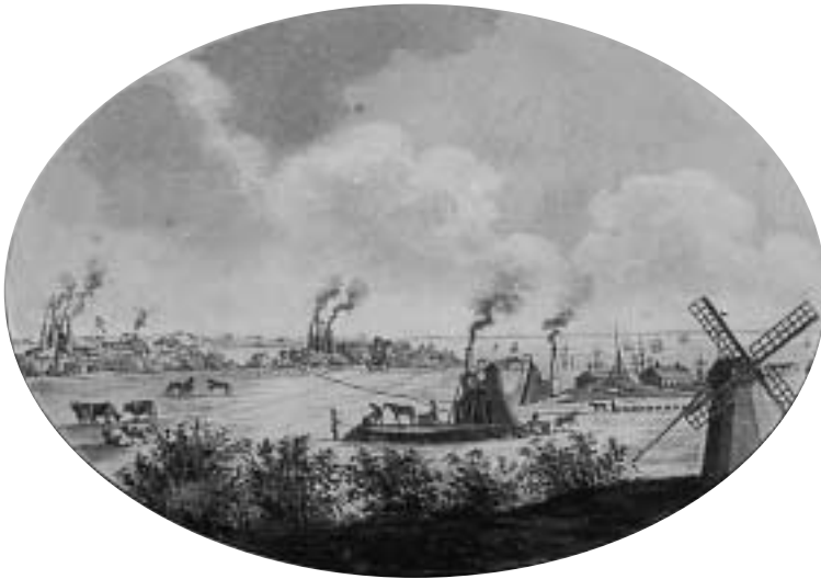
Höganäs aktiebrevsvinjett från 1805.