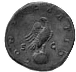
Fig. 3. Sestertius präglad under kejsar Marcus Aurelius år 169. På åtsidan DIVVS VERVS, Lucius Verus porträtt. På frånsidan CONSECRATIO, örn med öppna vingar och en glob i gripklorna. På en sestertius präglad till Divus Marcus Aurelius gudaförklaring sitter kejsaren på ryggen av örnen, som lyfter mot himlen.

i tåget kommer alla de länge sedan döda, de tappra och framstående förfäderna till dagens prominenta medborgare. Det är deras sentida ättlingar som visar upp dem, själva utklädda till dem, iförda deras förnämsta uniformer och med vaxavgjutningar av deras porträtt framför sina ansikten. Härefter följer körerne – män och ynglingar som sjunger hymner och sorgesånger till den döde kejsarens ära. Bronsstatyer bärs fram, pyntade i olika nationalitetsdräkter, symboler för alla de folk som Rom har underkuvat och det kommer fram representanter för Roms eget folk, för staden Roms yrkessammanslutningar, för riddarna och för soldaterna.