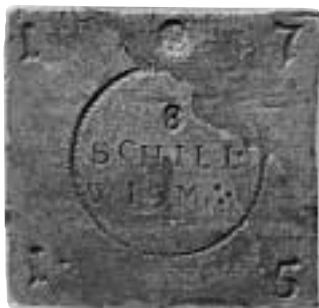
Bild 10. Falsk 8-schilling (63x60 mm, nr 9 enligt Tabell 2). KMK.