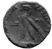
6. Välgjord gjuten plastkopia av en tetradrachm från ptolemaiernas tid. "Silverfärgen" är dock inte så lyckad.