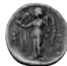
12. Galvanokopia av Alexander den stores guldstatler – i silver!