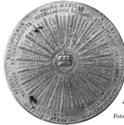
4. Ett bättre bibehållet exemplar av Oscar II:s 70-årsmedalj.

gen att medaljen råkat hamna under golvet vid spisen sedan huset tagits i bruk – kanske i samband med förtenning av kopparkärl?