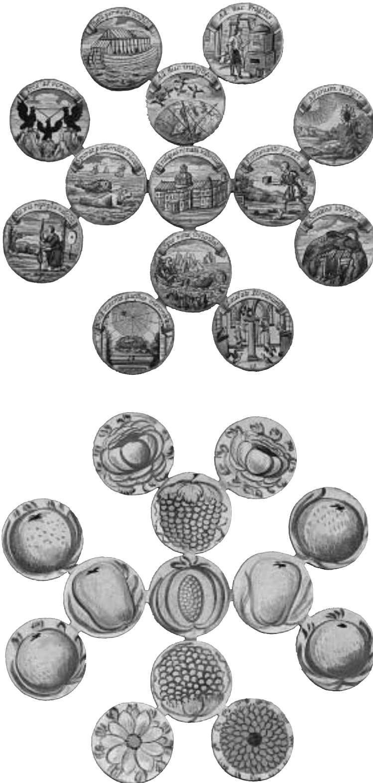
Fig. 3. De akvarellmålade pappersrundlarna.

frånsidans insida syns en grafisk, kolorerad bild av det salomoniska templet. På gården står de två salomoniska pelarna, Jakin (ståndaktighet) och Boas (styrka eller tapperhet).