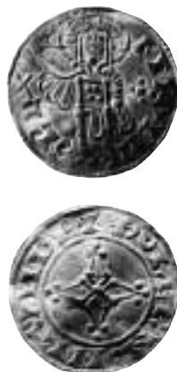
Fig. 2. Mynt präglat i Lund under Sven Estridsen 1047-1074. Hauberg 28. Vikt 0,97 g, diam. 17,50 mm. KMK, id.nr 300968. Ex Löddeköpinge, Löddeköpinge sn, Skåne. SHM inv.nr 3357. Förstorat.

åt både när det gäller vikt (0,85 mot 0,97 g), förvisso inom det normala viktspannet, och diameter (16,80 mot 17,50 mm), vilket är en stor avvikelse. Randen är tunnare och anorlunda utformad på galvanokopian, vars ämne dessutom är helt plant utan spår av de böjningar som är vanliga på vikingatida mynt från den aktuella perioden. Till detta skall även den höga kopparhalten läggas. Någon skarv mellan åt- och fränsida har inte kunnat upptäckas på galvanokopians rand.