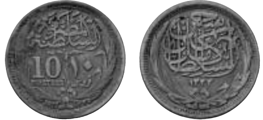
4. Gjuten blykopia av ett egyptiskt silvermynt avsedd att prånglas ut i den allmänna handeln.