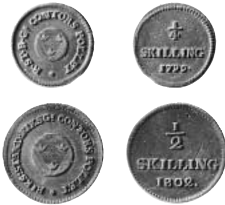
Riksgäldskontorets polletter, ¼ skilling 1799 och ½ skilling 1802.

När man ger ut nya betalningsmedel måste allmänheten upplysas om vad som gäller. Därför formulerades en text som skulle ge nödvändig information. Följande notis infördes i Inrikes Tidningar 13 september 1799, Göteborgs Allehanda 24 september