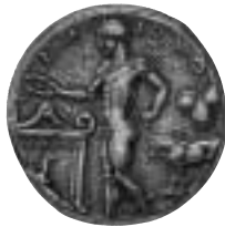
Selinus, ca 467-413 f.Kr. Tetradrachm. Frånsidan. Diam. 26 mm, vikt 16,57 g. SNG nr 493.

Vi vet också, att vad vi i vår tid upplever som de stora fluktuationerna i valutahänseende, de mest påtagliga ingredienserna i det ekonomiska skeendet, på intet sätt är något