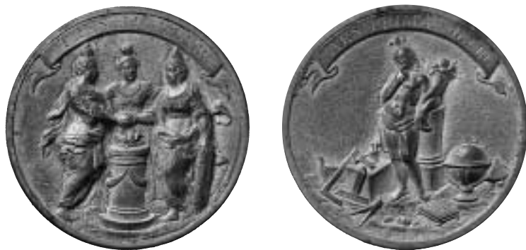
Fig. 1. Skruvmedaljens åt- och frånsida. Diam. 45 mm.

Det brinnande hjärtat står för glödande kärlek och religiös iver, nit och dyrkan. Nötens roll i symboliken visar ofta på något värdefullt innehåll som omges av ett hårt skyddande skal. Hos Augustinus symboliserar nötens hölje Kristi kött och lidandets bitterhet, skalet korsets trä och kärnan den söta gudomliga uppenbarelsen. Granatäpplet är symbolen för odödlighet, pånyttfödelse, andlig alstringskraft och därmed kyrkan,