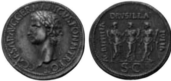
7. Paduankopia av ett romerskt bronsmynt. Dessa präglades från renässansen och troligen fram till slutet av 1700-talet för att tillfredsställa samlare.