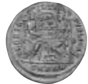
8. Välgjord guldsolidus från Constantius II. Troligen tillverkad i Libanon i början av 1900-talet i för låg vikt. Senare gjorda falska exemplar är av rätt vikt och halt!