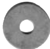
Pollett nr 5, 25 mm.