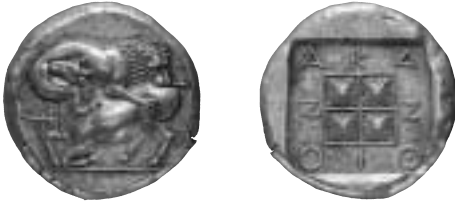
5. En synnerligen tilltalande kopia av en tetradrachm från Akanthos i Makedonien. Fulländad gravyr ochprägling. Rätt vikt och vacker patina!