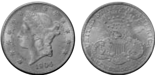
11. Falskt 20-dollarsmynt med för låg guldhalt. Det har varit föremål för rättslig prövning. Domen löd på gravering: GBG:s TINGSRÄTT SVERIGE 27-6 1972 FALSE. (Se Göteborgs Numismatiska Förenings Småskrift nr 13 s. 278-285.)