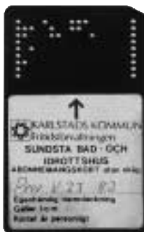
Årskort av plast, 86x54 mm.

Karlstads Badhus – eller Sundstabadet – använde sig av polletter mellan januari 1979 och augusti 1997. Det förekom fyra, egentligen fem, olika polletter plus två årskort av plast. Ett vitt kort som användes till den något "finare" avdelningen och ett brunt till den "sämre".