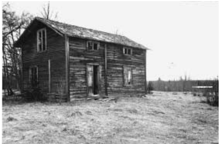
2. Bostadshuset där medaljen påträffades.