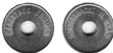
Pollett nr 2, 26 mm.