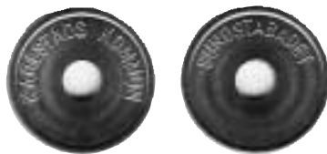
Pollett nr 1, 24 mm.