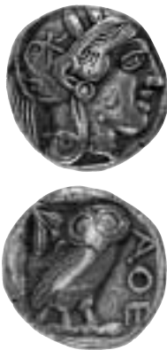
Tetradrachm. Åtsida: Athena i profil. Frånsida: Ugglan, Athenas attribut. Skala 1:1.

Foto: Gabriel Hildebrand, Kungl. Myntkabinettet, 2004.