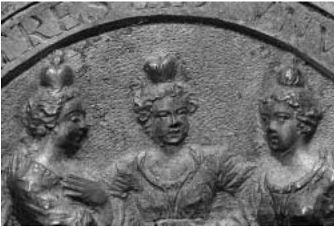
Fig. 4. Närbild på de tre kvinnornas symboliska huvudprydnader.