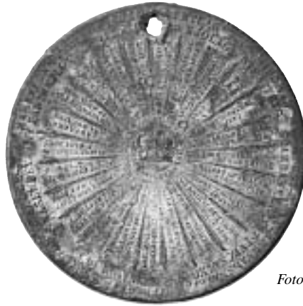
3. Nordanås-exemplaret av Oscar II:s 70-årsmedalj.