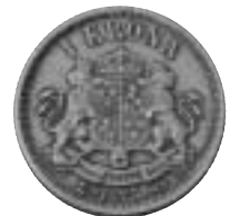
10. 1 krona 1875 (med fel kungabild) av Trollhätte-Svenssons tillverkning.