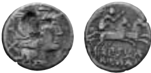
9. Pläterad romersk republikdenar, där myntets kärna blotlagts till följd av en kraftig skada på hjälmen. Äkta/falsk?