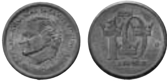
1. Falsa tiokronor dök upp våren 1995. De anses vara präglade i Kiev för den svenska marknaden.