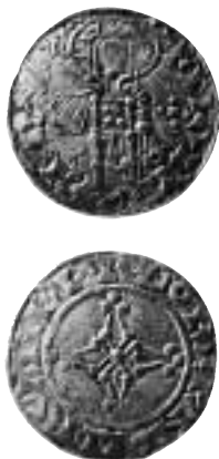
Fig. 1. Galvanokopia av mynt präglat i Lund under Sven Estridsen 1047-1074. Hauberg 28. Vikt 0,85 g, diam. 16,80 mm. Förstorat.

Tack vare de rikhaltiga samlingarna på KMK kunde ett ”stampidentiskt” exemplar lokaliseras i den systematiska samlingen av danska mynt (fig. 2). 3 Vid jämförelser mellan de två exemplaren ser man tydligt skillnaderna dem mellan. De skiljer sig