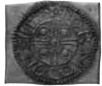
2. Fantasmymnt. Präglad penning från Anund Jakob på fyrkantig tjock plants. Beställningsarbete från 1950-talet.