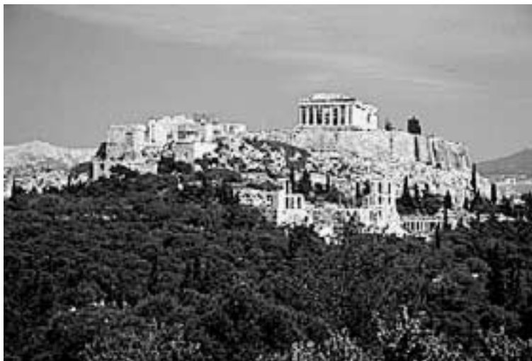
Athen, Akropolis med Parthenon. 2003.

Ebba Engström har en fil. mag. i konstvetenskap och har under en kortare tid varit anställd på Kungl. Myntkabinettet.