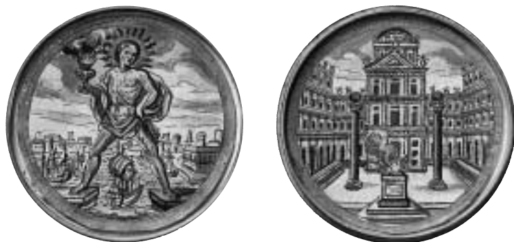
Fig. 2. Skruvmedaljens insidor. Se även omslagets färgbild.

där kärnorna är kyrkans talrika anhängare.