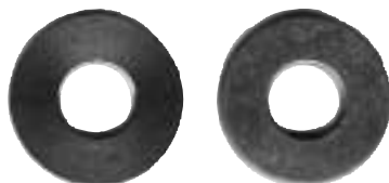
Pollett nr 3, 24 mm, nr 4, 25 mm.