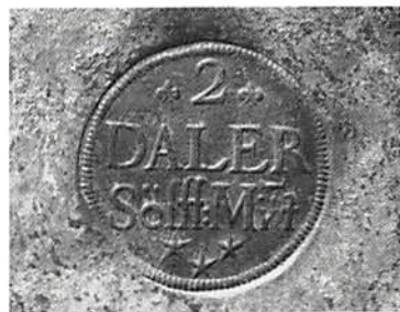
3. Miltstämpel på ett plåtmynt präglat i Avesta 1674-76.