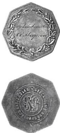
Silverpollett från Stockholms Nya Spårvägsaktiebolag.

Tänk om man kunde få en gratis bussbiljett av silver! Idag skulle detta vara helt otänkbart och synnerligen odemokratiskt, men under 1870- och 1880-talen var det fullt möjligt.