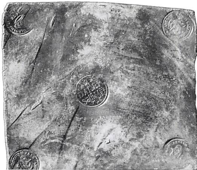
2. Plåtmynt av valören 2 daler sm präglat i Avesta 1676. Vikten skulle enligt myntförordningen 1674 vara 2,720 kg.