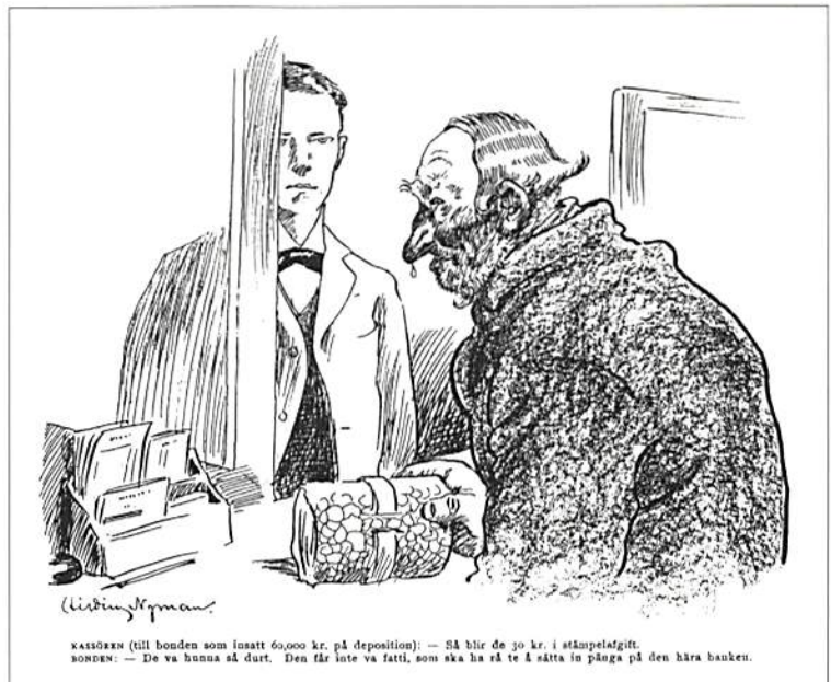
KASSÖREN (till bonden som insatt 60,000 kr. på deposition): — Så blir de 30 kr. i stämpelavgift. BONDEN: — De va hundra så snart. Den får inte va fattig, som ska ha så te å sätta in penga på den hära banken.