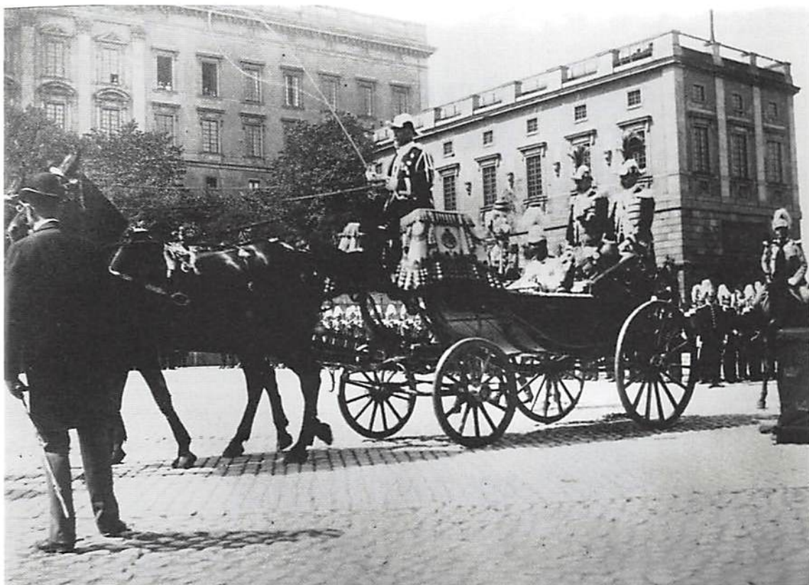
Oscar II och Chulalongkorn i vagn på väg till Kungl Slottet i Stockholm efter mottagningen vid Gustav III:s staty, dit den höge besökaren anlät i "Vasaorden".