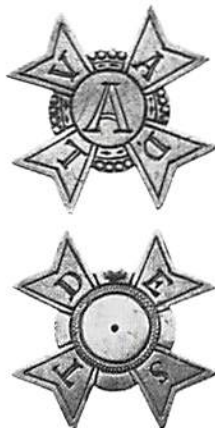
Ordenstecknet funnet i Årsta skog. Skala 1:1.

Strax före jul inkom till Kungliga Myntkabinettet ett märkligt fynd från Årsta skog. Bland 52 mynt från nyare tid fanns också ett ordenstecken i silver.