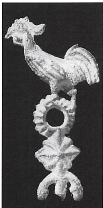
Tenntupp från Malackahalvön. KMK 102 443.

Det var under sultanen Muhammad Jiwa Zainal Abidin Muazzam Shah (1710–1773) som bruket med betalningsmedel i form av stridstappar av tenn infördes. Stridstappen har alltid varit populär på Malackahalvön och inom den Indonesiska övärlden. Bättre folklig förankring kan man knappast tänka sig när det gäller pengar. Tenntupparna och de andra tenndjuren framställdes hu-