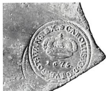
4. Exempel på en av de fyra hörnstämpelarna på ett plåtmynt präglat i Avesta 1675.