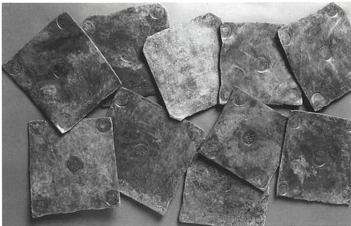
1. Tio plåtmynt av valören 2 daler sm präglade för Karl XI i Avesta 1674-76. Fyndet gjordes i Froafälle nära Älmhult i Stenbrohults socken, Småland, i maj 1996.