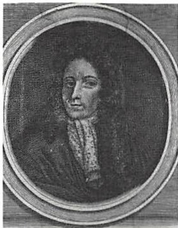
Fig. 1. Johann Gröning, Wismar 1669 – Wismar 1747 (?). Kopparskick av Diedrich Lemkus från Johannis Gröningii Bibliotheca Universalis, Hamburg 1701. Hertig August Bibliotheket, Wolfenbüttel.

Uppfostringsresan var i första hand förbehållen de unga adelsmän som ville uppsöka främmande furstehus för att bekanta sig med dem. Vid tillfälle besökte man även universiteten för att orientera sig om studieförhållandena, men man passade också på att då och då att enbart roa sig. 4 Studieresan upptäcktes snart även av förmögna företrädare för borgarståndet. Charles Patin (Paris 1533 – Padua 1693), 5 den berömda läkaren och numismatikern, som 1667 tvingades fly från Frankrike undan konung Ludvig XIV:s rättsjämnare, reste under åren 1668-73 genom Europa och besökte ett större antal furstliga myntkabinett. 6 En resande par excellence var emellertid Konrad Zacharias von Uffenbach (Frankfurt 1683 – Frankfurt 1734), 7 själv en engagerad samlare av böcker, rariteter, kuriosas och mynt. Han företog tillsammans med sin bror en utsträckt studieresa, som under åren 1709-11 förde honom till Nordtyskland, Nederländerna och England. 8 I Uffenbachs reseplan stod i första hand besök vid biblioteken och kuriosakabinetten liksom mynt- och antikvitetsksamlingarna. Vid sidan av furstliga adresser finner man i hans dagbok framför allt borgerliga namn som köpmän, jurister, läkare, pastorer och universitetsprofessorer (bl.a. i Helmstedt).