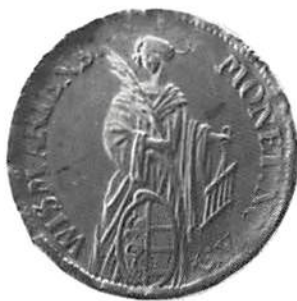
Fig. 5 och 6. Åt- och frånsida av den wismarska talern från 1674. Myntmästartecknen "arm med svärd", präglad av Hans Ridder i Lübeck.