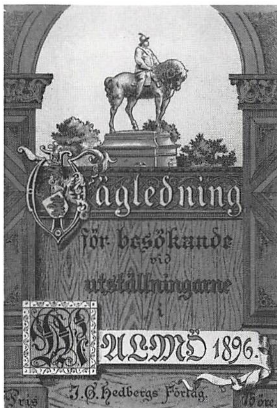
Fig 1. Omslaget till katalogen från Nordiska Industri- och Slöjdställningen 1896 i Malmö.

Idag kan man köpa nygjorda tennsoldater, gjutna i Öhrströms gjutformor, i museibutiken i Ystads stadsmu-