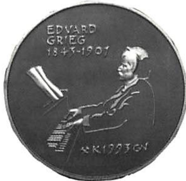
Nytt norsk jubileumsmynt: Edvard Grieg 1843-1907.