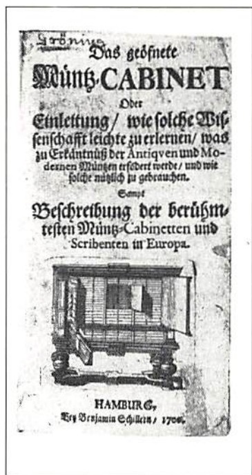
Fig. 3. Titelbladet till "Das geöffnete Münz-Cabinet", Hamburg 1700. KMK.

grekiska mynten). Med denna litteratur kan även borgare utbilda sig till riddare! I 23:e kapitlet, Zeiget die berühmtesten Münz-Cabinetten in Europa (visar de berömdaste myntkabinetterna i Europa), finner den resande numismatikern en förteckning över de mest betydande myntsamlingarna i furstlig och privat ägo. Kapitel 24. ( Verzeichnis der besten und berühmtesten Scribenten ) till sist är ett försök till en numismatisk bibliografi och tidsmässigt klart före Anselm Banduris (Ragusa 1675 – Paris 1743) 21 för första gången i Paris 1718 utgivna bibliografi, 22 sedan också i Hamburg 1719 (liksom Ritterplatz!), som vanligen ses som den äldsta av sin typ. 23 Dessutom bör här noteras, att Burcard Gotthelf Struve (Weimar 1671 – Jena 1738) 24 med sin Bibliotheca Numismatum Antiquiorum, Jenae, Sumtibus Jo. Bielkii Bibliopolae, MDCXCIII (1693) faktiskt utgör den äldsta numismatiska bibliografien – den borde alltså inneha en plats i Guinness Rekordbok 25 ! Dessutom bör nämnas, att bandet med myntavbildningar av romerska aurei (där bland den sällsynta Antoninus Pius' aureus för Diva Faustina med PVELLAE FAVSTI-