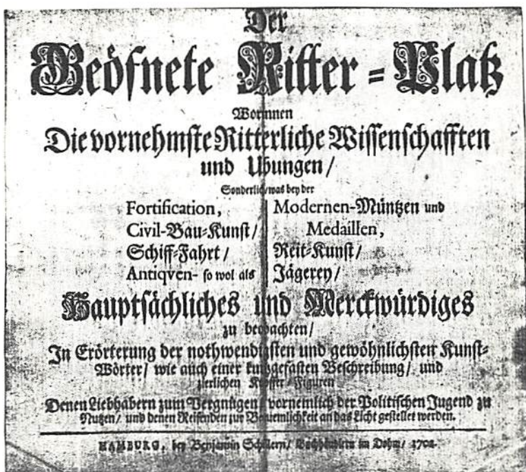
Fig 2. Titelbladet till "Der Geöffnete Ritter-Platz", Hamburg 1702. Museum für Hamburgische Geschichte, Hamburg.

Gröning har efterlämnat ett omfattande författarskap; Schröder 18 har kommit fram till inte mindre än 27 titlar, mest med juridiskt innehåll, Lipsius 1801 19 känner till sex numismatiska titlar, fem därav kommer från Ritterplatz , dessutom ytterligare en liten publikation: Johannis Gröningii, D. Historia Expeditionis Britannicae ex Numismate III Libris exposita, Hamburgi, apud Godfrid Libezeit, A. 1701 , till vilken vi återkommer längre fram.