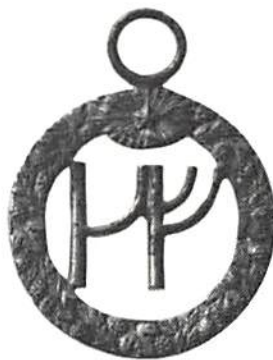
Hänge med runorna K och F. Funnet på Birka.