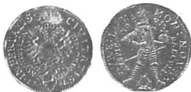
Fig. 7 och 8. Åt- och frånsida av den lübeckiska dubbeldukaten från 1701. Myntmästartecknen "arm med svärd", präglad av Hans Ridder i Lübeck.