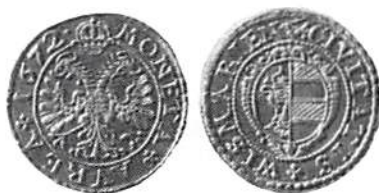
Fig. 1 och 2. År- och fransida av den wismarska dukaten från 1672. Myntmästartecknet "arm med svärd", präglad av myntmästare Hans Ridder, Wismar.

I vad mån den i Wismar verksamme myntmästaren Hans Ridders myntmästartecknet på dukaten från 1672 även skulle kunna gälla för myntet från 1743, måste anses mycket tvivelaktigt då myntmästartecknet för den 1674 från Wismar till det närbelägna Lübeck överflyttade myntmästaren Hans Ridder 4 blott låter sig påvisas till 1717. Från 1718 är det emellertid påvisbart, att myntmästaren Heinrich Ridder i Lübeck fortfarande använde sig av myntmästartecknet "arm med svärd". Härstammande från släkten Ridder, möjligtvis Hans Ridders son, skulle den wismarska dukaten från