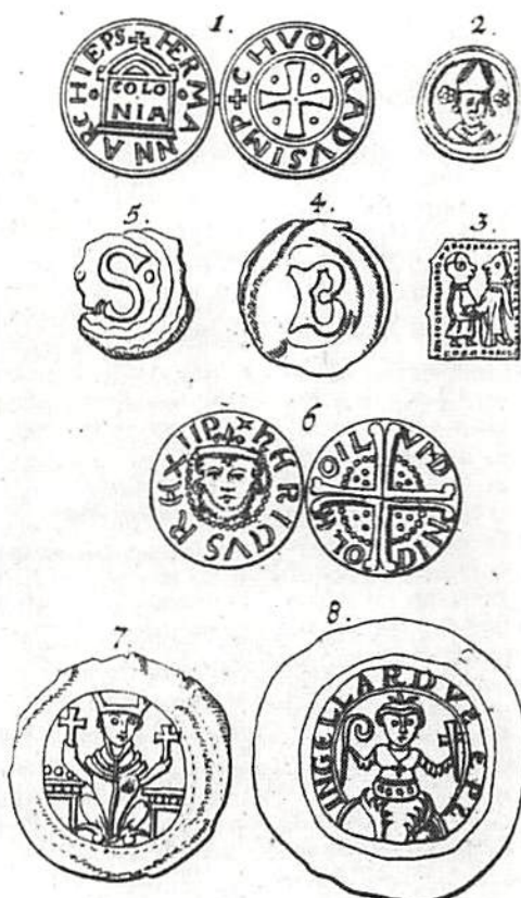
Fig. 7. Myntavbildningar ur Historia Numismatum Critica , Hamburg 1702. KMK. De flesta av dessa har Gröning hämtat ur Otho Sperlings de nummorum bracteatum et cavorum... origine . Lübeck 1700.

(1036-56) och kejsar Konrad II (1027-39), pfennig. Hävernäck 33 251. 34