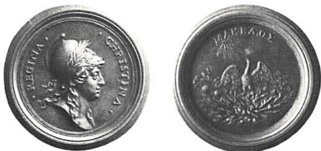
Fig. 5. Drottning Kristina. Medalj i brons, Rom ca 1659/65. KMK.