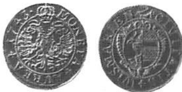
Fig. 3 och 4. År- och fransida av den wismarska dukaten från 1743. Myntmästartecknet "arm med svärd", troligen präglad av Heinrich Ridder i Lübeck.

1743 kunna tillskrivas honom eller en av hans efterkommande. Det är därför ganska sannolikt, att stammparna från 1743 graverades i Lübeck och att dukaten som en följd därav även präglades där.