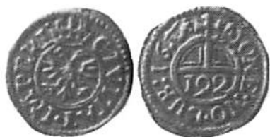
Fig. 9 och 10. Åt- och frånsida av ett på sin tid ej utgivet provavslag i guld av en trefennig från Lübeck från 1671. Myntmästartecknen "arm med svärd", präglad av Hans Ridder. Förstorad.