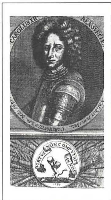
Fig. 6. Porträtt och medalj med Karl XII från Johanns Gröningii Bibliotheca Universalis, Hamburg 1701. Hertig August Biblioteket, Wolfenbüttel.

han i Hamburg 1701 offentliggjort 32 en avhandling om Karl XII:s (född i Stockholm 1682, regent 1697-1718, stupad vid Fredrikshald sistnämnda år) fälttåg 1700-1701 i Ryssland i början av det nordiska kriget. Ett porträtt av kungen tillsammans med en avbildning av en medaljfrån sida från 1688 är placerade på det lilla bandets försättsblad.