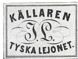
Papperspollett från Källaren Tyska Lejonet i Gamla stan. Tillhör Kungl. Myntkabinettet.