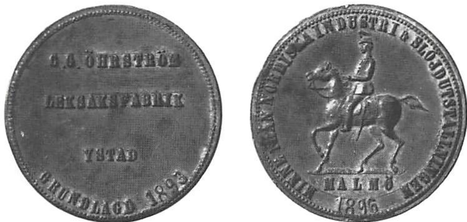
Fig 2. Medalj av bly präglad för utställningen av Öhrströms leksaksfabrik.