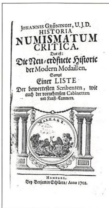
Fig. 4. Titelbladet till "Historia Numismatum Critica", Hamburg 1702. KMK.

grekiska mynten). Med denna litteratur kan även borgare utbilda sig till riddare! I 23:e kapitlet, Zeiget die berühmtesten Münz-Cabinetten in Europa (visar de berömdaste myntkabinetterna i Europa), finner den resande numismatikern en förteckning över de mest betydande myntsamlingarna i furstlig och privat ägo. Kapitel 24. ( Verzeichnis der besten und berühmtesten Scribenten ) till sist är ett försök till en numismatisk bibliografi och tidsmässigt klart före Anselm Banduris (Ragusa 1675 – Paris 1743) 21 för första gången i Paris 1718 utgivna bibliografi, 22 sedan också i Hamburg 1719 (liksom Ritterplatz!), som vanligen ses som den äldsta av sin typ. 23 Dessutom bör här noteras, att Burcard Gotthelf Struve (Weimar 1671 – Jena 1738) 24 med sin Bibliotheca Numismatum Antiquiorum, Jenae, Sumtibus Jo. Bielkii Bibliopolae, MDCXCIII (1693) faktiskt utgör den äldsta numismatiska bibliografien – den borde alltså inneha en plats i Guinness Rekordbok 25 ! Dessutom bör nämnas, att bandet med myntavbildningar av romerska aurei (där bland den sällsynta Antoninus Pius' aureus för Diva Faustina med PVELLAE FAVSTI-