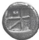
2. Aigina, drachm efter 400 fKr, tillförd KMK 1921, nr 1566. Åtsidan visar en sköldpadda och fransidan ett "Union Jack" liknande mönster.