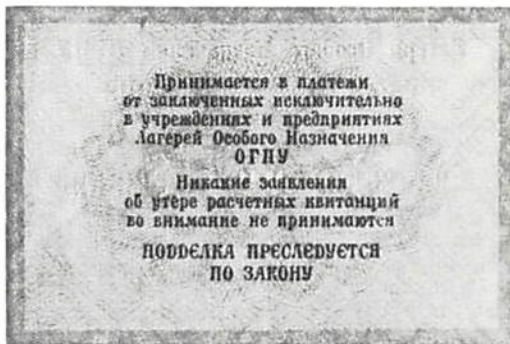
Sovjetisk lägersedel utgiven av OGPU 1929. Skala 1:1.

År 1929 köpte Kungl Myntkabinettet ett par sovjetiska lägersedlar från museiassistenten Aleksanders Platbärzdis. Sedlarna är av samma typ men i olika valörer och utgivna av den dåvarande säkerhetspolisen OGPU. Dessa sedlar var utförda i litet format, endast 75 × 53 mm. Exemplaren, som är utgivna 1929, har valörerna 2 kopek (brun) och 5 kopek (orange). Framsidans text lyder i översättning: "Läger för särskilda ändamål OGPU." Dessutom finns valören och årtalet utsatt.