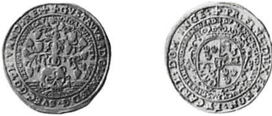
Bild 2. År- och fränsida av den dubbla dödsdukaten för Gustav II Adolf från år 1633, troligen även slagen (i silver) i Wölgast.