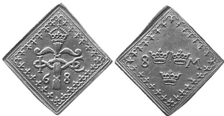
Sk blodsklipping, 8 mark klipping 1568, präglad i Vadstena.

siffrorna 68 (dvs [15]68). Frånsidan visar de tre kronorna och valörbeteckningarna (8, 4, 2 och 1 mark samt 4 öre) som alla är i högre valörer. Framställningen visar klart brödernas önskan att framstå som medlemmar av släkten Vasa; att de har rätt att ifrågasätta kungen och att de har mynt av fullgott silver – inte minst viktigt för att behålla soldaternas lojalitet. Orsaken till de höga valörerna står nog att finna i det praktiska för utbetalning av solden. Någon avsikt att cirkulera klippingarna i vidare kretsar fanns nog inte som en omedelbar tanke.