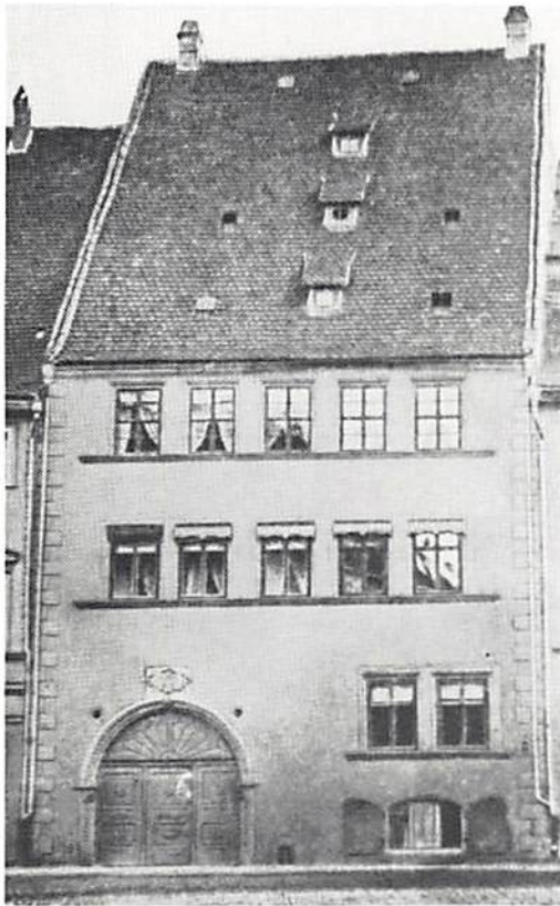
Bild 1. Huset „Zum Schwarzen Löwe“ (det svarta lejonet) som det såg ut omkring 1770. Där mottog den svenska drottningen under natten mellan den 16-17.11.1632 underrättelsen om att hennes make hade stupat. I dag heter huset Anger II och har förändrats en del. Till höger om ingången finns en liten minnestavla.

gare uppfattning. Vattenverket, i vilket man präglade, fanns kvar ända in på 1700-talet, noterat i en stadsplan över Erfurt med anmärkningen: „wüst und demoliert...“, dvs öde och demolerat! 15)