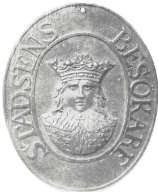
Besökarebricka från tidigt 1800-tal. Skala 1:1.