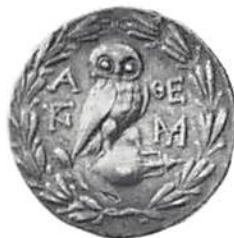
1. Athen, tetradrachm, 187/6 fKr, gäva från KMKV 1985, nr 1501. Åtsidan visar Athena Parthenos iförd attisk hjälm; fransidan visar en uggle sittande på en amfora.

Greek coins in the British Museum , nämligen den som behandlar Cyrenaica (1927). Mer om Robinson kan man läsa i bla Essays in Greek coinage, presented to Stanley Robinson , red CM Kraay och GK Jenkins, Oxford 1968 samt i Schweizer Münzblätter (1976), vol 26, nr 104, sid 89-90 av Herbert Cahn.