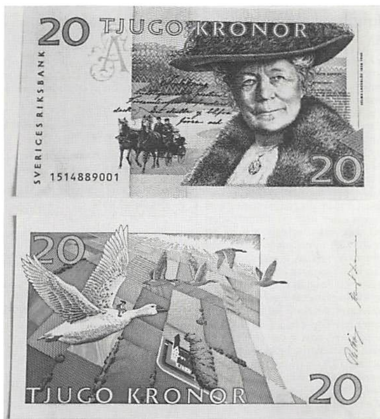
Den nya 20-kronorssedeln. Förminskad.

Bakgrunden är tryckt i blågrön, guldockra och purpur färg. Den guldockra färgen fluorescerar i blått vid ultraviolett belysning. Det tonade fältet i vänster- respektive högerkant är tryckt i grått. Sedelnumret är tryckt i en svart färg och fluorescerar i gulgrönt vid ultraviolett belysning. Hela ytan på sedelns framsida är tryckt.