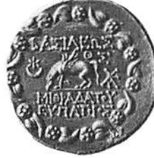
5. Pontos, Mithradates VI, ca 120-63 fKr, tetradrachm tidigare tillhörig Dr Otto Smiths samling och tillförd KMK 1930, nr 1864. Åtsidan visar ett huvud i högerprofil och frånsidan visar en betande Pegasus.