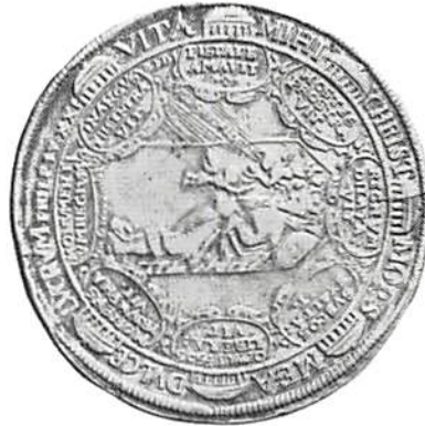
Bild 5. År- och fränsida av den dubbla erfurtska dödstalern för Gustav II Adolf 1634.

Den ovan citerade "Svenberg" åsyftar ett opublicerat m/s i Kungl Myntkabinettet av docent E Svenberg. Det innehåller översättningar av alla latinska inskrifter på svenska medaljer.