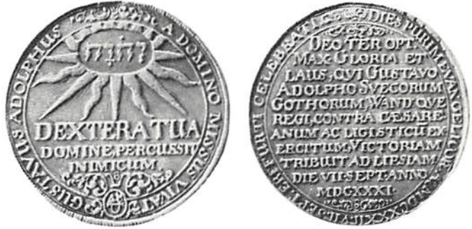
Bild 4. År- och fränsida av den erfurtska Purimaltern för Gustav II Adolf 1632, präglad till minne av slaget vid Breitenfeld föregående år.