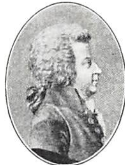
Mozart i mannaåren. Efter Nordisk Familjebok, v 18, Sthlm 1913. Skala 1:1.