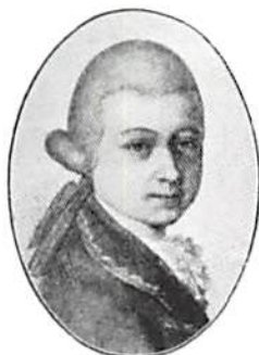
WA Mozart vid 14 års ålder. Efter Nordisk Familjebok, v 18, Sthlm 1913. Skala 1:1.