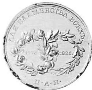
2. Maria Feodorovna, kejsarinna av Ryssland. Medalj utförd 1826 av greve Feodor Petrovitj Tolstoy (1783–1873) i harts (?) och överdragen med bronsfärg. Medaljen är ägnad 50-årsminnet av Maria Feodorovnas giftermål med Paul I.

I svensk ägo finns en medaljong i keramik av Maria Feodorovna, som föreställer Katarina II som Minerva, (fig 4) dvs den romerska gudinnan som var beskyddarinnan för allt slags hantverk och konstskicklighet – främst kvinnlig slöjd. Detta måste ha varit ett motiv som intresserade den konstintresserade kungliga artisten.