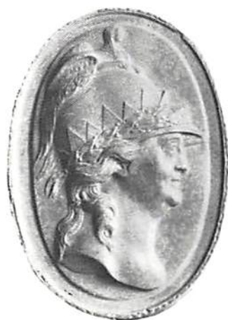
4. Katarina II som Minerva. Medaljong utförd av Maria Feodorovna, troligen från 1790-talet. Keramik.