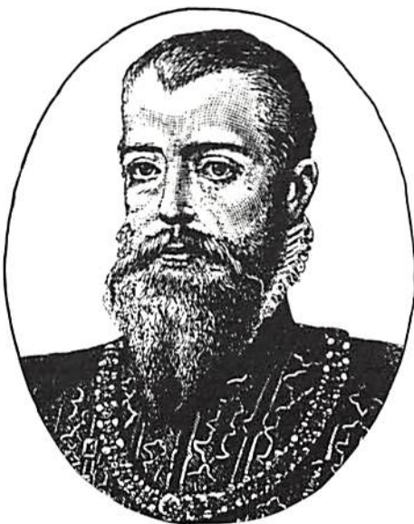
Erik XIV (1560 - 1568)