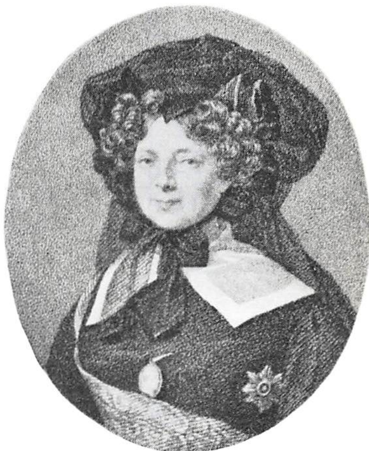
5. Maria Feodorovna som änka. Målning av G Dawe.