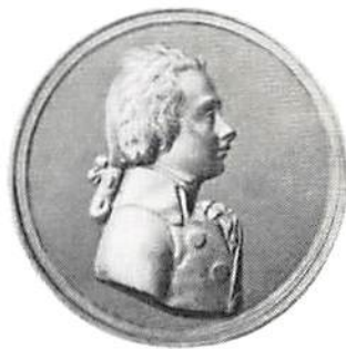
Moreau, även benämnd Mozart. Tenn, 85 mm, c 1806? (1790-93). Efter Hintze, plansch 70, nr 3. Skala 1:2.