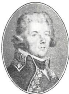
JV Moreau, fransk general. Efter Nordisk Familjebok, v 18, Sthlm 1913. Skala 1:1.