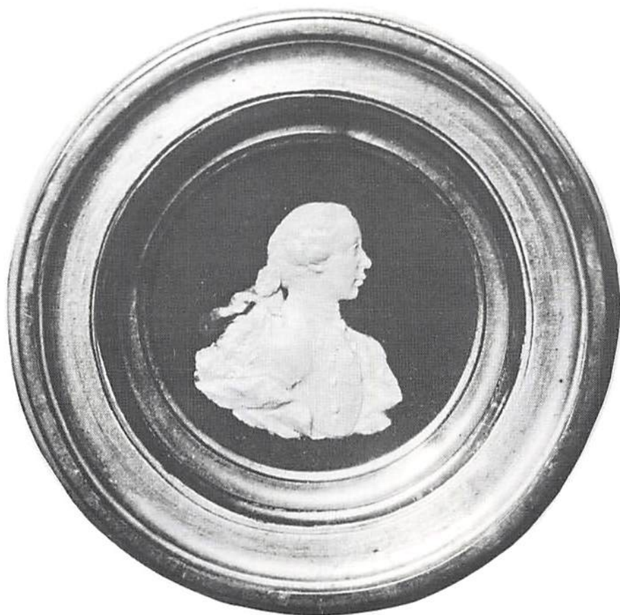
Vaxpoussering över greve Fredrik Ulrik von Höpken. Bilden troligen utförd av medaljkonstnären Daniel Fehrman. Ur Nordiska museets samlingar (inv nr 80084).