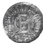
Forf.:s "misfoster."