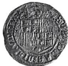
Fig 4. Spanien, Ferdinand och Isabella (1479–1537), dubbel excellent. Guld. Det mynt som motivet på Maria Stuarts bröllopsmynt går tillbaka till.

Utropspriset vid auktionen den 12 december 1990 var £ 20 000–25 000. Myntet såldes för 48 000 pund(!) till Dolphin Coins, Hampstead (prislista 1:1991, nr 652).