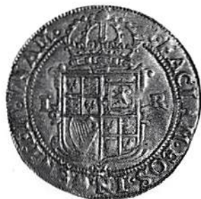
Fig 3. England, Jakob I (1603–1625), Maria Stuarts son och Skottlands konung som Jakob VI från 1567, unite (1604–1619). Guld.

Myntet med Jakobs båda föräldrar till minne av deras bröllop är en silverryll (valören infördes vid denna tidpunkt) till ett värde av trettio shilling. Det väger ca 28 gram och har en diameter på 42 mm. På åtsidan står som tidigare nämnts HENRICVS · & · MARIA · D · GRA · R · & · R · SCOTORVM med en tistel (Skottlands nationalblomma) som initialtecken. Henry till vänster och Maria till höger vända i profil mot varandra inom pärlring. Ingen av dem bär krona. Under bilden årtalet ·1565·. Dukaten från hennes äktenskap med Frans har ett liknande motiv, som för övrigt går tillbaka till Ferdinand och Isabella av Spanien – de första att använda dubbelporträtt på den här typen av mynt (fig 4). På fransidan ser vi den skotska vapenskölden krönt och med en tistel på vardera sidan, inom pärlring. Omskrift QVOS · DEVS · COIVNXIT · HOMO · NON · SEPARET (Dem Gud har sammanfogat åtskiljes ej av människan (!)).