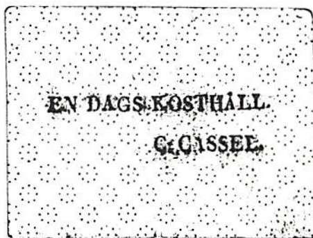
Fig 1. nr 289

Medlem av Sveriges Mynthandlares Förening