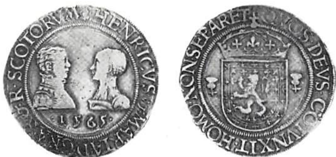
Fig 1. Skottland, Maria & Henry Stuart (1542–1567), ryal 1565. Utgiven i samband med deras bröllop. Silver.

Maria föddes den 8 december 1542. Hennes far, den av sitt folk avhållne skotske konungen Jakob V, avled redan inom en vecka efter dottrens födelse varvid det lilla barnet Maria, endast sex dagar gammal, ärvde Skottlands tron. Hennes mor, den nyblivna änkedrottningen med samma namn (Maria, av den mäktiga katolska släkten Guise i Frankrike), utsågs senare till Skottlands regent under sin omyndiga dotter. Som katolik bekämpade hon den alltmer utbredda protestantismen i landet, säkerligen inspirerad av sina franska katolska bröder.