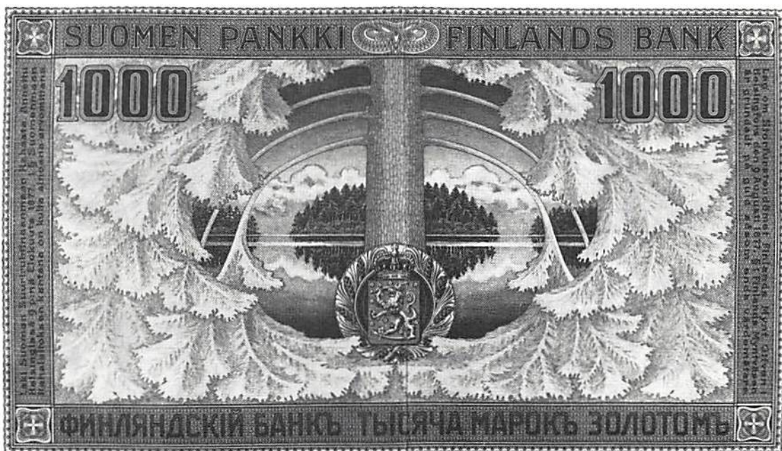
Den här sedeln, som ingår i den återfunna ryska krigskassan, har text på både svenska, ryska och finska.

I november 1917 proklamerade de nya makthavarna i Ryssland efter oktoberrevolutionen, att alla folk i det forna kejsardömet fritt skulle få bestämma om sin statsform, och med hänvisning till detta förklarade den finska landdagen den 6 december samma år Finland vara självständigt.