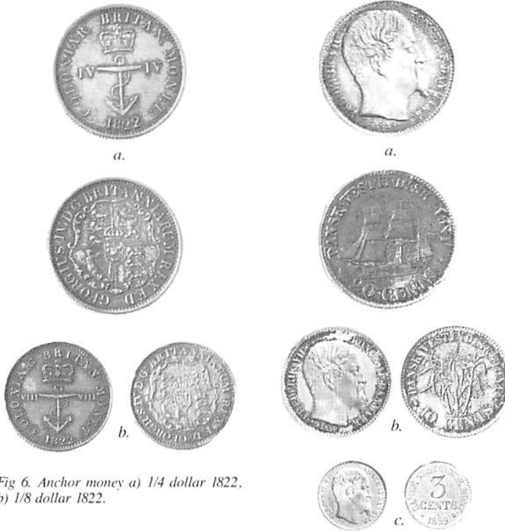
Fig 6. Anchor money a) 1/4 dollar 1822, b) 1/8 dollar 1822.