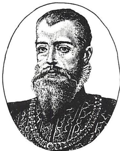
Erik XIV (1560 - 1568)