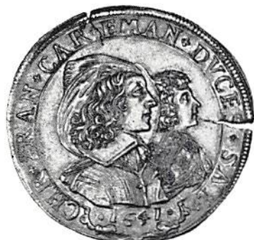
Åtsida till 10 scudi 1641 Savoyen.

myntsamlarna får en möjlighet att bjuda på guldmynt från Gustav II Adolf. Smäländsdukater, Daladukater samt en nästan komplett serie Bernadotte-guld. Samlare av kastmynt får här en möjlighet att köpa flera mycket ovanliga mynt. bl.a. Karl IX \frac{1}{2} rdr 1607 till kroningen. Gustav III:s kastmynt till prins Karl Gustavs födelse 1782. Karl XIII:s kastmynt till kroningen – ett avslag i guld med bäranordning – samt det mycket ovanliga kastmyntet till hans begravning 1818 med kronorna på globen. Även samlare av mer moderna mynt får en möjlighet utöver det vanliga. Vad sägs om 2-kronorna 1876 med brett årtal och stort respektive litet EB i hög kvalitet. 2 kronor 1878 med OCH. 50 öre 1877 i spegelglans m fl. Även Gustav V:s mynt i hög kvalitet finns med. För samlare av utländska mynt finns ett rikhaltigt urval av mynt från Danmark, Norge, Tyskland, Nederländerna, Österrike, Ryssland, Spanien, Italien m fl. En verklig raritet är ett italienskt guldmynt från Huset Savoyen, Carlo Emanuele II och hans mor Maria Christina, en 10 scudi från 1641 (se foto).