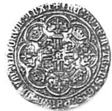
Nobel av den typ som hittades på Gotland 1838. Jordfunnet exemplar i KMK:s systematiska samling utan proveniens.