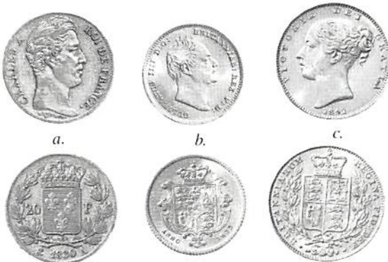
Fig 3. a) Frankrike 20 francs 1830, b) England 1/2 sovereign 1835, c) England 1 sovereign 1842.