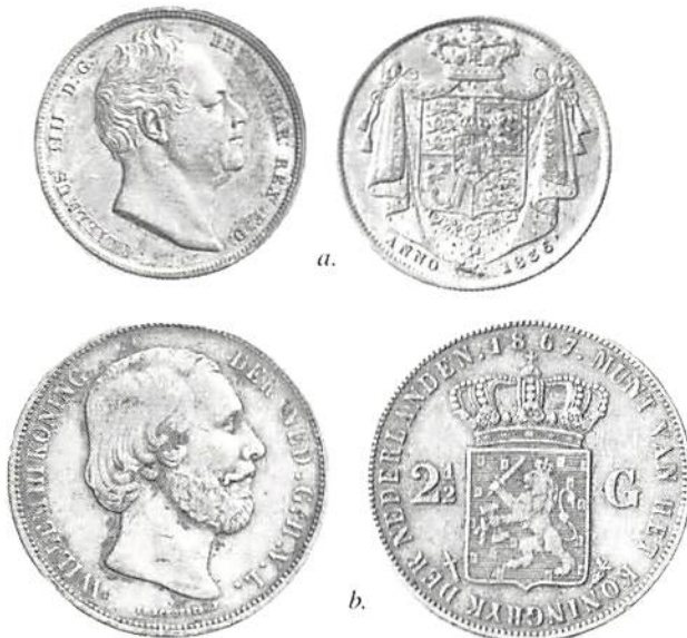
Fig 7. a) England 1/2 crown 1836, b) Nederländerna 2 1/2 Gulden 1867.

Den lilla skillnaden i värde mellan 1/4 dollar och shillingen respektive 1/8 dollar och 6 pence kan Haasum ha bortsett ifrån (fig 6). En liknande mystifikation finns i kungliga kassans inventeringsprotokoll av den 8 januari 1862. Bland konanterna uppräknas "En så kallad Maxwells 1/8 Dollar ... Sp. S 0,12 \frac{1}{2} ". På 1820-talet fanns en guvernör på St Kitts med namnet Maxwell. Han kan möjligen ha med benämningen att göra. Antagligen är det också här fråga om en 1/8 "Anchor" dollar.