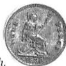
Fig 5. a) Mexiko 8 reales 1825, b) Guatemala 8 reales 1826, c) Bolivia 8 sueldos 1845, d) Nueva Granada (Colombia) 1 peso 1858, e) Frankrike 5 francs 1845, f)-h) England 1 shilling 1836, 6 pence 1834, 4 pence 1836.