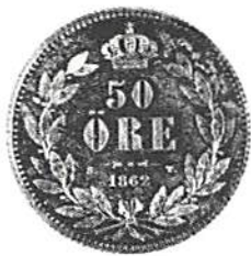
Åt- och fränsida av Karl XV:s 50-öring 1862.

I dagarna har myntkabinettet i Smålands museum haft glädjen att som donation få mottaga 50 öre 1862, Karl XV:s enda prägling av denna valör. Donator vill vara anonym. Myntet är en stor raritet – ganska säkert är det som typmynt i silver det mest sällsynta i Sverige under 1800- och 1900-talen. Några officiella uppgifter om antalet präglade exemplar finns inte att få, vilket fö dock gäller samma års präglingar av flera andra nominaler: 2 och 1 riksdaler riksmynt liksom 25 och 10 öre. Men sistnämnda nominaler finns också med andra årtal, varför ifråga om 1862 års rara silvermynt samlaren mest torde värdesätta 50-öringen.