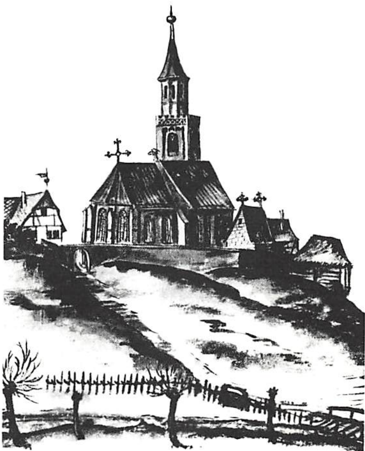
Fig. 1. Den äldsta bilden – en akvarell från ca 1610 – av S:t Mikaelsskyrkan i Fürth. Dess äldsta delar är från början av 1100-talet. Till höger med två kors på taket Heiligen-Grabkapellet, till vänster med fana på taket prästgården. Så såg det ut på Gustav II Adolfs tid.

Den är en förenkling av den stora minnestavlan (fig. 2), där omskriften lyder: Für Gottes Wort das Schwert ich führ, Herr Christe Dir gilts und nicht mir (I Guds namn bär jag svärdet, det gäller Dig Herre Kristus och icke mig). Till vänster på ramen en liten sköld med Vasa-vapnet över vil-