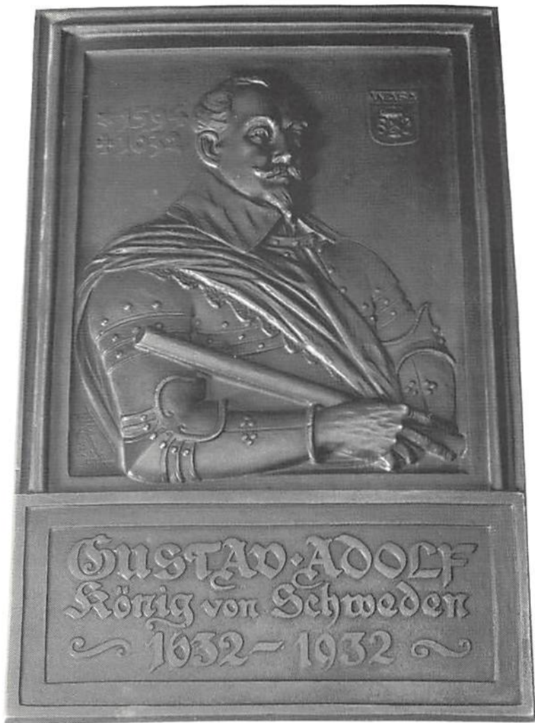
Fig. 3. Gjuten minnesplakett i brons, 270 mm × 168 mm, till 300-årsminnet av Gustav II Adolfs dödsdag. Miniatur efter minnestavlan fig. 2.