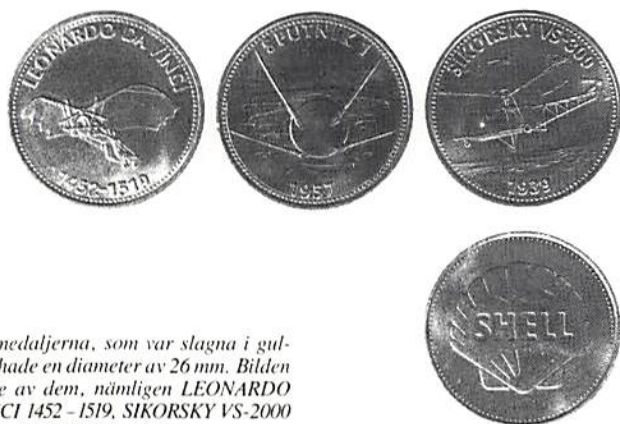
De 20 medaljerna, som var slagna i gulmetall, hade en diameter av 26 mm. Bilden visar tre av dem, nämligen LEONARDO DA VINCI 1452-1519, SIKORSKY VS-300 1939 och SPUTNIK 1 1957.

Bilisternas samlarintresse var väl emellertid ganska kortvarigt och kanske att jämföra med den period i skolan, då vi väl alla lidelsefullt men kortvarigt samlat frimärken, bokmärken, biobiljetter, idrottsstjärnor eller filmidoler. När Shells kampanj blåstes av, så föll medaljerna i glömska. De flesta har väl kastats bort, och idag hör man knappast talas om någon, som har en komplett samling. "Lätt fångat – lätt förgånget" är tyvärr det öde, som oftast drabbar efemära samlarobjekt.