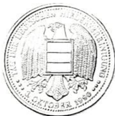
Minnesmedalj vid Tysklands återförening år 1990.

I anslutning till återföreningen har det slagits en minnesmedalj. Den visar på framsidan två syskon, som omfamnar varandra på gränsen mellan de båda tyska rikshalvorna och med texten DEUTSCHLAND EINIG VATERLAND 3. OKTOBER 1990. Baksidan av medaljen visar den tyska örnen och med texten TAG DER DEUTSCHEN WIEDERVEREINIGUNG 3. OKTOBER 1990. Medaljen har en diameter av 32 mm, väger 13 gram och har en silverhalt av 24 procent.