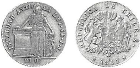
Fig 2. Chile 1/2 doubloon (4 escudos) 1841.