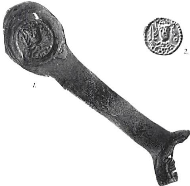
1. Blyavtryck av myntstamp, troligen från 1180-talet. Sigtuna-grävningarna 1988. 2. Silvermyntet (en brakteat med valören 1 penning i Svealandsskränning) tillhör Kungl Myntkabinettet. Det härrör ur ett äldre fynd. Myntet har slagits med samma verktyg som gjort avtrycket på blybiten.

Vi vet absolut ingenting om hur myntningen var organiserad i Sverige vid denna tid. Mer än hundra år tidigare satte myntmästarna ut sina namn, men nu fanns det inte plats för sådana upplysningar. Brakteatmyntningen var en teknik som uppstod i Tyskland i början av 1100-talet. Vi måste alltså lärt oss den söderifrån. Gravera kunde våra guldsmeder men vi får inte utesluta möjligheten att de flesta tidiga gravörerna var utlänningar. De namn som finns bevarade på myntmästare i vårt land – de tidigaste från början av 1300-talet – är tyska. En del av gravörerna kan naturligtvis ha varit svenskar. Troligen hämtades de – som ofta i senare tid – bland guldsmeder och sigillgravörer. När det inte behövdes mynt kunde en sådan gravör ägna sig åt att göra smycken åt köpstarka personer eller tillverka sigill åt kungen, biskoparna och jarlen.