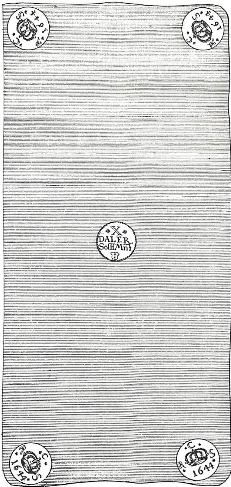
46. MARCK . VICTUALIE . WICHT .

10 daler s.m. nr 1644. Plåtmyntet ur Rålamb's samling (efter katalog i Kungl. Myntkabinettet), som förvärvades till Riksbankens samling och på okänt sätt försvann ca 1800.