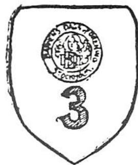
Teckning av Barnens dagsmärke för bössinsamlare.