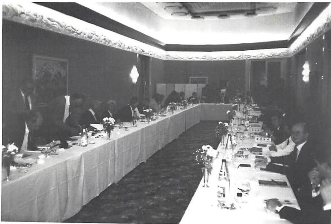
Vy över auktionssalen.

de" 7 500 SFR till en stockholmshandlare. En annan mynthandlare från Stockholm sålde myntet till Schmitz omkring 1980, men då till ett avsevärt lägre pris. Nyssnämnda är bara ett av många exempel på hur "omöjligt" det varit att i förväg uppskatta auktionspriserna. Möjligheterna till prismässiga fynd pga låga förhandsvärderingar tedde sig onekligen lockande men verklighetens klubbade priser tillhörde knappast kategorin "önskedrömmar", åtminstone inte om man var köpare. Men utbudet var ändå så pass omfattande att en och annan "dröm" verkligen gick i uppfyllelse vilket också kommer att exemplifieras.