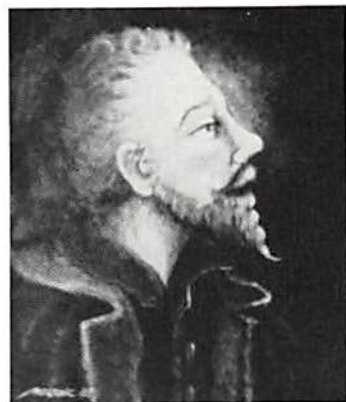
Conrad Stutz. Oljemålning 30×35 cm av Hans Nowak 1985.

Av kalken kvarstår endast foten. Den visar på undersidan - framställd i finaste gravyrarbete i en inramad