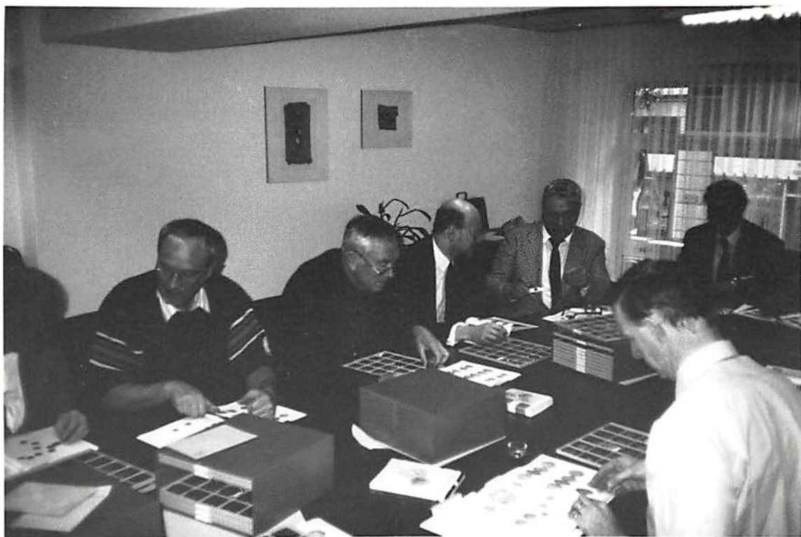
Från visningen av auktionsmynten.

garna för det stora visade intresset och delade ut en tavla till den som köpt det dyraste myntet. Det var ett gammalt kopparstick över Sverige från den tiden. Att deltagarna bjöds på en så påkostad bankett berodde givetvis delvis på, att antalet närvarande inte vara så stort och kanske vidare på att detta var den första auktion, som Spinks och Bankverein höll tillsammans.