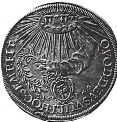
Hertig Bernhards taler 1634 (Myntort Würzburg), Davenport C 6670. Något förstord.

Adolfs och Wallensteins båda härar från juli månad till början av september slagit läger vid Nürnberg och Fürth. Från slutet av augusti till den 3 september pågick en hård, massiv artilleribeskjutning och stormangrepp av svenskarna mot Wallenstein och den bayerske kurfursten Maximilian I, vilka fjärran från Fürth framgångsrikt försvarade det strategiskt viktiga berget, die Alte Veste.