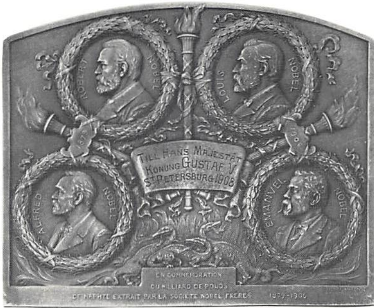
Fig 3 Åtsidan (frånsidan samma som fig 1)