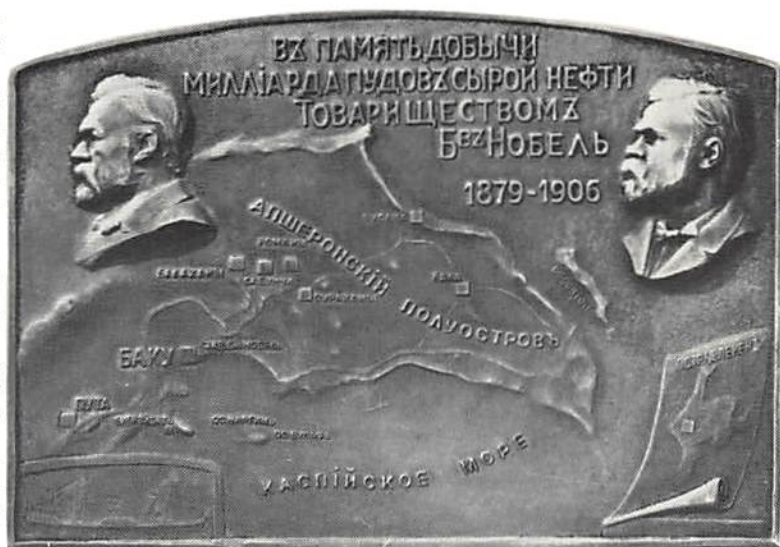
Fig 2 Åtsidan