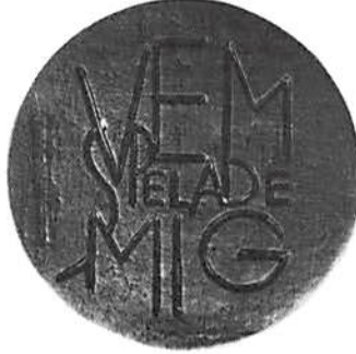
Medaljen i silver. Kungl. Myntkabinetet.