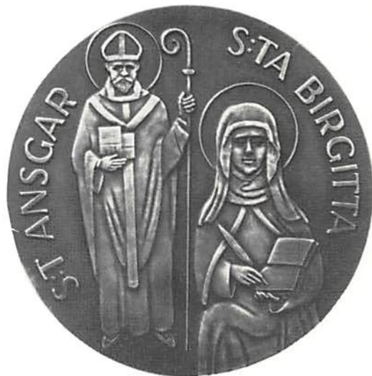
Exemplar av medaljen i Kungl Myntkabinettet.

men) och den som först av alla predikade kristendomen hos oss, nämligen i Birka (830). Bredvid läses längs kanten S:T ANSGAR. Han är framställd som stående i sin ärkebiskopskrud, bärande mitra på huvudet – omkring detta en helgongloria – och hållande i höger hand en kyrkbyggnad, i vänster en kräkla samt iförd stola, pallium och halslin. Förebilderna har i detta fall varit Otto III:s evangeliarium från ca 1000 (i Reichenau) och ett altarantependium i San Ambrogio i Milano. Till höger den sittande S:ta Birgitta (av medaljkanten avskuren nedanför knäna), längs kanten S:TA BIRGITTA, iförd änkedok och klänning med kapuschong samt med vänster hand hållande sitt helgonattribut, en (uppslagen) bok, i vilken hon skriver med en gåspenna i höger hand. Bilden är en "sammanfattning" av flera skulpturer, bl a i Vadstena klosterkyrka.