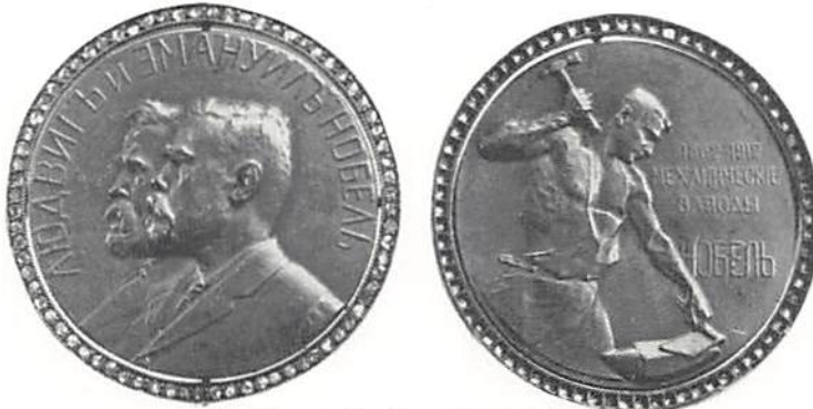
Fig 4 År- och frånsidan. Dubbel skala.

(Louis), Alfred och Emanuel Nobel. Plaketten är slagen 1907 och mäter 101×82 mm. Åtsidan visar fyra medlemmar av familjen Nobel inom lagerkransar som sammanflätats med facklor. På två av dessa facklor finns plattor med årtalen 1879 och 1906. På åtsidans mitt finns en banderoll med den inristade texten: TILL HANS MAJESTÄT KONUNG GUSTAF V S:t PETERSBURG 1908. Under denna banderoll finns på en sockel tre urtidsdjur som representerar oljans bildningssätt. Bergolja utgör nämligen omvandlingsprodukten av i havs-sediment inneslutna växt- och djurlämningar, huvudsakligen från jura- och kritaperioderna. Nederst texten: EN COMMEMORATION DU MILLIARD DE POUNDS DE NAPHTHE PAR LA SOCIÉTÉ NOBEL FRE-