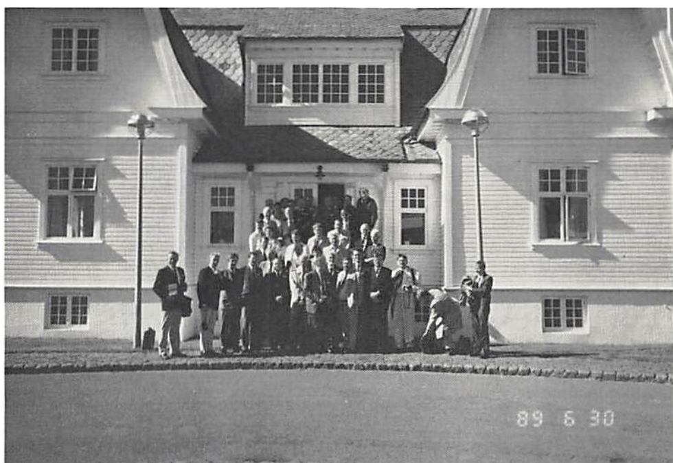
Unionsmötet framför Hofdihuus i Reykjavik; mottagning på inbjudan av stadens borgmästare.