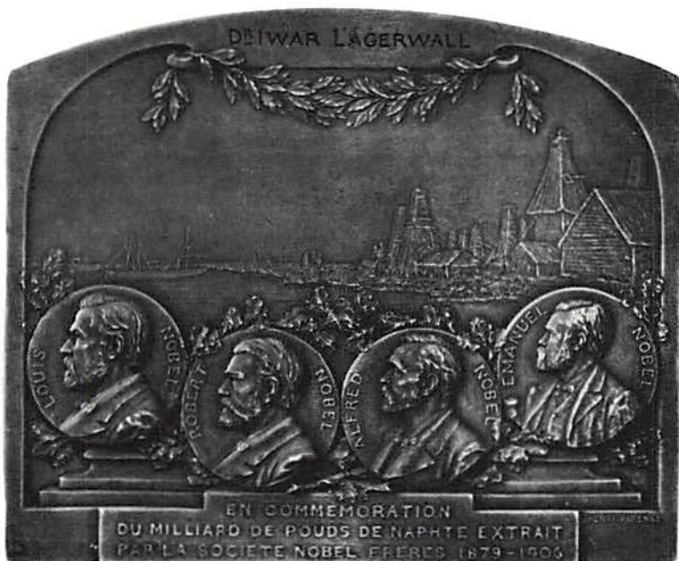
Fig 1 Åtsidan

Plaketten av silver är slagen 1907 och mäter 102×82 mm. Den visar en vy av petroleumanläggningarna vid Baku, med stadens hamn. Nedanför denna scen finns på en sockel porträtten över Ludvig (Louis), Robert,