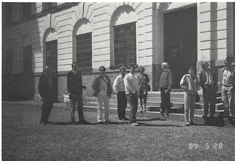
Från söndagens utflykt efter lördagens årsmöte: vid Skokloster.

mycket instruktivt och trevligt berättade om Loheskatten.