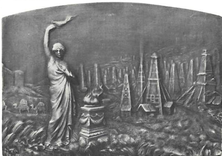
Fig 2 Frånsidan