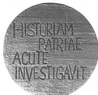
Silverexemplar i Kungl. Myntkabinetet.