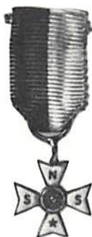
Skala 1:1

Med vänlig hälsning AB Sporrang, Norrtälje Stig Stefansson