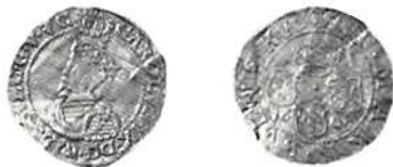
Fig. 3. Sverige, Karl IX, Stockholm, 6 mark 1609, guld.

Under Karl IX (1604–11) präglades guldmynt i markvalörer huvudsakligen i Stockholm men också i Göteborg. I Stockholm slogs i runda mynt 16 mark (karolin) och 6 mark, i klippingar 10 och 5 mark. I Göteborg slogs 6 mark i rundmynt. Praktmynt i guld om sex dukaters vikt präglades i Stockholm åren 1606, 1607, 1608 och 1609 i något varierande utförande varje år. I skatten från regalskeppet Kronan påträffades ett dittills okänt praktmynt med en vikt motsvarande 10 dukater (portugalös) präglat för Karl IX år 1606. Detta väger 34,34 gram. Vi känner alltså till sex olika valörer i guldmynt från Karl IX:s regeringstid och dessutom kastpenningen till konungens kröning år 1607 om 16 mark. Karl erhöll redan som hertig egen mynträtt och utgav då klippingmynt i guld om 8 mark. Klippingarna frestade i sin enkelhet till efterbildningar och sådana gjordes också uppenbarligen redan under 1600-talet. 4