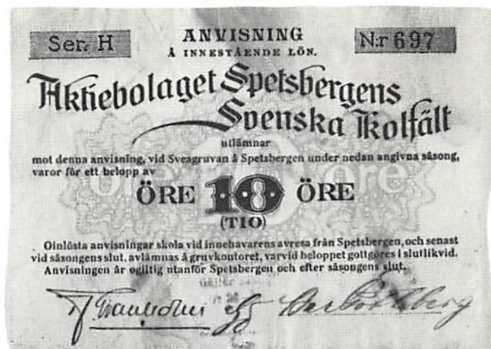
Spetsbergens Svenska Kolfält, 10 öre.