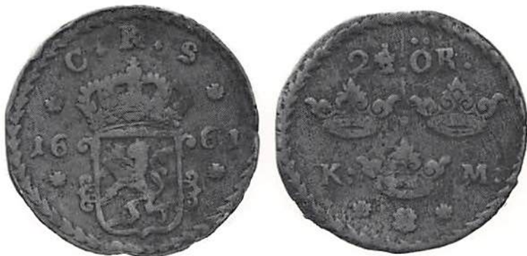
Karl XI, 2 1/2 öre km 1667.