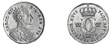
Karl XII, 1 dukat 1718.

Ur avdelningen svenska och utländska sedlar ger vi här några exempel på vad som bjöds ut: