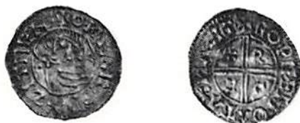
Olof Skötkonung, LL2a.