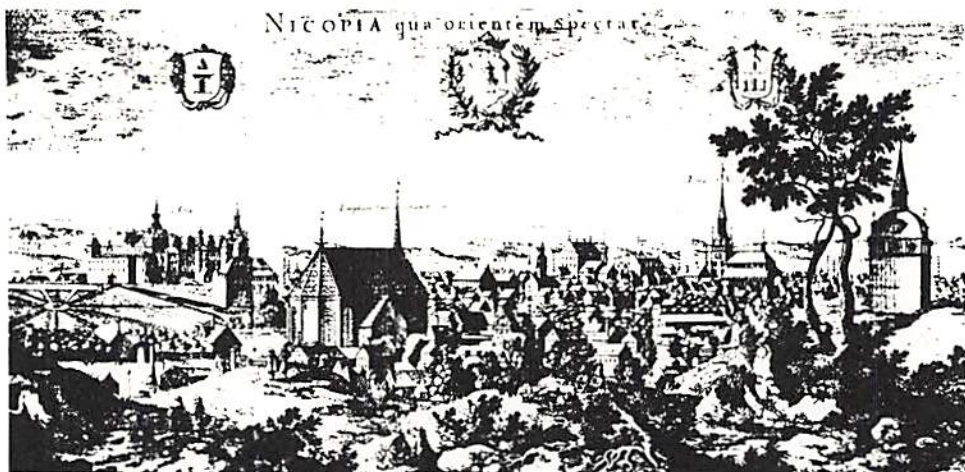
Fig. 1. Nyköping före den stora stadsbranden 1 juli 1665. Ur Erik Dahlbergs Suecia antiqua et hodierna .