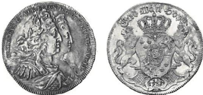
Fredrik I och Ulrika Eleonora, 1 ndr 1731.