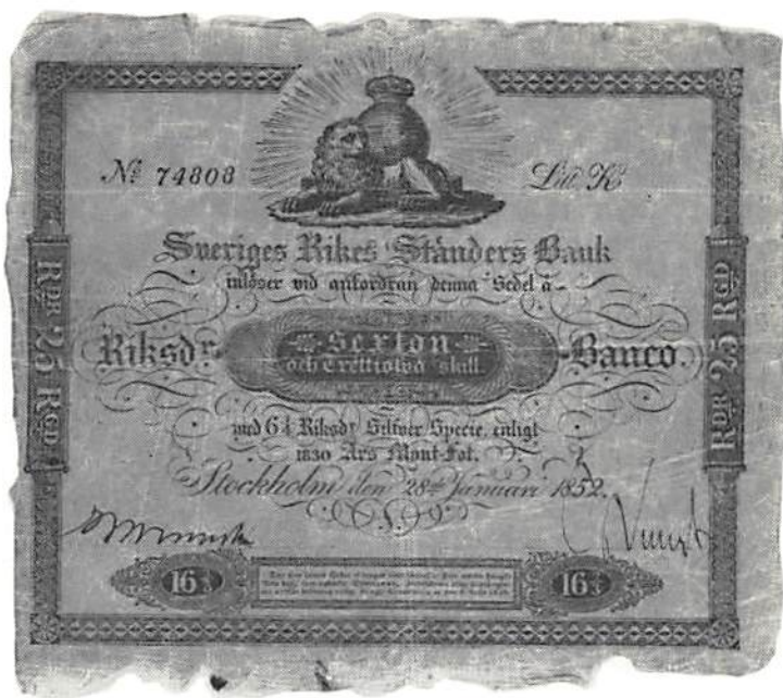
16 2/3 rdr banco 1852.