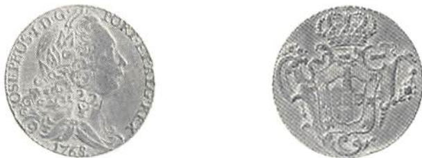
Fig 2. Portugisisk moed kontramarkerad med 22 över örn.

skulle föreslå lämpliga åtgärder. Den 31 oktober utfärdades en proklamation, vari först kommittén fick en känga med orden att "bemälte Comité icke welat befatta sig med detta wigiga ämne." Beträffande moederna bestämdes att de skulle värderas till 11 bits för varje pennyweight. I fortsättningen måste alltså mynten vägas. Enligt guvernören förbättrades situationen under de följande åtta månaderna och moeder under 7 pennyweight blev sällsynta. Den 20 augusti 1798 kom så en proklamation som förbjöd alla moeder under 7 pennyweight.