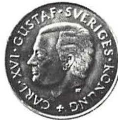
Två åtsidesvarianter föreligger av 100 kronor 1988, Delaware-jubileet.