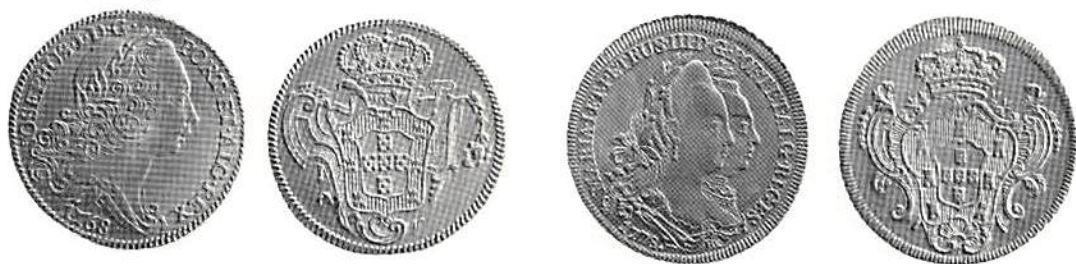
Fig 1. Portugisiska moeder a) Josef I 1768, b) Maria I och Petrus III 1778.