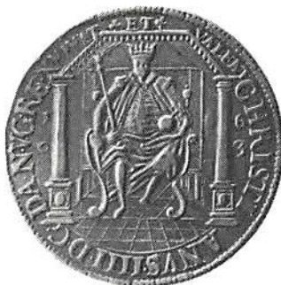
Speciedaler 1603 RRR värdering 30.000 kr