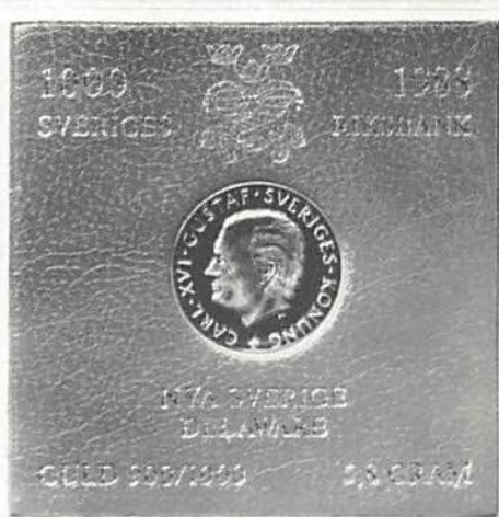
1000 kronor 1988 i sitt etui.

ningar från Sigtuna, 1000 år! Låt det beryktade bolaget Franklin Mint sköta rulljangsen — det kan åtminstone elementa, när det gäller marknadsföring!