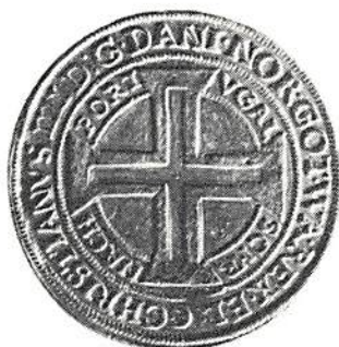
Portugalös 1591 RRR värdering 200.000 kr

Innehåller medeltid, typsamling efter Hede-nummer från 1541, medaljer och en komplett samling Danska Västindien.