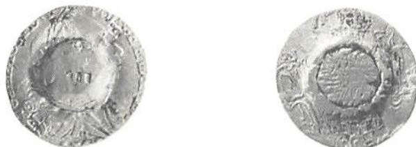
Fig 3. Pluggad moed.

Ären gick och bekymren fortsatte trots lagstiftningen. Generalkonsuln Carl Tottie skriver från London hem till hovkanslern Gustaf af Wetterstedt så sent som den 25 december 1818 "att