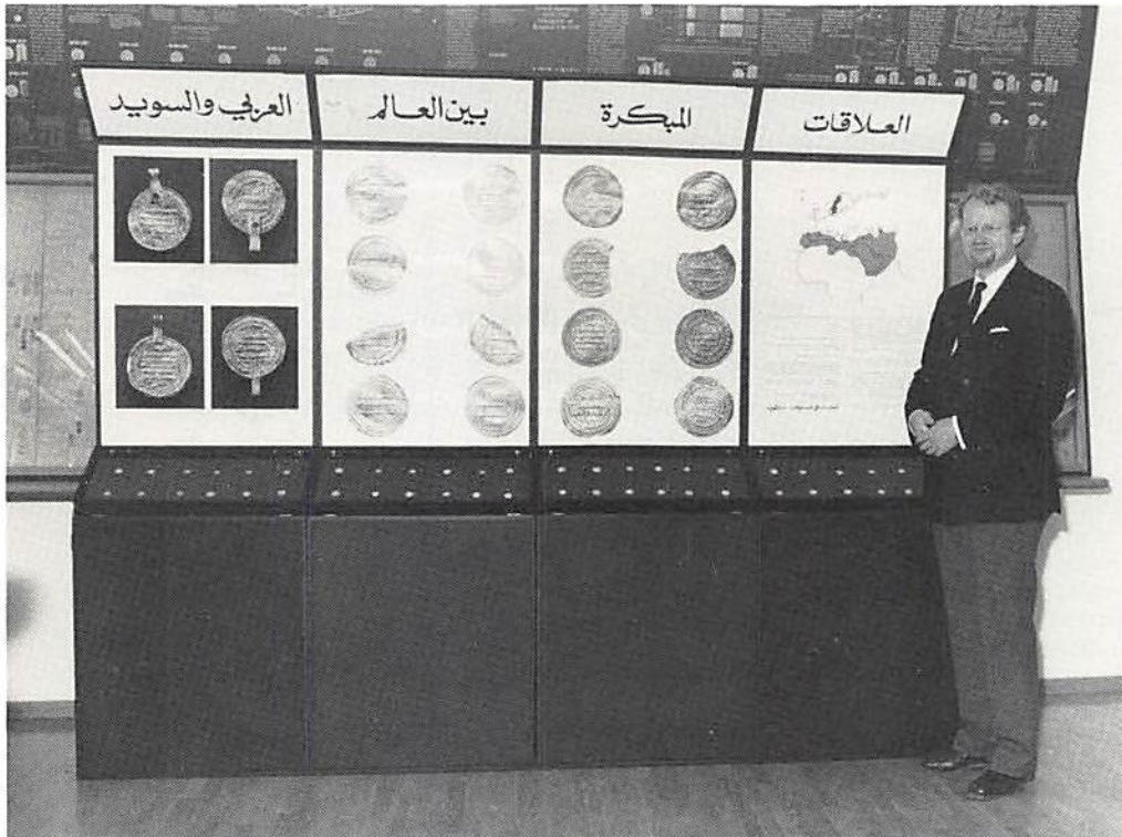
Utställningen provuppställd i Kungl Myntkabinettet före avfärden till Främre Orienten.

Mu c taḍid billāh (279–89 eH = 892–902 eKr) i Madīnat al-Salām, vilket var det officiella namnet på huvudstaden Bagdad, i Irak år 287 eH = 900 eKr. Det fjärde myntet är präglat i Dimašq (Damaskus) i Syrien under den umajjadiske kalifen Hišām (vars namn dock ej är omnämnt å myntet) år 122 eH = 739/40 eKr. Det femte myntet är präglat i Mišr = Egypten (betecknande al-Fustāt då Gamla Kairo) under den c abbāsidsiske kalifen al-Rašīd (bekant från sagosamlingen Tusen och En Natt) 170–93 eH = 786–809 eKr) år 181 eH = 797/8 eKr; å myntet omnämnes väl ej namnet å kalifen men tvenne andra personers, nämligen dennes sons och utsedde arvtagares al-Amīns, vilken ock kom att efterträda al-Rašīd och regera 193–8 eH = 809–13 eKr (att låta prägla mynt i tronföljarens namn är ej helt ovanligt bland c abbāsidsiska kalifer), därjämte omnämnes ock namnet å kalifens vezir Ġa c far ibn Jahjā av barmakidernas ätt, även han bekant från ovannämnda sagosamling, han var vid tiden för detta mynts prägling hedersguvernör över bl a Egypten. Det sjätte myntet är präglat i Ifriqijah, vilket var namnet å en provins inom Kalifatet motsvarande ungefär det nutida Tunisien med huvudstad i Qajrawān år 165 eH = 781/3 eKr under den c abbāsidsiske kalifen al-Mahdī (158–169 eH = 775–85 eKr); här omnämnes förutom kalifens namn även sonens/tronföljarens i detta fall Hārūn sedermera kalif under namnet al-Rašīd (se