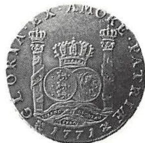
Piaster 1771 R värdering 100.000 kr

Katalogen ingår i firmornas vanliga abonnemang. Lösnummerköpare erhåller katalogen enklast genom insättning av 50 kr på postgiro 3003-1.