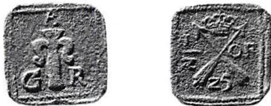
Fig 1. 1/2 öre klipping 1625 från Uppsala Universitets myntkabinett. Vikt 12,68 g. Observera den mycket korroderade ytan.

I samband med SNF:s årsmöte i maj 1987 gjordes en mycket intressant och viktig iakttagelse vid besöket i Uppsala Universitets myntkabinett. I dess mycket förnämliga utställning uppmärksammades en klipping — 1/2 öre 1625 (SM 171, fig 1) i den provmyntserie, vars mest berömda medlem är ettöret med s k spansk sköld.