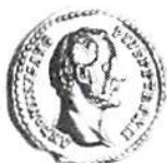
Antoninus Pius Aureus