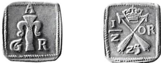
Fig 2. 1/2 öre klipping 1625. Ekströms exemplar, Ahlströms auktion 14:71. Kval 1+. Vikt 14,05 g.

Nu förhåller det sig emellertid så, att flera av dessa mynt företer tydli-