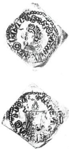
Olav den helige (1015–1030), penning på fyrkantig platt, såld 12 mars 1988.

tväsidiga penning (från Bergen?) med norska riksvapnet (8000 Nkr) och Håkon V Magnussons (1299–1319) Oslopenning med krönt huvud, och utropet 12.000 Nkr, bägge kommenterade av Skaare. Mynten fram till våra dagar är rikt representerade och till stor del kvalitetsmässigt högstående. Den rara 20 kronor 1883 dök upp ännu en gång (50.000 Nkr); på förra auktionen gick den till 100.000! Den antika delen uppvisade också några rariteter, där man särskilt vill nämna en aureus från Pertinax' korta regering (193 eKr) i hög kvalitet (100.000 Nkr).