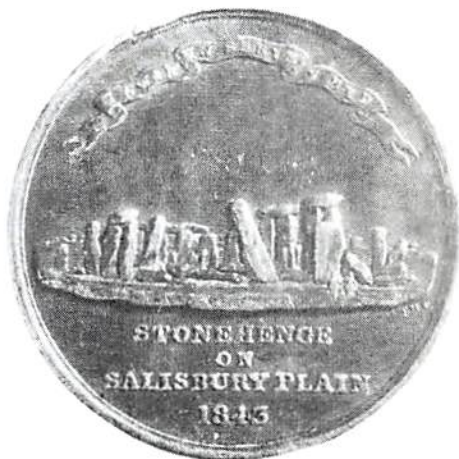
En tidig souvenirmedalj visade Stonehenge. Medaljen tillverkades 1843.