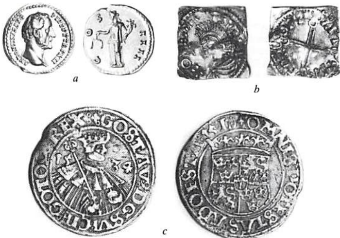
Auktionsverket, några objekt: a. Rom, Antoninus Pius, aureus; b. Olof Skötkonung, Sigtuna, Thregr, penning på fyrkantig platt; c. Gustav Vasa, 1/2 daler 1534.