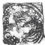
Olof Skötkonung Mm. Thregr. RR