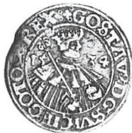
Gustav Vasa 1/2 daler 1534. RRRR