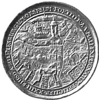
Kristian IV:s medalj över Älvsborgs intagande 1612. Liksom följande Kungl. Myntkabinetet, Stockholm. Foto.

Den 2 maj hade han seglat ut från Kronborg med örlogsflottan, åtföljd av 41 transportfartyg, den 5 hade han landstigit vid Göta älvs mynning. Från Bohus kom tungt artilleri, och från provinserna hjälptrupper. Älvsborg belägrades av cirka 10 000 man. Men den var i gott stånd och välförsedd med ammunition och proviant.