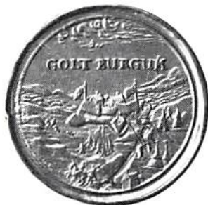
Gullbergs fästnes intagande 1612.