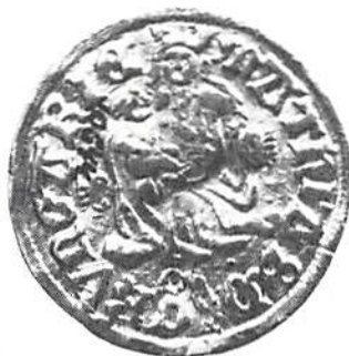
Ungersk dukat, präglad under Mattias Corvinus regeringstid, funnen i Glömminge socken 1898. Kungl. Myntkabinettet. Foto: ATA, skala 2:1.

Det är relativt ovanligt med tidiga utländska guldmynt funna i svensk jord (om man då bortser från senromerska guldmynt). I Kungl. Myntkabinettets samlingar finns en mycket vacker ungersk dukat från mitten av 1400-talet. Fyndomständigheterna är följande: