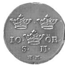
Figur 1. 10 öre SM 1739. Gällde enligt myntordningen för 12 öre SM (liksom 5 öre gällde för 6 öre SM). Kungl. Myntkabinettet.

Om Tjotälning, eller Decimalers häfd i Bokhålleri och Räkning, som rör Mät, Mål, Wigt och Mynt, utan rubning i de wanlige inrättningar.