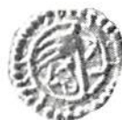
LL IV:8 a 1229

Till våra läsares fromma tar vi ännu en gång med de tre bilderna från föregående nummer. Ovan alltså: a. LL IV:8a, 1229, b. LL VIII: 1, 1247–51 och c. LL XVIII:B:1, 1278–80. Kungl. Myntkabinettet.