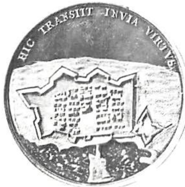
Dansk segermedalj över Vänersborgs intagande 1676.

trakten av Vänersborg. På framsidan en bild av Vänersborgs stad och skans med den befästa bron över kanalen Karlsgrav.