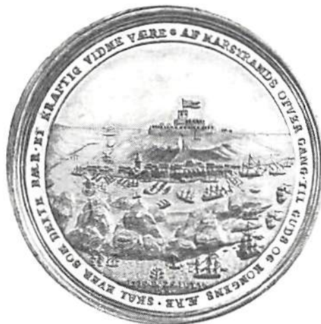
Marstrands erövring 1719 framställd på en dansk medalj.