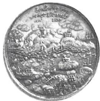
Marstrands fästning stormas 1677. Foto Bengt A. Lundberg, Raå.