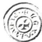
LL VIII:1 1247–51